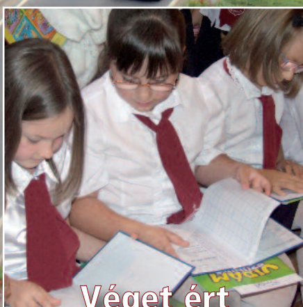
Véget ért a tanév