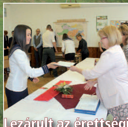
Lezárult az érettségi a középiskolákban