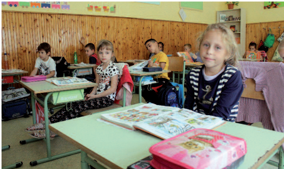
A Bolyaiban is nagy az igény a napközis ellátás iránt.

Elkezdődött az idei tanév, de a tanulólétszám még nem végleges, folyamatosan változik. Két szakközépiskolai osztályt és három szakkepző csoportot indítottunk, eddig összesen 415 diákunk van, negyven pedagógussal és négy óra-