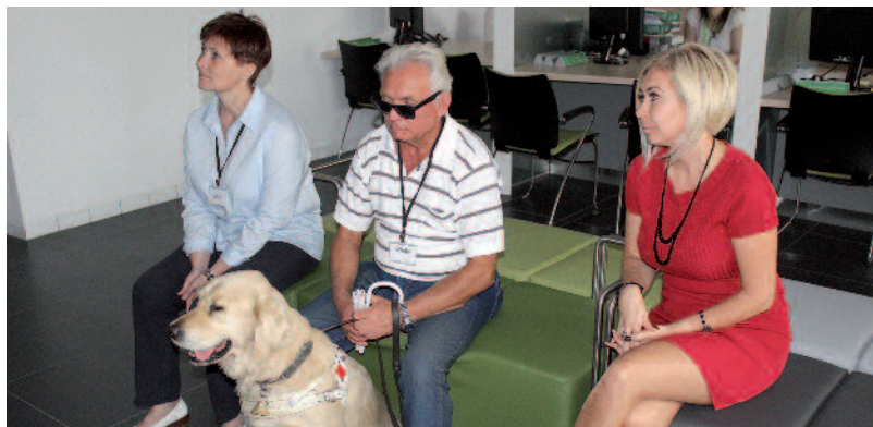
Szemléletformáló nap a járási hivatalban.

A Vakok és Gyengénlátók B.-A.-Z. Megyei Egyesülete a Norvég Civil Támogatási Alap pályázati támogatásával 2015. április 1. és 2016. április 30. között szemléletformáló napokat rendez a megyében „Ismerj meg, hogy segíthess!” címmel. A projekt során húsz közintézményben, összesen száz ügyintéző bevonásával szerveznek programokat a látássérültek speciális problémáinak és azok megoldási módjainak átadására. Szeptember 10-én a Szerencsi Járási Hivatalhoz tartozó Kormányablak volt a kezdeményezés újabb állomása.