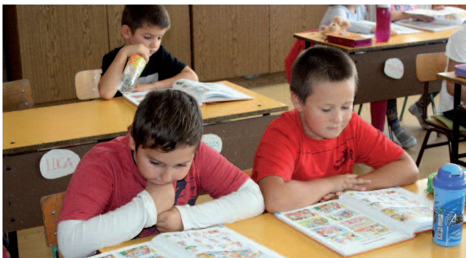
A Rákóczi iskolában közel 470 diák kezdte meg a tanévet.

A Bolyai János Katolikus Általános Iskolában 450 diák kezdte el a tanulmányi időszakot, 10 alsó és 8 felső tagozatos osztályban. Az első napok tapasztalatairól elmondhatom, hogy a szülők, a diákok és a pedagógusok összefogásával tovább szépültek a tantermek, hiszen a nemrég befejeződött felújítási munkálatok miatt falfestésre volt szükség, valamint egységes függönyök kerültek az ablakokra. Kialakult az órarend, a délutáni elfoglaltságok a helyükre kerültek, a terembeosztások tekintetében sincs probléma, az órák közötti vándorlások gördülékenyen mennek. Sok a napközis és menzás diákunk, az alsósok szinte mindannyian, a felsősök közül 52-en kérték a délutáni el látást. A visszajelzések alapján a diákoknak nagyon ízlenek a konyhai ételek. A gyermekek újra birtokba vehették az iskolaudvart, ami az elmúlt tanévben az építkezés miatt le volt zárva, illetve amíg szép az idő, a várkertben is tartunk testnevelés órát. Hamarosan megkezdődik az úszásoktatás, az első félévben iskolánk valamennyi tanulója részt vesz rajta a Városi Tanuszodában.