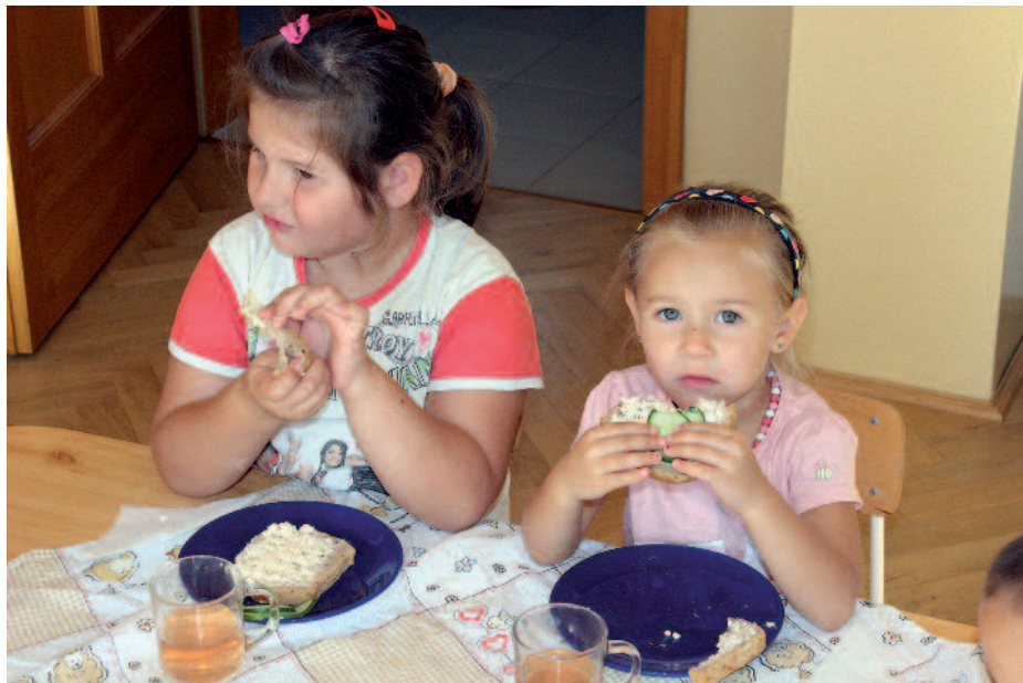
A szerencsi bölcsődében és az óvodákban szeptembertől 260 gyermek számára ingyenes az étkezés.

körülmények között élhessenek hazánkban. A szeptember 1-jétől kiterjesztett ingyenes gyermekétkeztetéssel egy olyan család, amely eddig nem kapott ilyen támogatást, havonta gyermekenként 7-10 ezer forintot takaríthat meg.