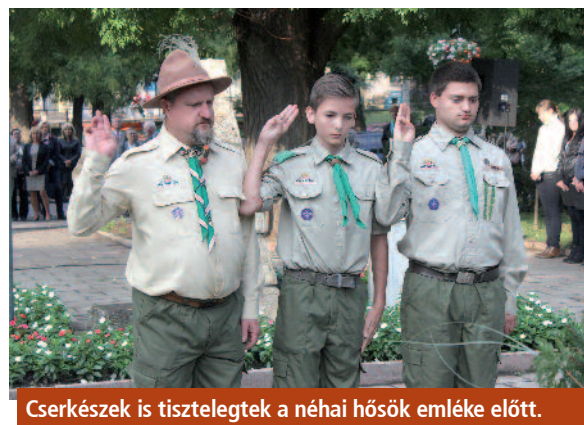
Cserkészek is tisztelegtek a néhai hősök emléke előtt.

ország ajtaján, akik jó szándékkal érkeznek, akik barátokként kezelnek minket. Jogunk van ahhoz, hogy megvédjük az igazságot a tizenhárom aradi vértanú nyomdokán büszkén kell vallanunk, hogy a