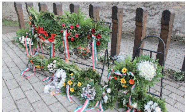
Az önkormányzat mellett civil szervezetek és pártok helyezték el koszorút az aradi vértanúk kopfájánál.

hősök vére életet teremt – mondta beszédében a parókus.