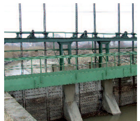
A szerencsi horgászat jövője szempontjából elengedhetetlen a zsilip felújítása.

A másik vizünk a Szerencs-patak. Az SZHE tagjai a víz teljes hosszában, az eredettől, a feckési hidig horgászhatnak. Itt el kell mondanom, hogy nagy szükség van a zsilip felújítására, amire korábban már kaptunk ígéretet. Ha a mederzár végre elkészül, akkor megkezdődhet a hűtőtavak feltöltése. Sokan nem tudják, de idén ősszel megtörtént az egykori cukorgyári medrek mélyítése, a környezet rendbetétele. Egyelőre még folyamatban van a vízjogi engedélyezési eljárás, csak ezt követően kezdődhet a tavak feltöltése, halasítása. Mindezek előtt azonban hangsúlyozom, a legfontosabb az elavult állapotú zsilip rekonstrukciója.