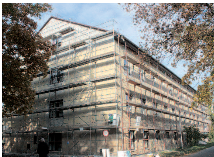
December végére készülhet el a Szerencsi Idősek Otthona külső hőszigetelése.