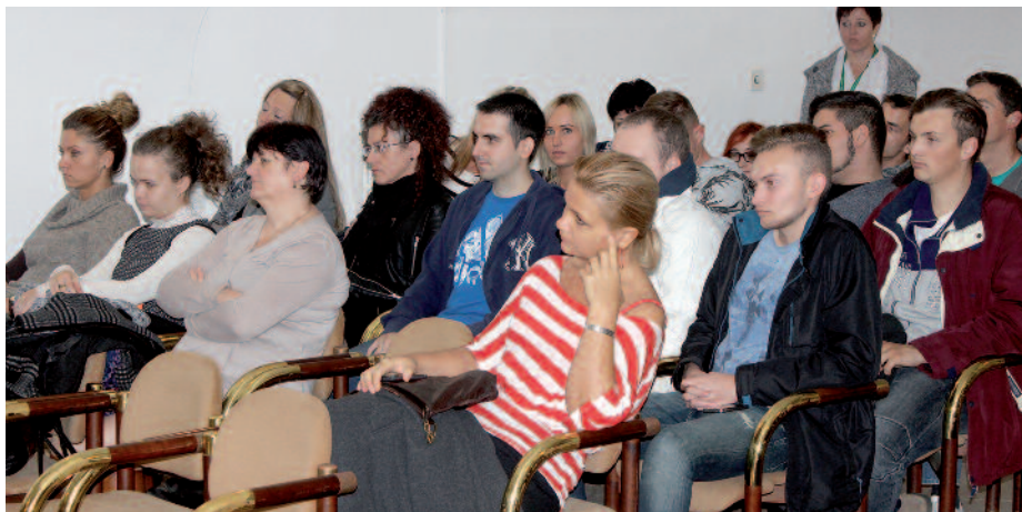
Projektzáró résztvevői a Rákóczi-várban.