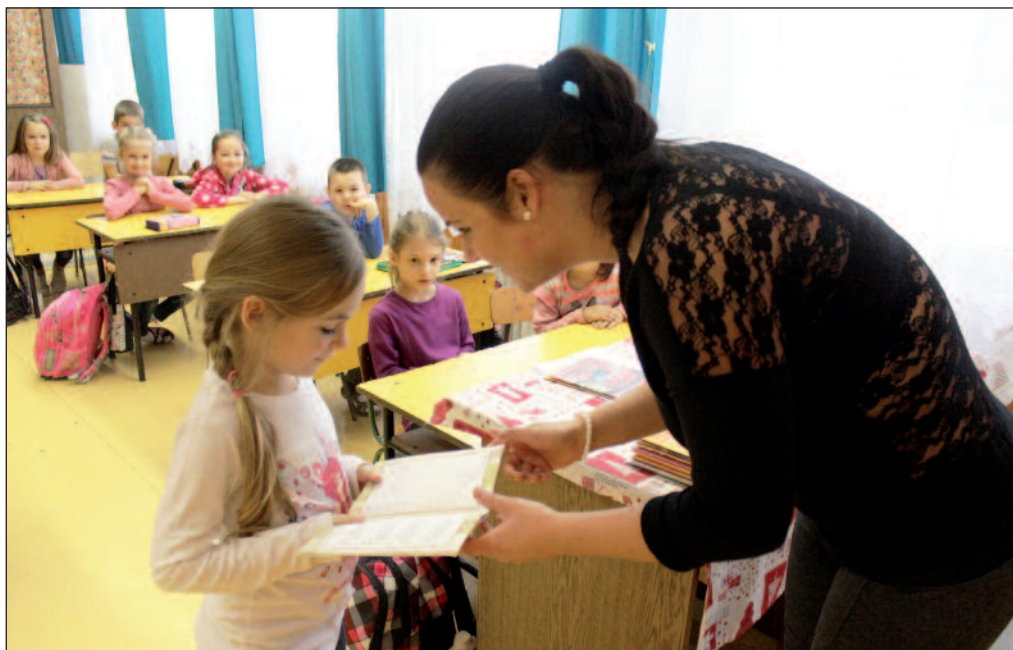
A Rákóczi iskolában 114 kitűnő és 81 jeles eredmény született.