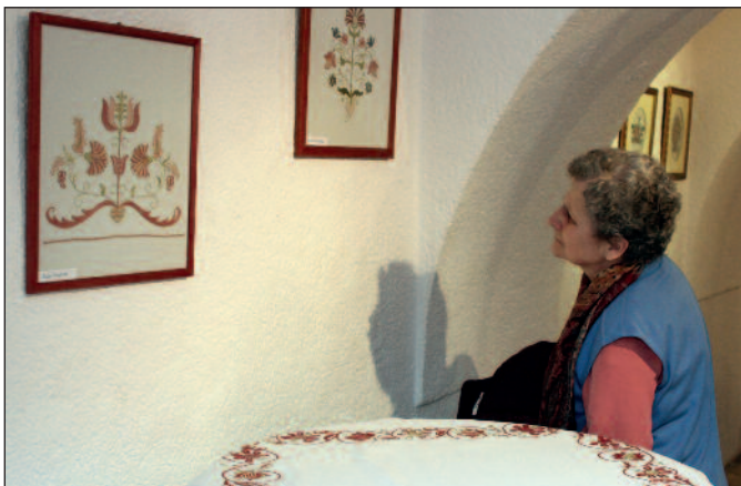
A hímző asszonyok legszebb munkái.