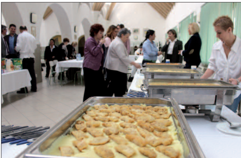
Egészséges és finom ételek készülnek a városi konyhán.