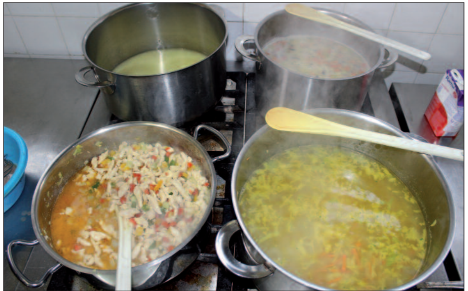
Izletes ételek csökkentett sótartalommal.

sem az étlaptervezés tekintetében – mondja a szakember. – Jól tudjuk, hogy a mai fiatalok közül sokan küzdenek többek között magas vérnyomással, cukorbetegséggel és kiugró koleszterin szinttel, ezért helyeslem ezt a rendelkezést, amely szabályozza, hogy milyen alapanyagokat használhatunk fel a főzés során. Eszerint kizárólag alacsony só- és zsírtartalmú termékeket alkalmazhatunk az ételek elkészítéséhez, emellett elvárás, hogy ne helyezünk sót az asztalra, hiszen ezzel is segítjük a gyermekeket hozzászokni az új ízekhez. A visszajelzések nagyrészt pozitívak, a legtöbben megértik vagy legalábbis elfogadják ezt a változtatást, de akadnak olyanok is, akik nemtetszésüknek adnak hangot, őket igyekszünk meggyőzni. Ezt a célt szolgálja ez a mai rendezvény is, segít ráhangolni a város intézményeinek vezetőit és dolgozóit erre a megoldásra, hogy ne csupán eltűnjék az új módszert, hanem ők maguk is kiálljanak az ügyért. Vendégeink között az iskolák, az óvodák és a szociális szféra képviselői mellett helyet foglaltak az ÁNTSZ munkatársai és a NÉBIH felügyelői is, akik megismerkedhetnek Szikora Péter séf és dieteti-