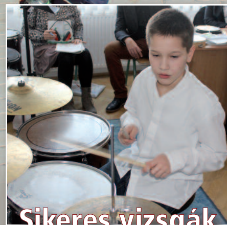
Sikeres vizsgák a művészeti iskolában