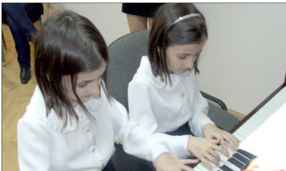
Kiválóan teljesítettek a zeneszpalánták.

Az intézményegység-vezető hozzátette, hogy az elkövetkező hónapok a versenyek és a fesztiválok időszaka lesz. A szeptembertől januárig tartó alapozás után hamarosan kezdődik az igazán komoly munka, hiszen felkészítik a gyerekeket a versenyekre, és szinte minden tanszakon erről szólnak majd a foglalkozások. Idén is vannak olyan növendékek, akiknél a továbbtanulásra összpontosítanak a pedagógusok, de továbbra is eleget tesznek a felkéréseknek, s részt vesznek a városi rendezvényeken, és a tanintézet saját programjain. R.P.