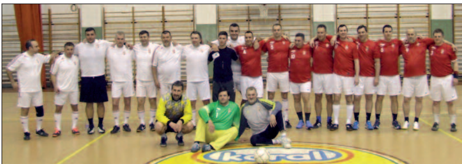
A barátságos labdarúgó mérkőzésen sportolók, közéleti személyiségek egyaránt részt vettek.

Városunk polgármestere köszöntötte elsőként az egybegyűlteket, s biztató szavakkal ösztönözte a gyermekeket a sportolásra, és hangsúlyozta a mindennapos testnevelés fontosságát az oktatásban. Első műsorszámként Deák Bárdos Mihály, volt négyszeres olimpiai bajnok irányításával birkózó bemutatót tekinthettek meg a jelenlévők a bekecsi II. Rákóczi Ferenc Általános Iskola növendékeinek részvételével. Nyiri Tibor a tíz évvel ezelőtti, tragikus autóbalesetben elhunyt, helyi születésű világklasszis ké-