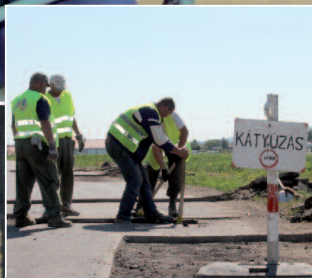
Közfoglalkoztatás 2015 (cikkünk a 6-7. oldalon)