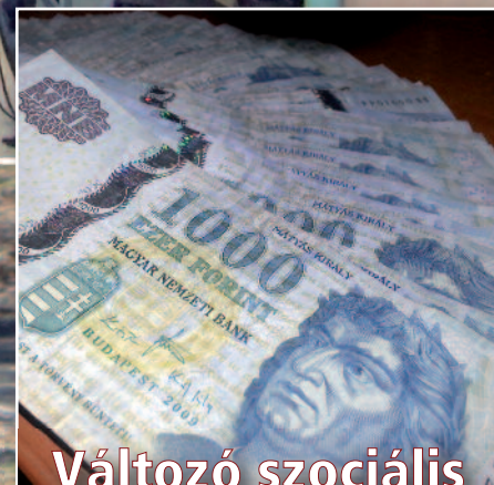
Változó szociális rendszer (cikkünk a 9. oldalon)