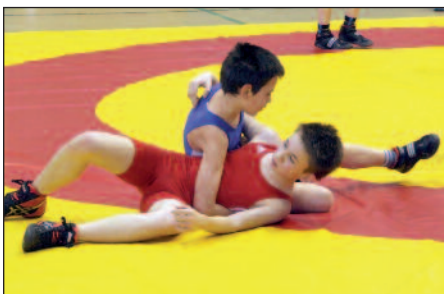
A birkózás egyre népszerűbb városunkban és környékén.