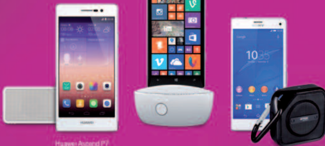
Huawei Ascend P7 Bluetooth hangszóróval

0 Ft KEZDŐRÉSZLETTEL, kamatmentes részletre, új előfizetéssel, a díjcsomagra vállalt 2 év hűségidővel, mobil előleggel.