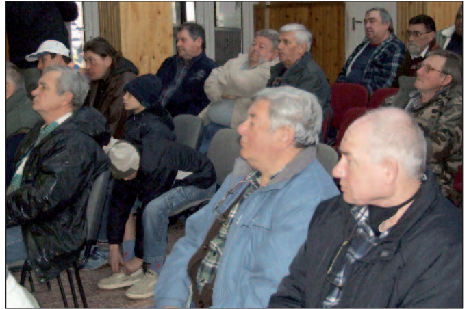
Horgászok a közgyűlésen.