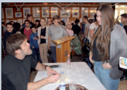
Szabó Győző dedikálta könyvét a fiataloknak.

A Társadalmi Megújulás Operatív Program keretében zajló, Innováció a Bocskaiiban című pályázat keretében rendezett drogprevenációs előadást a Bocskai István Katolikus Gimnázium. A tanintézmény tanulói és pedagógusai Szabó Győzöt látták vendégül február 13-án az iskola aulájában. Nem véletlenül esett a szervezők választása a népszerű színészre, hiszen ő maga több mint egy évtizedig élt a kábítószerek rabságában, de már 13 éve tiszta. Élményeiről 2012-ben könyvet jelentetett meg, amellyel erőt kíván adni azok számára, akik még nem látják a fényt az alagút végén. R.P.