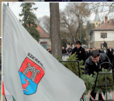
Nemzeti ünnepünk programja (a 3. oldalon)