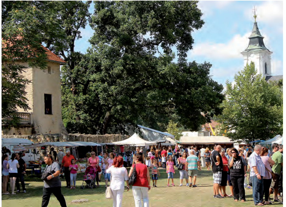
A Szerencsi Művelődési Központ legsikeresebb rendezvénye minden évben a csokoládéfesztivál.