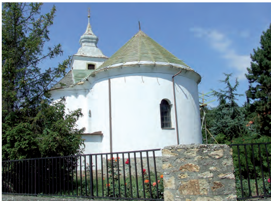
A görög katolikus templom felújítását is támogatja az önkormányzat.

Határozatot hoztak a képviselők annak érdekében, hogy az elkövetkező hét éves uniós pályázati ciklusban forrásigényt nyújthassanak be az alábbi elképzelések megvalósítására: település úthálózatnak fejlesztésére, amelyen belül kötelező elem lesz például a kerékpáros-barát közlekedés kialakítása. Ugyancsak forrást igényelnek a csapadékvíz-elvezető rendszer-, egészségügyi alapellátáshoz tartozó háziiorvosi és fogorvosi körzetek infrastrukturális fejlesztésére, a gyerekvédelmi központ és a városi konyha korszerűsítésére. Lesz helyi termékek piacra jutását támogató pályázat, továbbá többek között lehetőség nyílik zöldfelület fejlesztésre, piacrekonstrukcióra, ingatlanok felújítására, ipari park fejlesztésre is.