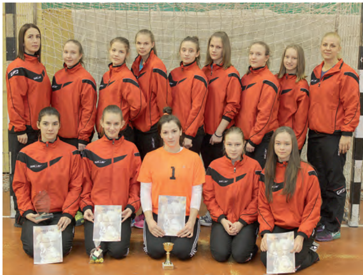
A győztes Kölcsey DSE junior csapata.