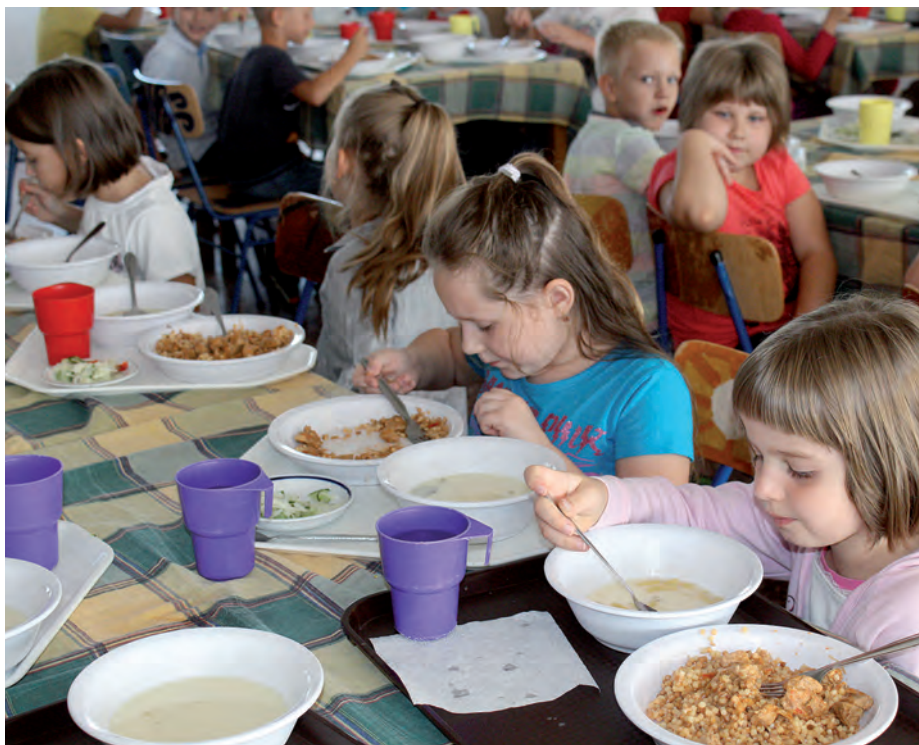
A városi konyha kiváló minőségben biztosítja az étkezést.

A város 200 ezer forinttal segíti a Gömöri Kéz- és művesek Társulását, a felvidéki szervezet egy szobor készítéséhez kér hozzájárulást. Dr. Barva Attila ismertette, hogy az elmúlt években lezárult Norvég Alap pályázatból a római katolikus és a református templomnál is történt fejlesztés, és kiharadt a görög katolikus templom. Koncz Ferenc polgármester közreműködésének köszönhetően tavaly két alkalommal kaptak kormányzati támogatást a rekonstrukcióhoz, de vannak olyan utómunkálatok, melyekhez az önkormányzat hárommillió forintos segítségét kéri. Koncz Ferenc hangsúlyozta, hogy az említett Norvég Alap arra kötelezi a helyhatóságot, hogy minden évben hétmillió forintot helyezzen el egy elkülönített bankszámlán és további munkát végezzen a korábbi pályázatban támogatott épületeken, azaz a református templomon, a Kisboldogasszony római katolikus templomon és a Rákóczi-várban. A görög katolikus egyházközségnek adandó egyszeri támogatás arra lesz elegendő, hogy a minisztérium által nyújtott forrást kiegészítve sikerüljön a tetőszerkezet, illetve a külső vakolat felújítását befejezni. Ugyancsak jóváhagyta a testület a Bocskai István Katolikus