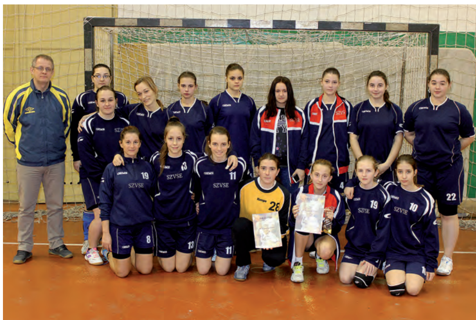
Fiatal kézilabdacsapatunk a harmadik helyet szerezte meg a tornán.