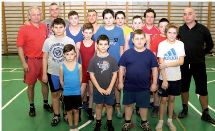
A Szerencs VSE birkózó szakosztálya minden kedden és csütörtökön 18 órától tartja edzéseit a Rákóczi Zsigmond Református Általános Iskola tornatermében.

Miért érdemes a fiataloknak ezt a sportot választaniuk? A vezetőedző erre a kérdésre rendkívül egyszerű választ ad: egy gyermek már 4-5 éves korában biztosan szeret az édesapjával birkózni, hiszen ez a mozgásforma ösztönösen