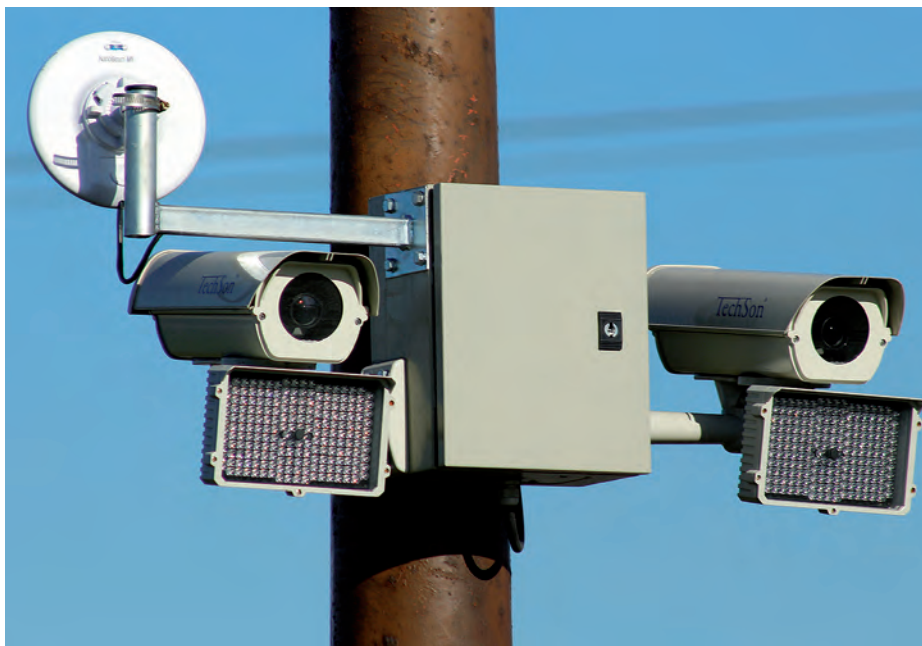
A városban összesen hat darab rendszámfelismerő kamerát helyeztek üzembe.

A fejlesztés nem csak a már említett új eszközök beszerzését és üzembe állítását érintette, ugyanis megtörtént az úgynevezett átviteli közeg, azaz a képrögzítő berendezések közötti kommunikációt biztosító mikrohullámú hálózat kiépítése is. Szerencs Város Önkormányzata a rendőrséggel együttműködve tekintette át az infrastruktúra egyes elemeit és a szakemberek javaslatai alapján bizonyos megfigyelési pontokat áthelyeztek a tapasztalatok alapján indokolt területekre. Az új rendszámfelismerő esz-