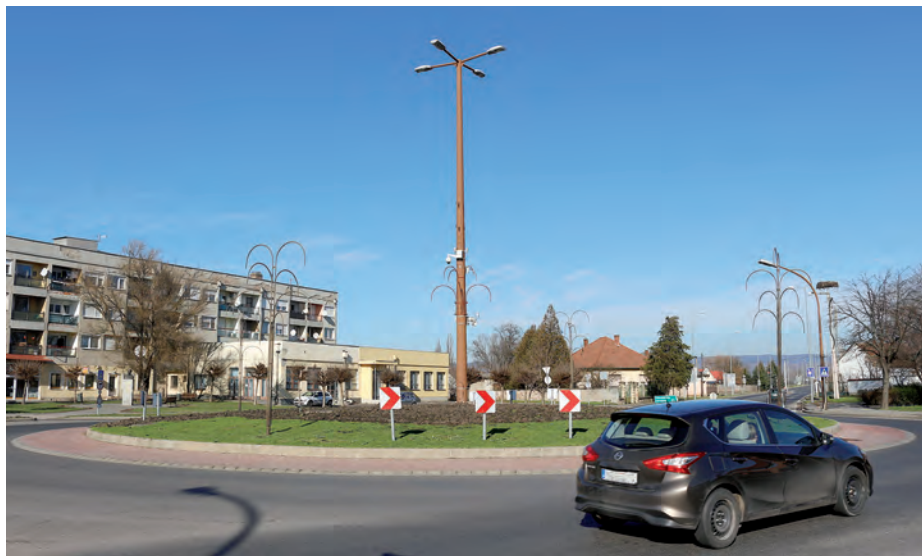
Szerencs minden irányból átjárható település.

A korábbi, felújított rendszernek köszönhetően szintén térfigyelők üzemelnek többek