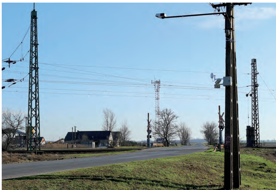
A Szegefű és Táncsics utak kereszteződésénél is kamerák figyelik a bűnözők által kedvelt menekülő útvonalat.