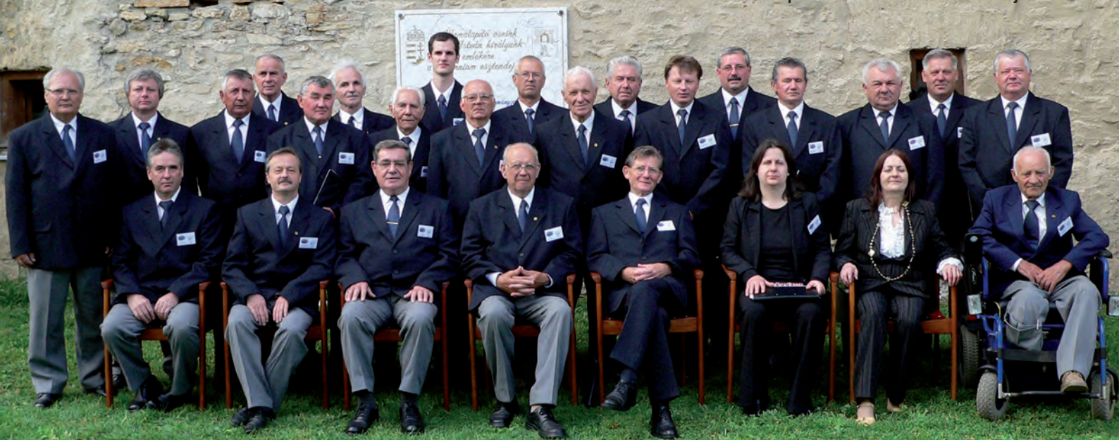
Archív fotó: a Szerencsi Férfikar 2008-ban ünnepelte fennállásának 85. évfordulóját.