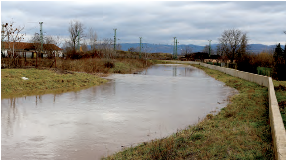
A 2013-ban átadott védműnek köszönhetően Szerencset nem veszélyeztette a magas vízállás.

Sokan emlékeznek arra, amikor a hat esztendővel ezelőtti árvíz idején a folyóvá duzzadt patak kiöntött, jelentős károkat okozva Szerencsen. A 2010-ben megalakult önkormányzat az