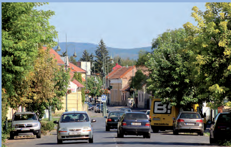
Az uniós pályázatok elősegíthetik a város hosszú távú fejlődését.

Többek között a csapadékvíz-elvezető rendszer kiépítésének további fejlesztése is szerepel az önkormányzat elkövetkező időszakban megvalósítandó tervei között. Az uniós pályázatok előkészítése már megkezdődött Szerencsen.