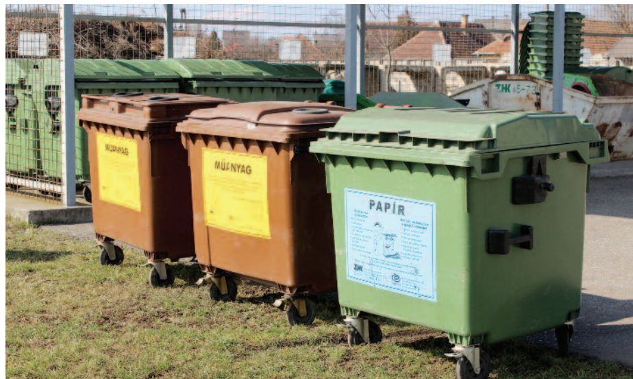
A szelektív hulladékgyűjtő szigetek a város több pontján is lakosság rendelkezésére állnak.

Amennyiben zavaró, egészségre ártalmas, terhelő légszennyezést érzékelünk, első lépésként próbáljuk meg a szennyezés okozóját megkeresni és személyesen megbeszélni a problémát. Ha a személyes megkeresés nem jár sikerrel és a káros tevékenység tovább folytatódik, bejelentést tehetünk a Kormányhivatal Járási Hivatalában, ahol panaszunkat kivizsgálják. További információ a www.fut-sokosankampany.hu honlapon olvasható.