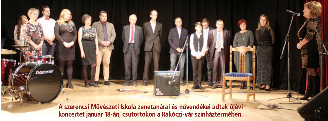
A szerencsi Művészeti Iskola zenetanárai és növendékei adtak újévi koncertet január 18-án, csütörtökön a Rákóczi-vár színháztermében.