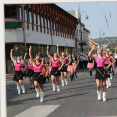
A XI. Országos Csokoládé Fesztivált felvonulás is kíséerte.