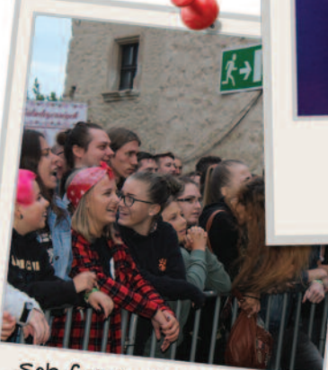
Sok fiatal volt kíváncsi az AWS koncertre is.

XI. Országos Csokoládé Fesztivál hangulatképek! 😊