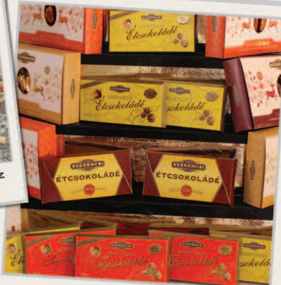
A látogatók sokfajta csokoládé különlegesség közül választhattak.