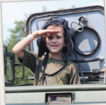
Nagy sikert arattak a gyerekek körében a katonai járművek.