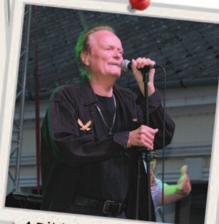
A Bikini először lépett fel a Csokoládé Fesztiválon.