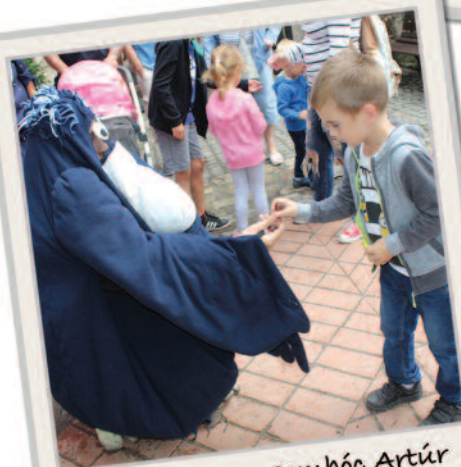
A fesztiválon Gombóc Artúr csokoládét osztogatott.