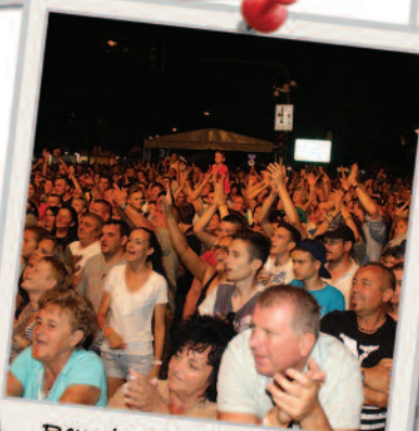
Remek volt a hangulat a Bikini koncerten.