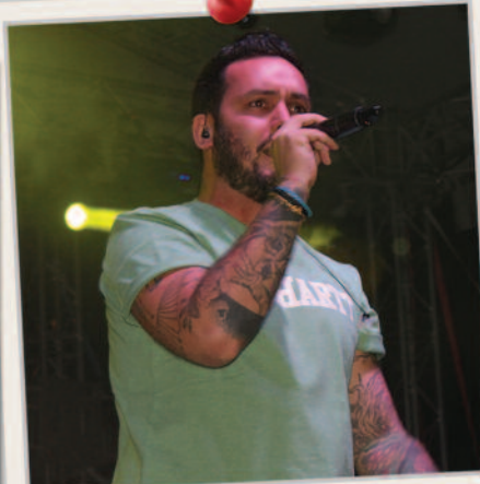
Rengeteg fiatal volt a Punnany Massif koncerten.