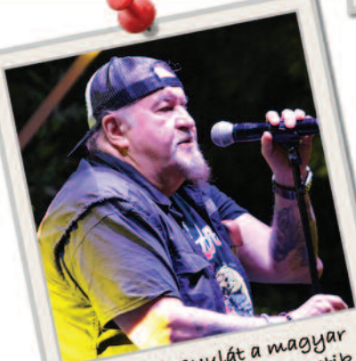
Deák Bill Gyulát a magyar blues királyaként emlegetik.