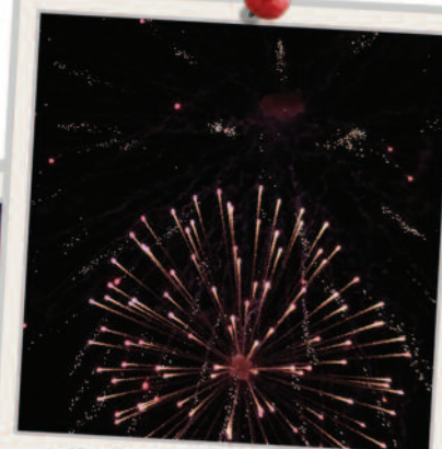
Látványos tűzijáték zárta a Csokoládé Fesztivált.