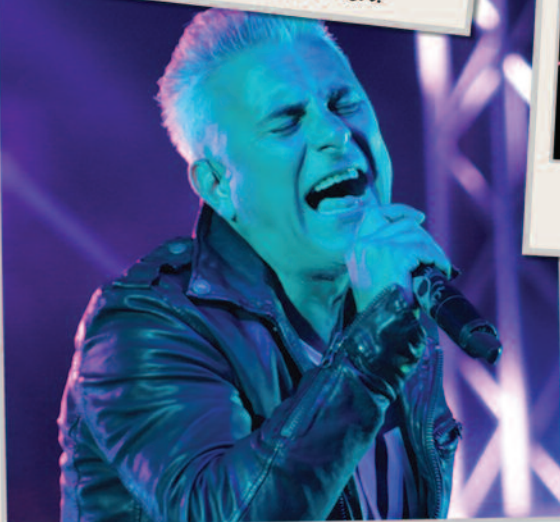
A fesztivál zárókoncertjét a Hooligans adta.