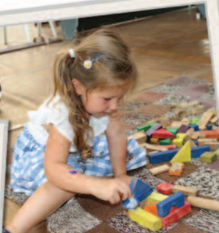
A sportosarnokban játékház várta a legkisebbeket.