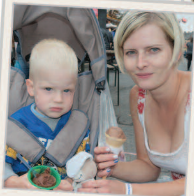
Fagyaltnál sem volt hiány.