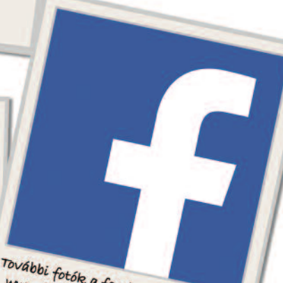
További fotók a facebook oldalunkon www.facebook.com/szerencsihitek