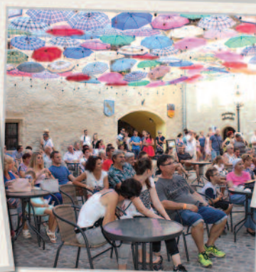
Hangulatos kialakítást kapott a Rákóczi-vár belső udvara.