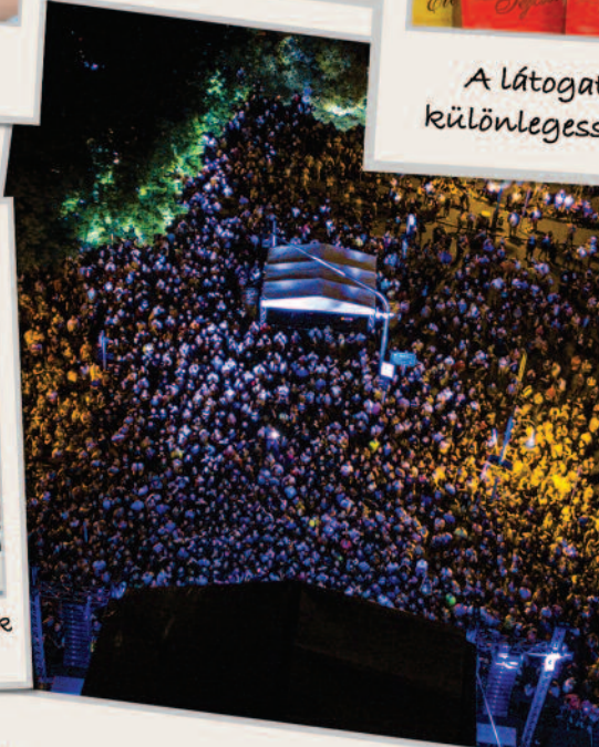
Megtelt a fesztivál színpad előtti tér.