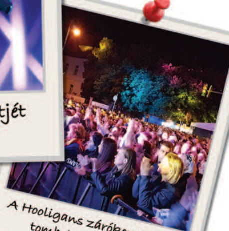
A Hooligans zárókoncertjén tombolt a közönség.

XI. Országos Csokoládé Fesztivál hangulatképek! 😊