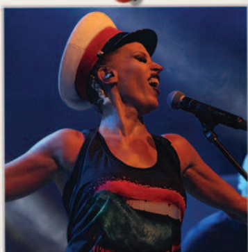
Az Anna and the Barbies feledhetetlen koncertet adott.