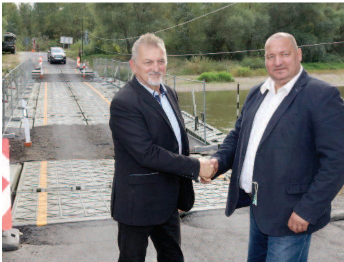
Koncz Ferenc országgyűlési képviselő és Németh Szilárd a Honvédelmi Minisztérium parlamenti államtitkára a pontonhíd átadásán.

Körömnél állítottak fel egy katonai pontonhidat, ami 46 település közel 15 ezer lakosának nyújt segítséget a közlekedésben, addig, amíg a Kesznyéteni Sajó-híd felújítási munkái be nem fejeződnek. Ez várhatóan november közepéig tart majd. Azoknak a szerencsieknek is biztos nagy segítséget nyújt, akik ebbe az irányba közlekednek, hiszen nem kell nagy kerülőt megtenniük.