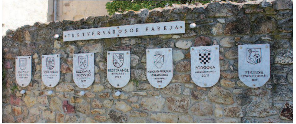
A Rákóczi-vár nyugati oldalán található testvérvárosok parkja

A horvát vendéglátók egyik fő célja az, hogy a szerencsi önkormányzat segítséget nyújtson ab-