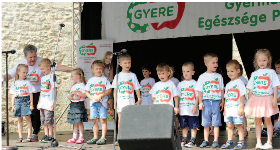
Gyerekek műsora az idei Gyere napon

– Nagyon sok visszajelzést kaptunk a szerencsiektől a gyerekek étkezési szokásainak pozitív változásával kapcsolatban. Örömmel jelentem be, hogy ebben a tanévben sem engedjük el a gyerekek kezét, és további egy éven át, a költségeket 100 százalékosan vállalva, az MDO SZ szakmai irányításával folytatjuk a programot,