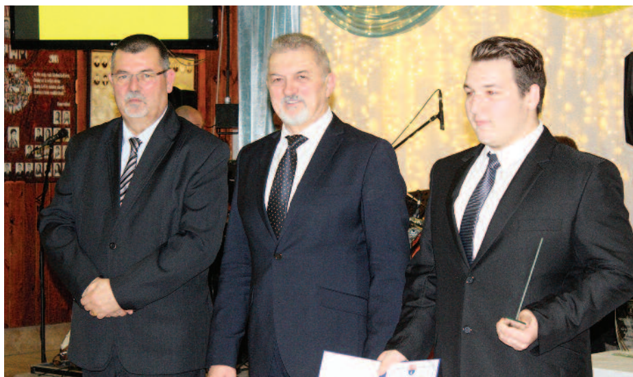
Idői sportbálon megkapta az Év sportolója kitüntetést.