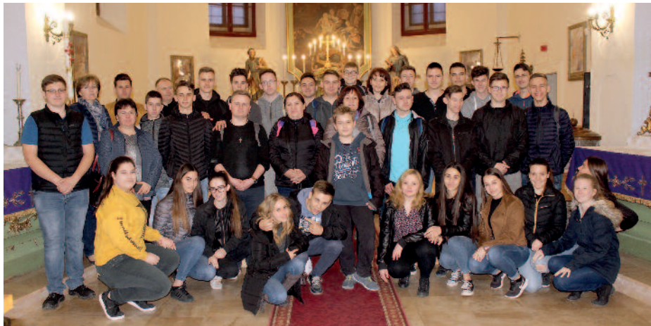
A gyulafehérvári diákok megnézték a szerencsi Római Katolikus Kisboldogasszony Templomot is