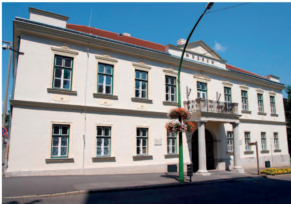
A sátoraljaújhelyi Kazinczy Ferenc Múzeum épülete

– Mindig is fontos volt számomra a család. Minden vasárnap hazajárok Szerencsre a szüleimhez, e mellett persze a két éves kislánnyal és a párommal töltöm a szabadidőmet. Közel áll hozzám a természet, szeretek horgászni és kertészkedni valamint a kutyámmal töltött idő is kikapcsol. A sport is aktív része volt az életemnek, ugyanis több évig futballoztam, többek között a szerencsi focicsapatnak is a tagja voltam. Életem legjobb döntése volt, hogy a régióban maradtam, hiszen azt gondolom, hogy szerencsés az, ha az ember ott tud kiteljesedni ahonnan származik, és a saját pátriájában találja meg a számítását.