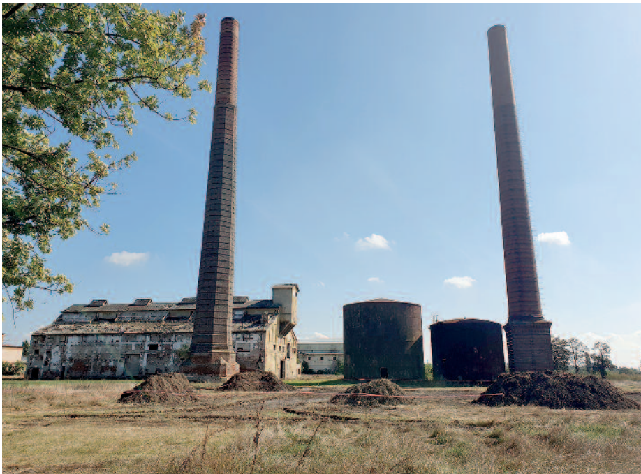
Ezen a területen valósul meg a kamionparkoló

Iparterület fejlesztése Szerencsen II. ütem című, TOP-1.1.1-16 számú pályázat keretében Szerencs Város Önkormányzata 500 000 000 Ft-ot nyert el. A Széchenyi 2020 program keretében megvalósuló pályázattal Szerencs Város Önkormányzatának célja a 3900 Szerencs, 2023/13 hrsz. alatti ingatlanon, (régi cukorgyári terület) – az iparterület fejlesztése, ezen belül: a volt kazánház felújítása, közraktár funkció kialakítása, a felújított közraktár biztonságtechnikai eszközökkel való felszerelése (riasztó rendszer, kamerák, a közraktárhoz érkező kamionok számára parkoló építése, optikai kábel behúzása az ipari telkekre valamint a kialakított ipari telkek között oldal kerítések építése. Szerencs Város Önkormányzata az 500 millió forint európai uniós támogatás segítségével el kívánja érni, hogy a tervezett infrastruktúra fejlesztés eredményeként a terület alkalmassá váljon és hozzájáruljon a vállalkozások betelepülését elősegítő feltételek megteremtéséhez. Az iparterület fejlesztésének legfőbb célja, hogy hozzájáruljon a vállalkozások és azon belül a munkavállalók helyzetének javulásához, az iparterületre betelepülő új vállalkozások új munkahelyet teremtsenek. A kivitelezésre vonatkozóan a közbeszerzési eljárások