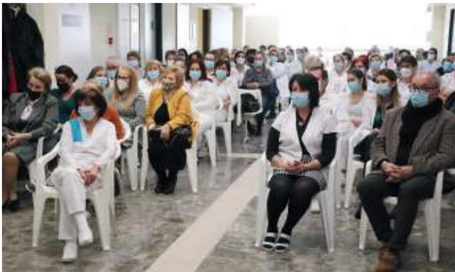
Az intézmény évértékelő gyűlésén jelentették be a jó hírt.

Ez történt meg 2021. decemberében, amikor a szerencsi rendelőintézetet értesítették a CT beszerzéséhez szükséges 201 millió forint biztosításáról. A CT-re azonban még várni kell, ugyanis a beszerzési idő általában 12 hónapot vesz igénybe, azonban az intézet szándéka szerint már a nyár végére megérkezhet, így a járásban élő közel 50 ezer ember mihamarabb hozzájuthat a szolgáltatáshoz. Nyiri Tibor, Szerencs város polgármestere hangsúlyozta, hogy az egészségügyi szolgáltatások fejlesztése és a szakrendelések számának a bővítése az önkormányzatnál az egyik legfontosabb célkitűzés, hogy ezekért a lakosságnak minél kevesebbet kellejen utazni. A megyében található, a szerencsihez hasonló járóbeteg intézmények közül egyik sem rendelkezik ilyen berendezéssel – legközelebb a miskolci és a sátoraljai helyi kór-