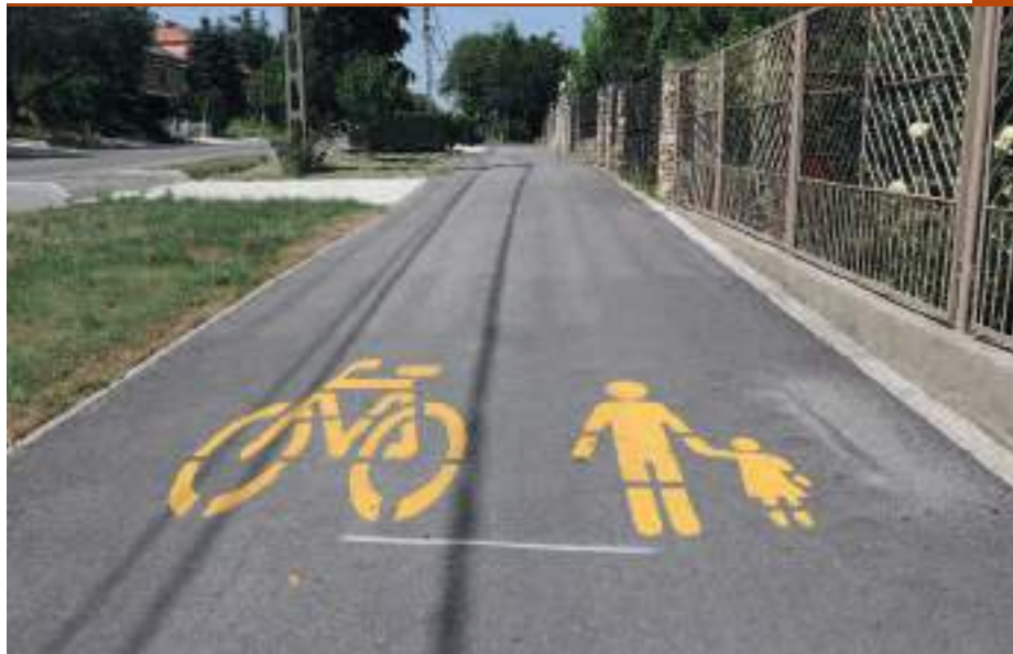
A kerékpárút mellett a jövőben több kilométernyi külterületi dűlőt is épül.