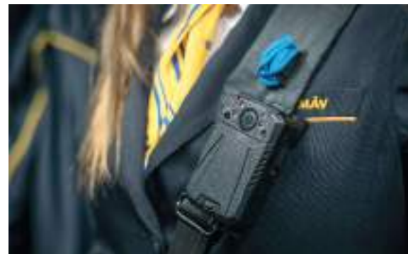
A testkamerák több védelmet nyújtanak a jegyvizsgálóknak.

készítése volt engedélyezett a testkamerákkal. A módosított törvény lehetővé teszi a testkamerák felvételeinek hatékonyabb használatát többek között a bizonyítási eljárások során, ennek révén pedig tovább csökkenhet a közfeladatot ellátó személyek elleni sértő vagy erőszakos cselekmények száma. Az eddigi intézkedéseknek köszönhetően csökkenő tendenciát mutat a súlyos konfliktusok száma a vonatokon. Tavaly a 2020-ban tapasztalt 65-höz képest 59 atrocitás történt országosan. Ezt megelőzően, 2019-ben 70 esetben ért támadás jegyvizsgálót szolgálatteljesítés közben. Az elkövetők több mint fele menetjegy nélkül, érvénytelen vagy átruházott jeggyel kívánt utazni vagy ittas volt. A tapasztalatok szerint a jegyvizsgálók elleni támadások megelőzésében nagyon hatékony eszköz a testkamera is, tavaly 7826 jegyvizsgáló összesen 15 380 alkalommal, 70 800 vonaton