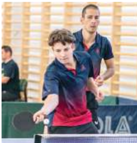
A sportolók célul tűzték ki a feljebbjutást.