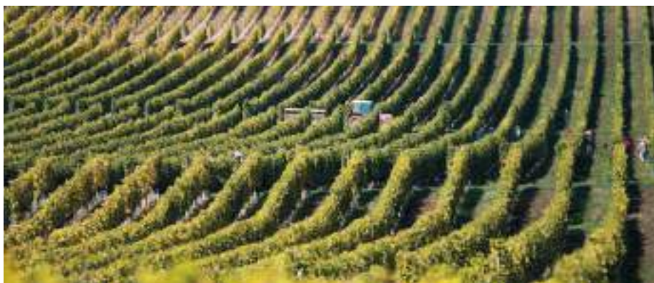
Várják a környezeti vizsgálatra vonatkozó véleményeket.

Az elkövetkező, 2021-2027 közötti programozási időszak területi operatív programjának a Versenyképes Magyarország Operatív Programnak (VMOP) (a korábbi Terület- és Településfejlesztési Operatív Programhoz (TOP) hasonlóan) egyik célja, hogy megfelelő alapot biztosítson a területi alapú fejlesztések tervezéséhez és megvalósításához a térségi egyenlőtlenségek további mérséklése érdekében. Ezért a különböző területi szinteken továbbra is szükség van a sajátos térségi adottságokra meghatározott és indokolt fejlesztésekre, azok szükségességének meghatározására, a térség fejlődésére történő hatásaik bemutatására. A VMOP kiemelt figyelmet fordít a kiemelt térségek, így Tokaj-Hegyalja számára is felzárkózásának támogatásában is. A 2021. októberében véglegesített Tokaj Borvidék Fejlesztési Konceptió célja a Tokaji borvidék stratégiai fejlesztési irányainak a meghatározása, a térség értékeit középpontba állító jövőkép alapján, a területfejlesztés célkitűzéseinek és alapelveinek a kijelölése, azok elérését