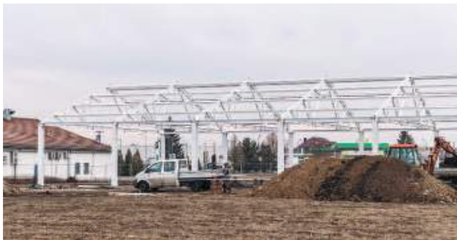
Körülbelül 25 embernek biztosít majd megélhetést az új áruháza.

Nagy örömünkre egy korábbi adósságot is tudtunk orvosolni azzal, hogy a Keleti Ipari Parkot már kerékpárral is meg lehet közelíteni, sőt a Szerencs táblánál korábban véget érő kerékpárutat tovább építettük egészen a város közigazgatási határáig. Ez így önmagában talán értelmetlennek látszik, de ha azt mondom, hogy tervezzük a jövőben a Keleti Ipari Park területén a volt BHD-nál rendezni a földterületnek a jogi helyzetét már azonnal értelmet nyer. Szeretnénk, hogy ha azon a területen olyan vállalkozás, tevékenység telepedne meg ami harmonizál a környezettel, a természettel, a világörökséggel. Ez a terület a városnak a „keleti kapuja”, tehát egy frekvenciált hely és nem mindegy, hogy az ideérkező turisták, befektetők és átutazók milyen benyomással lépnek be a városba még akkor is, ha csak a 37-es számú főúton mennek keresztül, és egyáltalán nem mindegy,