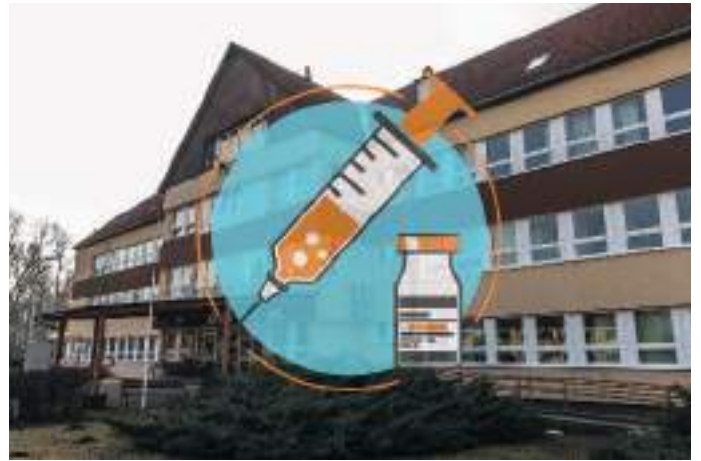
Az ESZEI oltópontként is működik.

ciónapokat. Ezúttal is előzetes időpontfoglalás nélkül és helyszíni regisztrációval lehetett felvenni az oltást. Az 5-11 éves gyermekeknek továbbra is csak előzetes időpontfoglalással volt lehetséges felvenni a vakcinát a kórházi oltópontokon vagy a házi gyermekorvosoknál. A kórházakban és a járásközponti szakrendelőkből minden még rendelkezésre álló vakcina elérhető volt: Pfizer, Sinopharm, Moderna, Janssen, AstraZeneca. A várakozást jelentősen gyorsította, ha magukkal vitték kinyomtatva, kitöltve és aláírva a hozzájáruló nyilatkozatot, amely letölthető a koronavirus.gov.hu oldalról. Lapzártánkig a legfrissebb információ szerint február első két hetében is lesznek akciónapok csütörtöktől szombatiig.