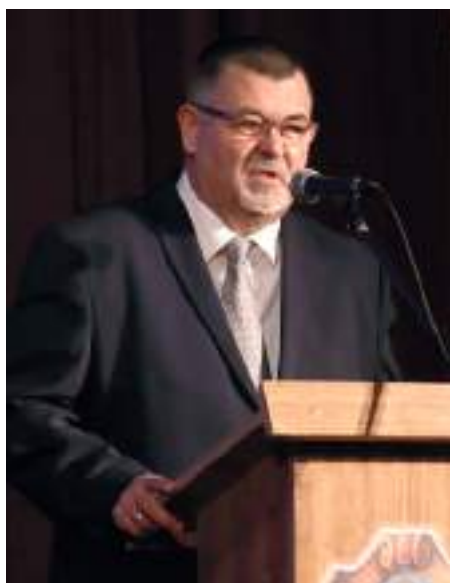
Nyiri Tibor Szerencs polgármestere kitarast és jó évet kívánt a helyi vállalkozások számára.

Egy év kihagyás után a hagyományoknak megfelelően január 14-én ismét újévköszöntő fogadásra hívta a helyi vállalkozókat, az intézmények vezetőit, a partneri kapcsolatban lévő szervezetek képviselői Szerencs Város Önkor-