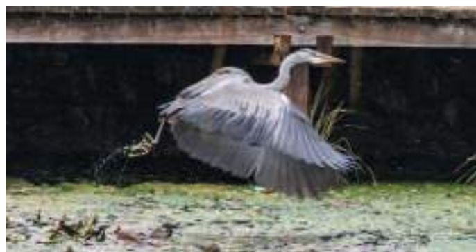
Szerencsen már visszatérő madárnak számít a szürke gém.

A szürke gém egy költöző madár, az európai állomány nagyobb része Afrikában tölti a telet, néhányuk azonban mégis úgy dönt, hogy Magyarországon marad a leghidegebb hónapokban is. A hazai állományt 2500-3500 fészkelő párba becsülik a szakemberek, elsősorban a Tisza-tó és a Felső-Tisza vidékén élnek. Az Északi-középhegységben a legkisebb az állomány sűrűsége, itt ritkaságnak számít. Alapvetően társas madárnak számít, ennek ellenére mégis egyedül vadászik. Halakkal, kételtűekkel, csigákkal, hüllőkkel, kisemlősökkel és rákokkal táplálkozik. Vadászati stratégiáját gyorsaságára és a kivárára építi: általában mozdulatlanul áll a sekélyesben, várva az áldozatot, majd hegyes csőrével lecsap. Olykor úsznia is kell, ami nem okoz neki gondot. Magyarországon védett madárnak számít, eszmei értéke: 50.000 forint.