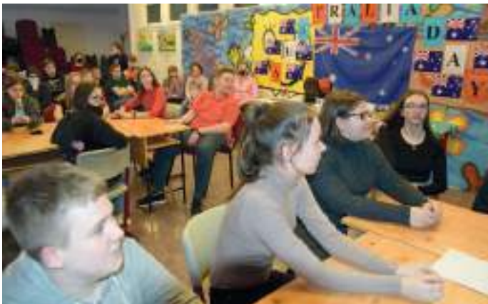
A diákok még kiállítást is tartottak Ausztráliából származó tárgyakkal.

A Rákóczi Zsigmond Református Két Tanítási Nyelvű Általános Iskola két tanítási nyelvi képzésében részt vevő tanulóknak az egyik fontos tantárgya a civilizáció, aminek keretében a diákjaink megismerkednek az angolszász országok kultúrájával, mindennapi életével, hagyományaival, szokásaival is. Ez az óra arra is lehetőséget nyújt, hogy évről-évre a különböző évfoly-