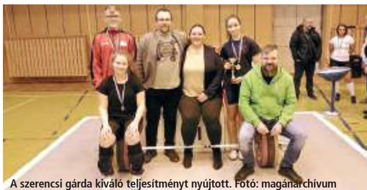
A szerencsi gárda kiváló teljesítményt nyújtott.