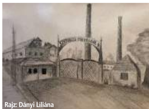
Rajz: Dányi Liliána

A Zempléni Múzeum és a Turisztikai Központ is csatlakozott a tavalyi esztendőben a Múzeumok Őszi Fesztiválja alkalmából meghirdetett rajz- és fotópályázathoz. A cél az volt, hogy a