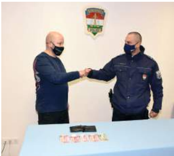
A szerencsi rendőrök gyorsan megoldották az ügyet.

Lopás vétség elkövetésének megalapozott gyanúja miatt folytat büntetőeljárást a Szerencsi Rendőrkapitányság egy 45 éves helyi asszonnyal szemben. A gyanúsított 2022. február 5-én 11 óra után egy szerencsi üzletben egy bevásárlókosárban felejtett pénztárcából több tízezer forint készpénzt tulajdonított el. A lopást követően a nő a tárcát az üzletben elrejtette, és a pénzzel a vásárlást követően távozott a helyszínről. A járőrök sikeres adatgyűjtésének eredményeként az asszonyt két órán belül a lakásáról állították elő a rendőrkapitányságra, ahol a nyomozók gyanúsítottként hallgatták ki. A rendőrök a pénztárcát, és a pénzt is lefoglalták, majd később átadták jogos tulajdonosának.