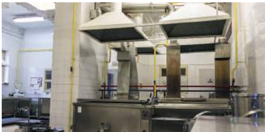
Az önkormányzat az üzemeltetésért cserébe több garanciát is kér.

Elvi döntés született a február 10-ei képviselő-testületi ülésen, hogy a Bolyai János Katolikus Általános iskolában található főzőkonyhának üzemeltetési jogát átadják az üzemeltető részére. Az önkormányzat jelenleg három főzőkonyhával rendelkezik: egy található az említett iskolában, egy a Tiszánineni Református Egyházkerület (TIREK) Szerencsi Idősek Otthonában és egy a Rákóczi-várban. Nyiri Tibor Szerencs város polgármestere arról tájékoztatta a képviselő