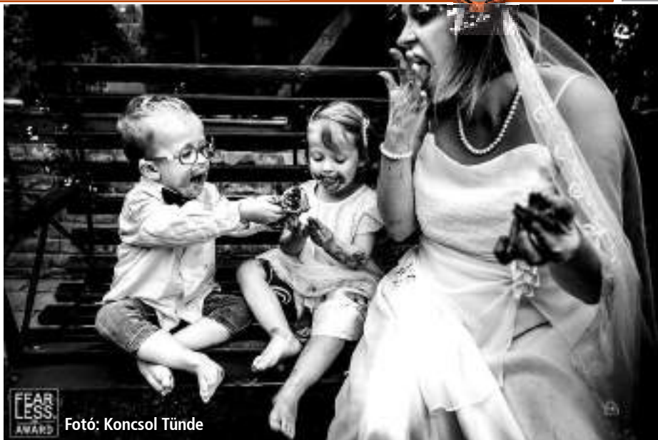
FEAR LESS AWARD

– Bőven tízezer felett van ez a szám. Ezekből később kiválogatom a legjobban sikerülteket és itt ismételtelen előkerül az a bizonyos bizalmi faktor, hiszen nem adom át az összes fotót nekik. A rossz fotókra nincs szükségük, de hogy melyik a jó fotó az az én feladatomból kiválasztani. Végül összerakok körülbelül ezer fotót, de ezek olyanok, amik „megszólalnak”, érzelmekkel teli, komplex pillanatok. Nincs ismételtetés, nincs ugyanaz a kép. Mind más és mind értékes!