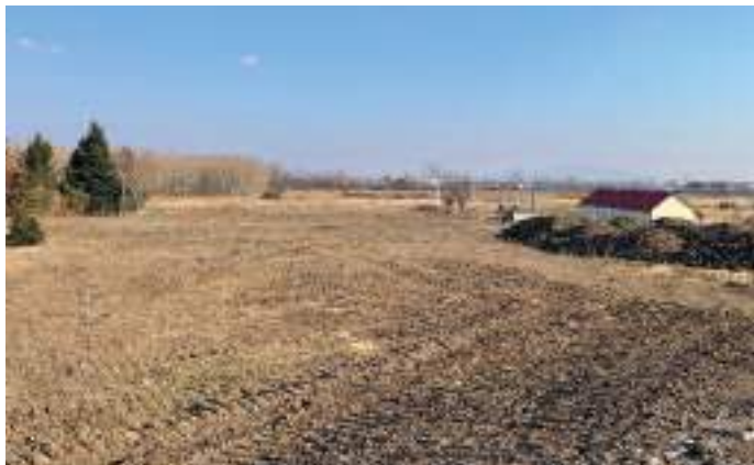
A fákat a Szabadság utca melletti földterületen fogják elültetni.

A képviselő-testület a Szeretlek Szerencs civil kezdeményezés javaslatára 2021. októberében tartott munkaterv szerinti ülésen döntött a városban a „Babafa” program elindításáról. A közösen elültetett fák erősítik a családok Szerencsrel való kapcsolatát, szépítik a városképet és segítik a gyermekek természethez, valamint a környezetvédelemhez való kötődésének kialakulását. Hasonló faültetési programot egyre több önkormányzat szervez, és a visszajelzések alapján rendkívül népszerű országsszerte a kezdeményezés. A programhoz való csatlakozás önkéntes alapú. Azok a családok, akik részt kívánnak venni a programban a jelentkezési lap – az önkormányzat hivatali recepcióján kérhető – kitöltése után meghívót kapnak a faültetési ceremóniára, ahol átvehetik a babafát, névtábláját és elültetheti az őshonos növényt. Szerencsen az önkormányzat a Szabadság utca melletti területet jelölte ki erre a célra, ahol a tereprendezés már elkezdte a városgazda.