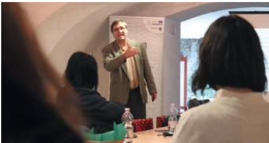
Az eseményen sok hasznos információval gazdagodtak a helyi vállalkozók.

Egy vállalkozás indítása esetén a siker kulcsa a háttérben részletesen kidolgozott stratégia, amelyet úgy hívunk, üzleti terv. A BORA 94 Borsod-Abaúj-Zemplén Megyei Fejlesztési Ügynökség február 2-án interaktív tanácsadásra várta a helyi vállalkozókat a Rákóczi-várban. A megjelentek a vállalkozásuk fejlesztéséhez kaptak hasznos információkat szakemberektől,