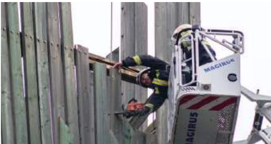
A szerencsi hivatásos tűzoltók levágták az életveszélyes elemeket.

A januári viharos erősségű időjárás megtépázta Szerencsen a Világörökségi Kapuzat északi tornyának a faelemeit, ami életveszélyessé vált. A 2007-ben átadott épületen szemmel láthatók voltak az időjárás okozta károk, most