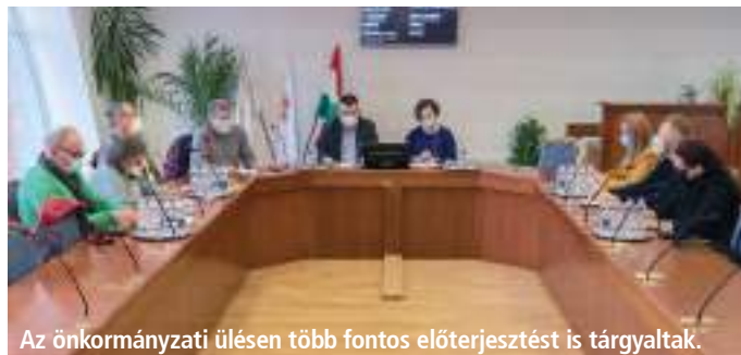
Az önkormányzati ülésen több fontos előterjesztést is tárgyaltak.

de több garanciát is kér az üzemeltetési jogért cserébe, amiről részletesen a 7. oldalon írtunk. Az ülésen szóba került a Babafa program helyszínének a kijelölése is. Elhangzott, hogy az erre alkalmas önkormányzati tulajdonban lévő földterület a Szabadság utca mellett található, ahol a Szerencsi Városgazda Non-profit Kft. már megkezdte a tereprendezést. A „babafák” ültetésével az önkormányzat a városunk közösségébe érkező gyermekek születésének állít maradandó és velük együtt növekvő emléket. (Részletek a 7. oldalon olvashatók.) A február 17-ei ülésen tárgyaltak a képviselők az üvegyapótygár területén kitermelt föld tárolásához kapcsolatos előterjesztésről. Az üvegyapótygár kivitelezője a PIMCO Kft. kérelemmel fordult az önkormányzathoz, hogy a gyár építése során kitermelt humuszt ideiglenesen a szomszédos önkormányzati tulajdonú területen tárolhassa. A kitermelt termőföldet a fejlesztéssel párhuzamosan visszatölti majd az építési területre. A képviselők felhatalmazták a polgármestert, hogy az ellentételezésről és a garanciákról tárgyaljon a befektetővel, majd a megállapodás-tervezetét terjessze az önkormányzat elé.