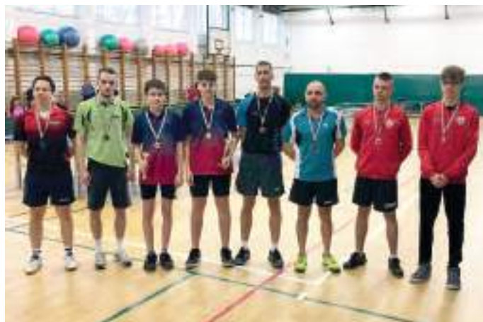
A szerencsi csapat résztvevői.