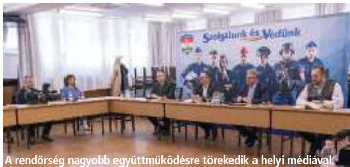
A rendőrség nagyobb együttműködésre törekedik a helyi médiával.