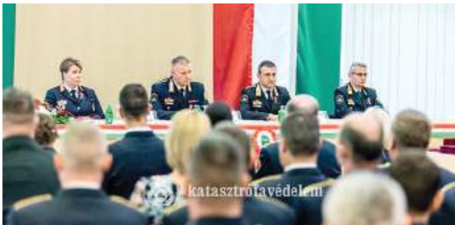
A szerencsi tűzoltók az ország legjobbjai közé tartoznak.

Az 1848–49-es forradalom és szabadságharc tiszteletére rendezett megemlékezést a katasztrófavédelem március 11-én Budapesten. Az ünnepség alkalmat adott arra is, hogy a jelenkor legjobbjai is elismerésben részesüljenek. A BM Országos Katasztrófavédelmi Főigazgatóság vezetői, a meghívott vendégek és az elismerésben részesülők a Himnusz elhangzása után Erdélyi Krisztián tűzoltó dandártábornok, műveleti főigazgató-helyettes köszöntőjét hallgatták meg. A szónok felidézte azokat a szimbólumokat, érzéseket, amelyeket az emberek általában a március tizenötödiki ünnephez társítanak. Beszélt arról, hogy százhetvennégy éve azon a napon a magyarság számára fontos történelmi események kezdődtek, amelyekkel a magyar nemzet jelentős lépést tett a függetlenség elnyerése, a feudális társadalmi rend felszámolása felé. A főigazgató-helyettes azzal zárta köszöntőjét, hogy a vértanúkra, hősökre emlékezve most van itt az ideje, hogy a magyarok fejet hajtsanak mindazok