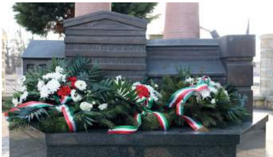
Koszorú az emlékművön.

Szerencs Város Önkormányzata megemlékezést tartott március 10-én a Szerencsi Cukorgyár bezárásának tizennegyedik évfordulóján a Cukorgyári Emlékparkban. A Mátra Cukor Zrt. német tulajdonosa 2008. március 10-én jelentette be, hogy megszünteti a szerencsi cukorgyártást, ami akkor óriási törést jelentett a városnak. A gyár ugyanis Szerencs életének, fejlődésének meghatározó ipari létesítménye és egyben jelképe is volt. A szerencsi és környékbeli emberek több generációja kereste itt a napi betevőjét a működés több mint száz éve alatt. A lebontás