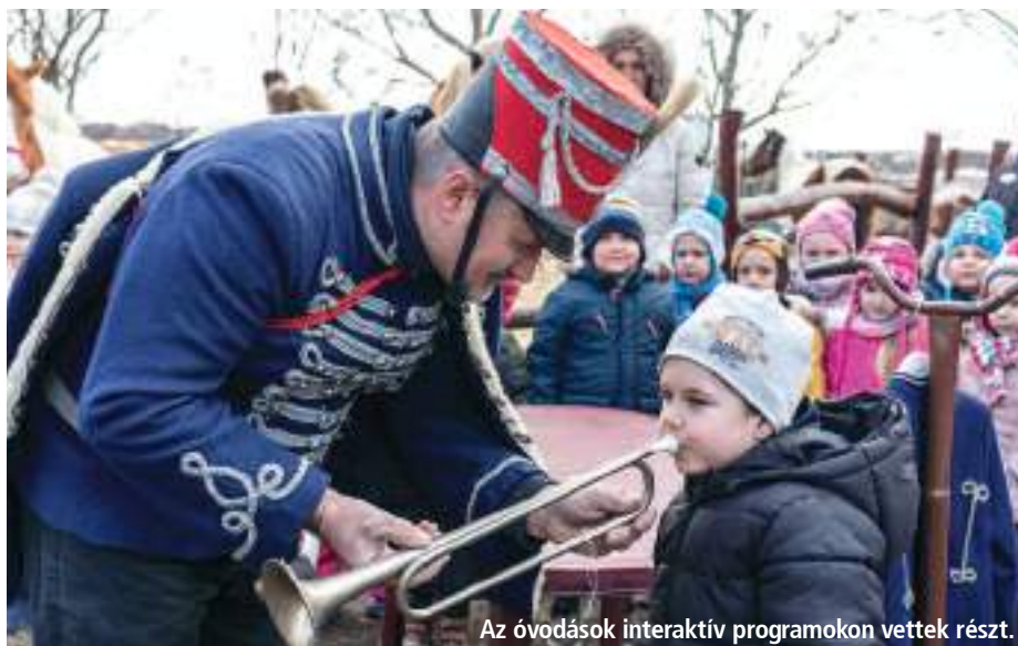
Az óvodások interaktív programokon vettek részt.