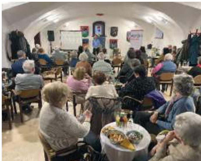
Az előadásra teljesen megtelt a Rákóczi-vár lovagterme.