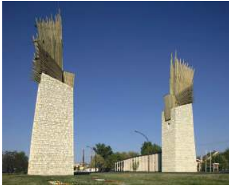
A Világörökségi Kapuzat Szerencs jelképévé vált.