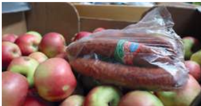
Közel 1 millió forint értékű adomány gyűlt össze.

Éppen három hete annak, hogy Oroszország megtámadta Ukrajánát, ami a szomszédos államban a háború kitérését jelentette. Azóta emberek százai menekülnek a lövedékek-, bombák-, rakéták életüket követelő és anyagi javakat pusztító támadásai elől, kettészakítva családokat, hátrahagyva otthonukat.