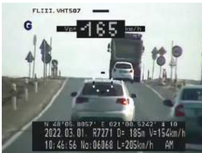
A vétkes sofőr mindenkit veszélybe sodort.