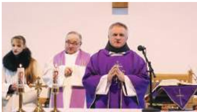
Böjte Csaba atya arra kérte a világ vezetőit, hogy legyen békeség.

Közös imádságra várta a hívőket Böjte Csaba, ferences rendi szerzetes március 9-én a Szerencsi Munkás Szent József templomba. Isten háza megtelt hívőkkel, akik együtt imádkoztak azért, hogy mihamarabb érjen véget az orosz-ukrán háború. Az orosz invázió miatt már több millióan