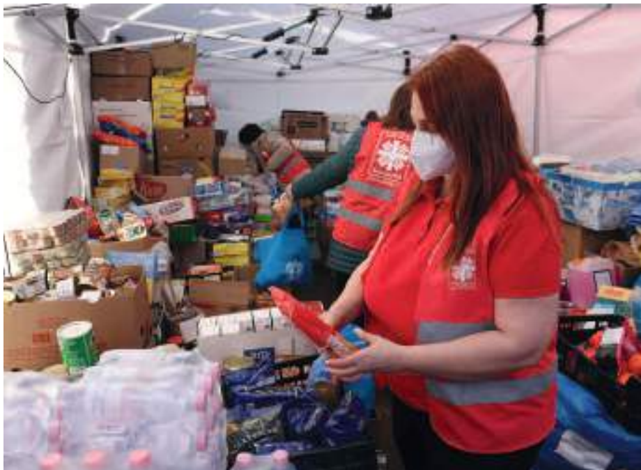
Barabáson nagy örömmel fogadták a szerencsi adományokat.

Megállás nélkül érkeznek az adományokkal megrakott járművek a magyar-ukrán határ melletti településekre. Erre nagy szükség van mivel Ukrajna keleti országrésze az elmúlt időszakban háborús övezetté vált, miután Oroszország február 24-én inváziót indított. A teljes világot megdöbbentette az orosz támadás ténye, annak ellenére is, hogy már 2021 óta katonai jelenlétének erőteljes növelésébe kezdett a kelet-ukrajnai határ orosz oldalán. Sokan az utolsó pillanatig hittek a viszály békés rendezésében. A segélyszervezetek szerint hatalmas hiányokhoz és migrációs mozgásokhoz vezethet az orosz támadás nyomán kialakult ukrajnai humanitárius válság, amelynek következményeit még akár évekig is érezhetik a szomszédos országok.