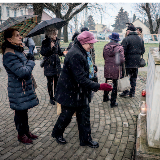
A rossz idő ellenére is sokan lerótták a kegyeletüket.

Szerencs Város Német Nemzetiségi Önkormányzatának szervezésében február 3-án a vasútállomásnál található emlékműnél helyeztek el mécseseket, és tették tiszteletüket a megjelentek azok előtt, akiket 78 évvel ezelőtt hurcoltak el kényszermunkára a Szovjetunióba. Szerencs Város Önkormányzatának nevében Nyiri Tibor polgármester gyújtott mécsset.