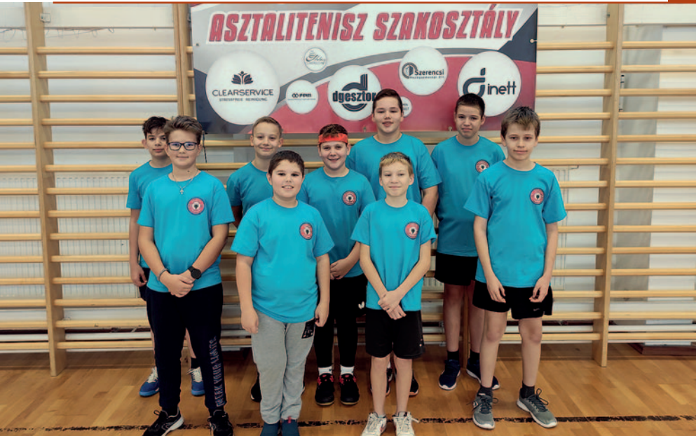
A szakosztály legfiatalabb játékosai.

2017. június 14-én a megyei asztalitenisz szövetségtől – melynek nyolc évig volt a tagja B.-A.-Z. Megye Asztalitenisz Sportjáért kitüntetését kapott.