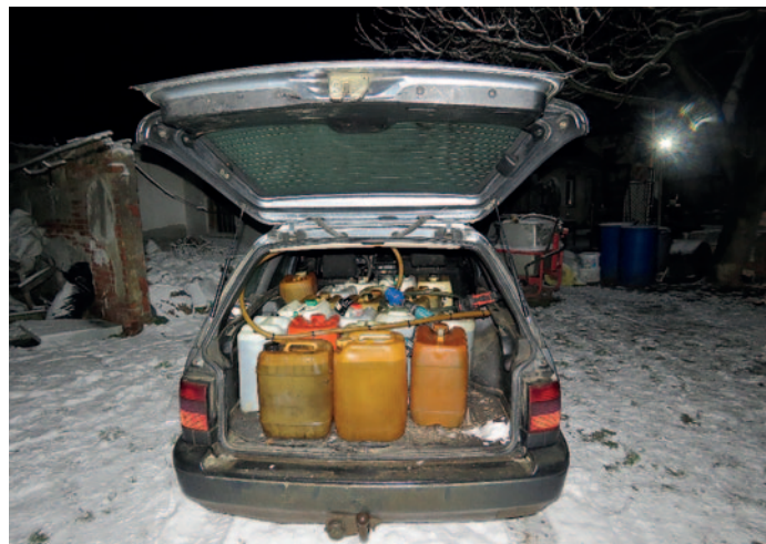
Az autó sofőrje menekülés közben kerítésnek ütközött.

A rendőrök miután ellenőrzés alá vonták a sofőrt és utasát, illetve átvizsgálták a járművet, kiderült, hogy a csomagtartóban tárolt mintegy 400 liter üzemanyagot nem sokkal korábban lopták el egy közeli telephelyről. A Szerencsi Rendőrkapitányság Tállyai Rendőrőrsé lopás büntetett elkövetésének megalapozott gyanúja miatt folytat eljárás a 34 éves sofőrrel, és 29 éves társával szemben. A rendőrség az autót vezető férfival szemben – a büntetőeljárás megindítása mellett – anyagai káros közúti közlekedési baleset okozása miatt, helyszínbírságot is kiszabott. A rendőrség a lefoglalt üzemanyagot az eljárás eredményeként visszaadta jogos tulajdonosának.