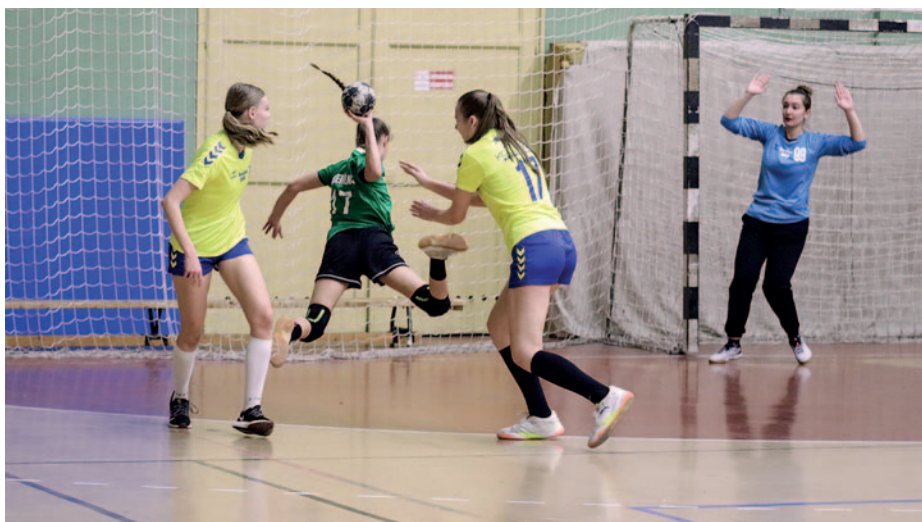
Bravúrosan játszottak a szerencsi (zöld színű mezben) lányok.

A Szerencs VSE női kézilabdázói 39-25-re legyőzték a Szalézi DSE csapatát. Konyári Vivien 12 gólt, Konyári Kinga 6, Galyas Gréta 5 találatot szerzett.