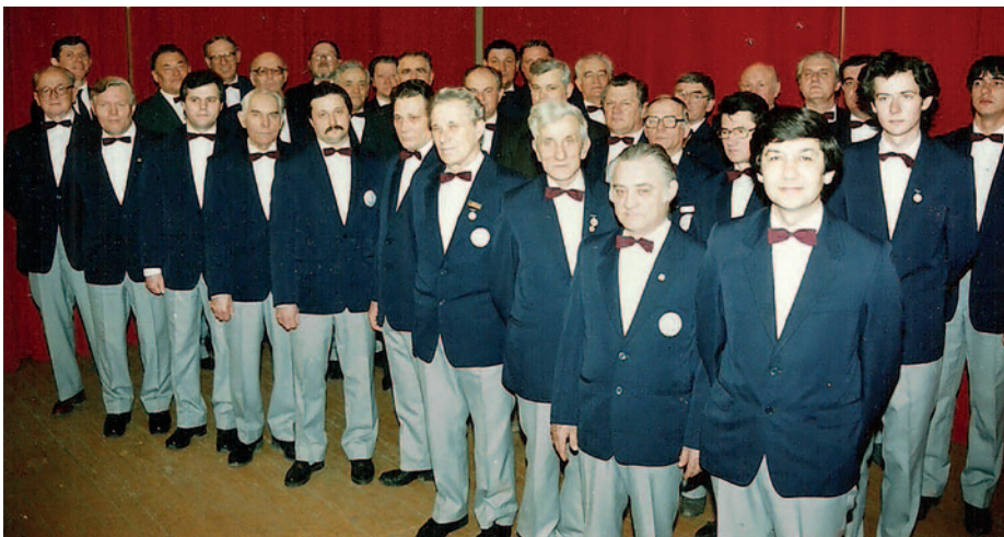
A tagok büszkén viselték az egyenruhát.

Bessenyei György Tanárképző Főiskola Ének Tanárszékének tanára vette át munkáját. A cukorgyár vezetősége a jó gazda gondoskodó szeretetével, erkölcsi és anyagi támogatásával örködött a hagyományt híven őrző férfikar közösségén fennállásának teljes idejében. 100 év után elmondható, hogy a háború és a politika mindig próbálta szét szakítani a kórust, de ez sosem sikerült.