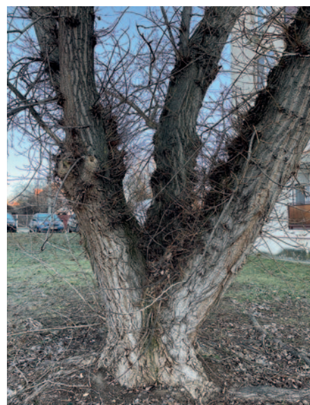
Az öreg fák helyett az önkormányzat újat fog ültetni.