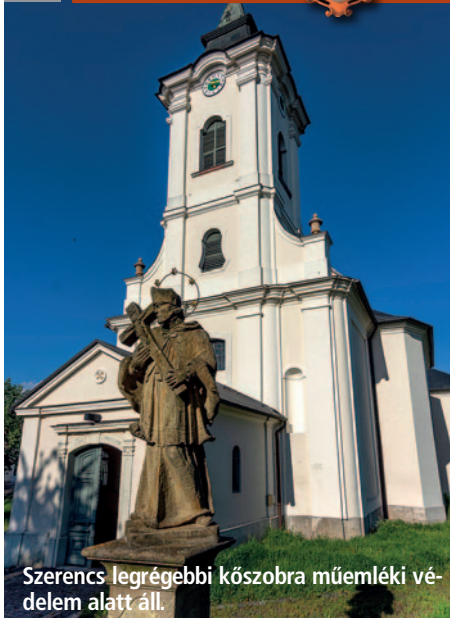
Szerencs legrégebbi kőszobra műemléki védelem alatt áll.