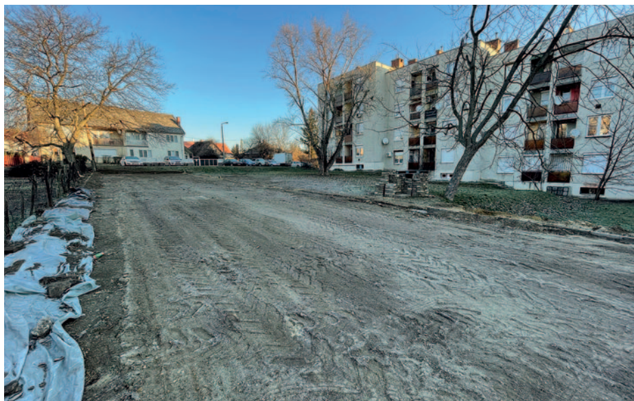
Az új parkoló közel húsz személygépkocsinak fog helyet biztosítani.

Az elmúlt években visszatérő igényként fogalmazódott meg a város lakói részéről a gépjárművek részére kialakított parkolóhelyek számának a bővítése.