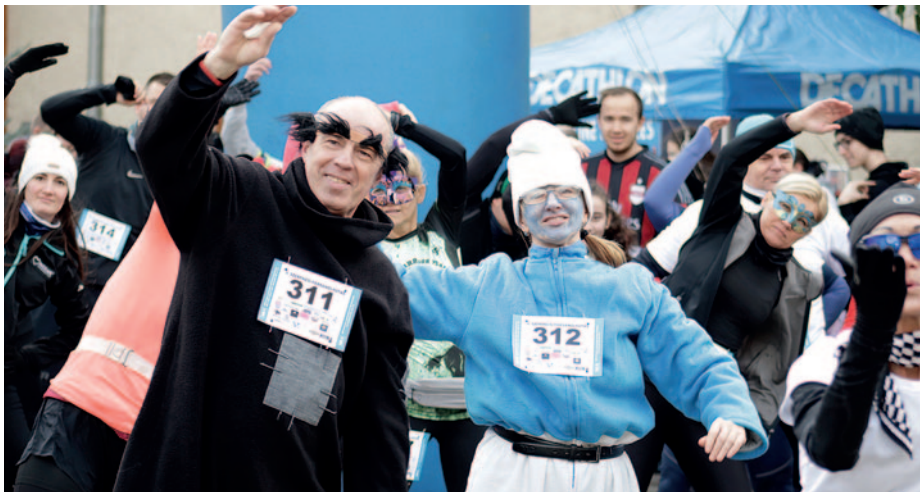
A versenyen a Hupikék törpikék szereplői is feltűntek.