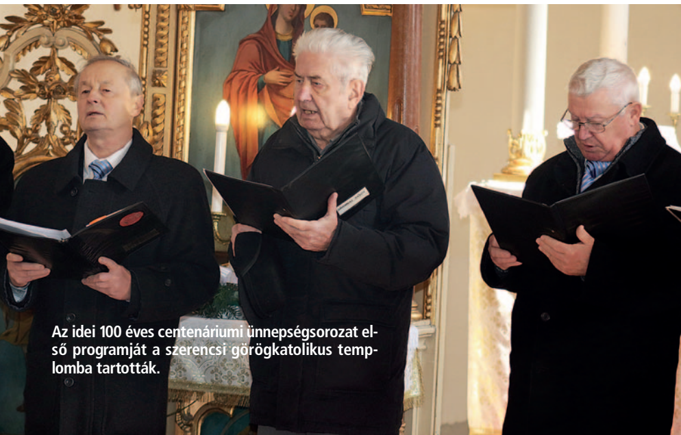
Az idei 100 éves centenáriumi ünnepségsorozat első programját a szerencsi görögkatolikus templomba tartották.