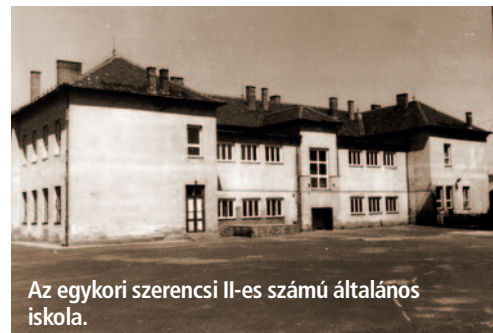
Az egykori szerencsi II-es számú általános iskola.

Tel.: +36-30-253-3691, Cím: 2461 Tárnok, Zalagyöngye utca 66., E-mail: kofe1949@gmail.com