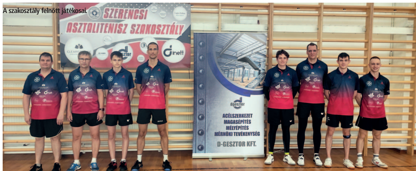
A szakosztály felnőtt játékosai.