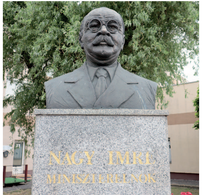
Az önkormányzat képviselői megkoszorúzták Nagy Imre szobrát.