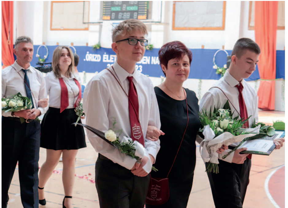
Ballagás a Bolyaiban.

Az iskola vezetősége 2017-ben megalapította a Kalkuttai Szent Teréz díjat, amit minden évben