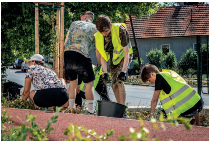
Nyári diákmunka város szépítésben.