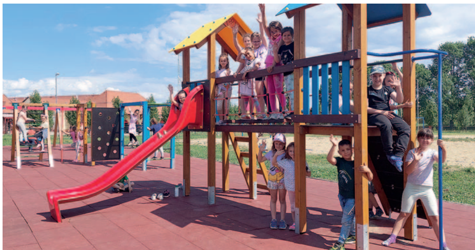
A gyermekek már birtokba is vették a játszótérét

Tudatos gazdálkodásunknak köszönhetően sikerült megvalósítanunk idén tavasszal egy EU szabvány játszótér megépítését a Rákóczi iskola udvarán. A modern játékelemekkel felszerelt területen valamennyi korosztály megtalálja az érdeklődésének megfelelő játéklehetőségeket. Az új eszközök: a drótkötélpálya, a fészekhinta és a hagyományos hinta, a csúszda, a mászóakák, valamint a fociketrec, a kondipark a streetball pálya és a pingpongasztalok változatos tevékenységeket biztosítanak a szabadidő vidám eltöltésére. Bár a játszótérét már birtokba vették a gyerekek, a terület végleges átadására öszsel kerül sor, amikor a környezetrendezése is megtörténik. Köszönetet mondunk a kivitelezőnek, a szerencsi Révisz Kft-nek.