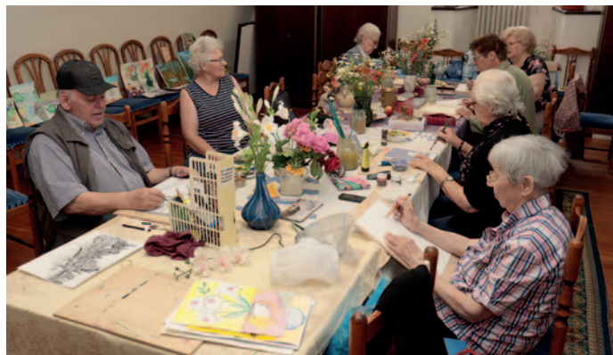
Alkotótábor a Rákóczi-várban.

A Szerencsi Képzőművészeti Stúdió tagjai tavaly a pandémia után gözerővel vetették bele magukat az alkotásba, hogy a kiesett időt pótolják. Nincs ez másképpen az idén sem, sőt a hetente ismétlődő rajzsakkörökön túl, június 12-18-a között alkotótábor is tartottak.