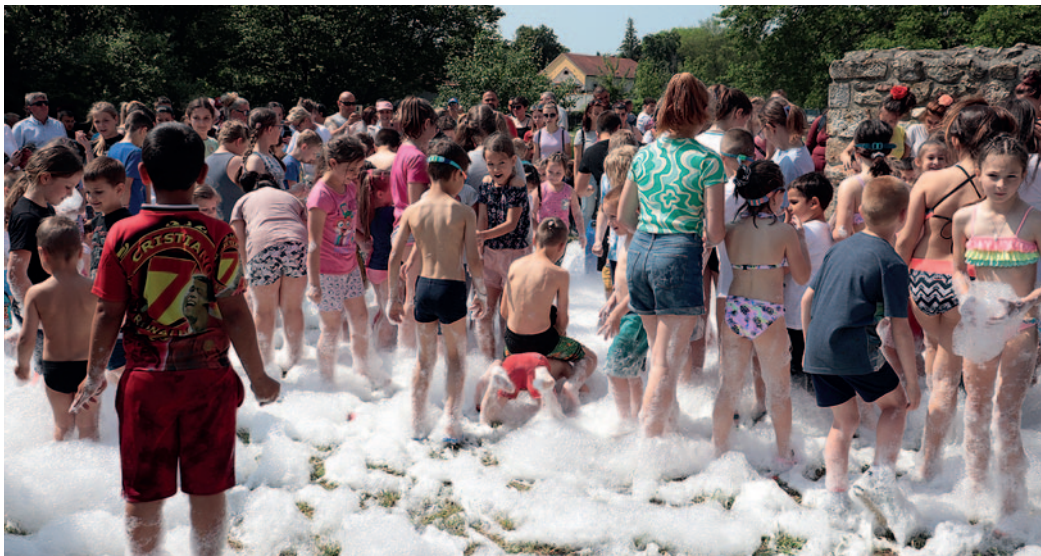
Habparti is volt a gyerekek legnagyobb öröme.