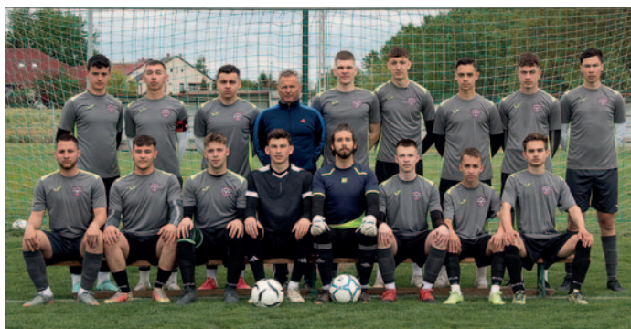
A bajnok csapat.

A B.A.Z. megyei II. Kelet U-19-es labdarugó bajnokság győztese a Szerencs VSE U19-es csapat.