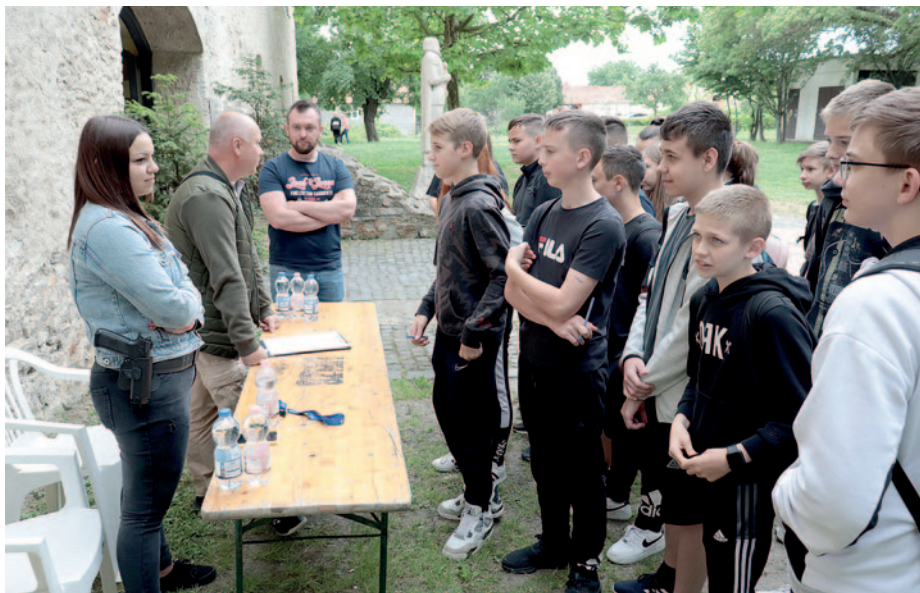
Szerencsi rendőrök is részt vettek a prevención.