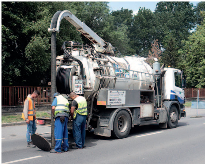
Munkálatok a Rákóczi úton.

Szennyvízvezeték-rekonstrukciós munkák kezdődtek a Rákóczi úton. Szerencs Város Önkormányzata a gesztóra a „Szerencs központú agglomeráció szennyvízelvezetése és tisztítása „elnevezésű projektnek, melynek megvalósítása az Európai Unió támogatásával és hazai pénzügyi források bevonásával konzorciumi formában történik.