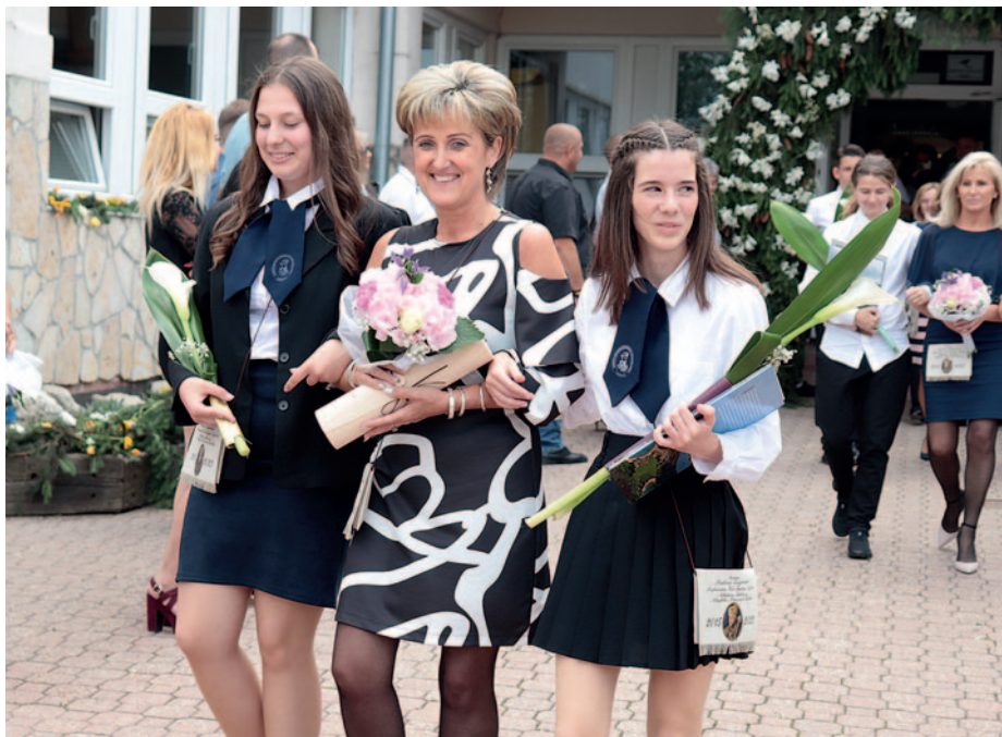
Ünnepély a Rákócziban.

„Az előtetek álló úton haladjatok előre, legyetek bátrak, váltsátok valóra az álmaitokat! A világ tele van lehetőségekkel és kalandokkal, legyetek kitartóak és lelkesek, mert én hiszem, hogy bennetek ott rejlik az erő, a tehetség és a tudás iránt vágy, ami biztosítéka boldogulásotoknak. Gratulállok nektek és szüleiteknek a ballagásotokhoz, sok sikert kívánok nektek a jövőtök építésében” – hangsúlyozta a városvezető.