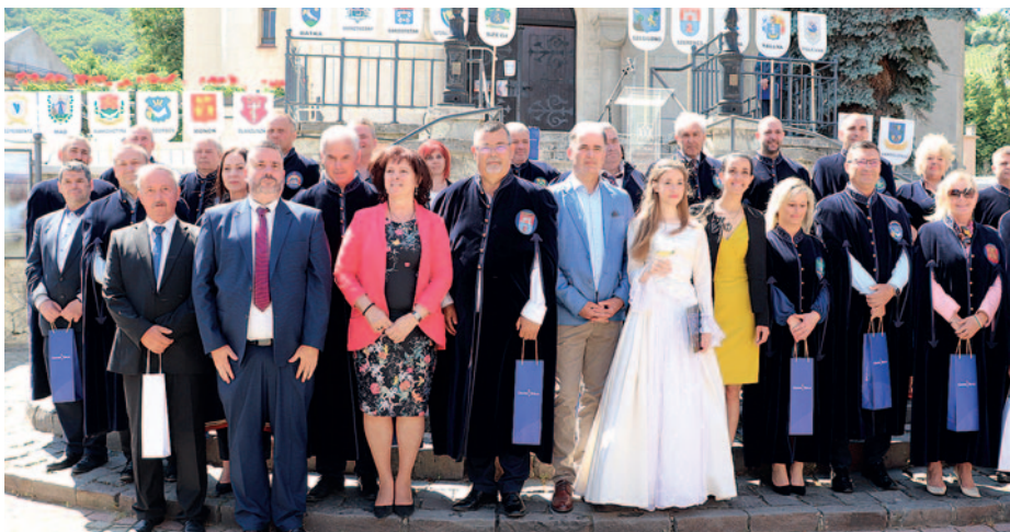
Településvezetők a tokaji borátadáson.

„A Tokaj-Hegyalja Egyetem (az oktatási intézményben szőlész-borász mérnöki, turizmusvendéglátás, gazdálkodási és menedzsment, vállalkozásfejlesztés oktatás és számos szakirányú továbbképzés van jelen) olyan intellektuális beruházásként jelent meg borvidéken, amelyik centruma egyfajta térségfejlesztő erőnek. Bízom benne, hogy az a együttműködés, ami kialakult a különböző településekkel és az elmúlt időszakban megmutatkozott a nemzetközi konferenciákon, helyi rendezvényeken az továbbra is erősíteni fogja Magyarország legfiatalabb egyetemét és ezzel együtt a térséget” – mondta Prof. Dr. Stumpf István, a Tokaj-Hegyalja Egyetem Kuratóriumának elnöke. Koncz Zsófia, a térség országgyűlési képviselő-