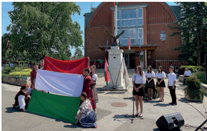
A megemlékező műsort a bolyais diákok adták

Az Országgyűlés 2010. május 31-én a nemzeti összetartozás napjává nyilvánította az I. világháborút lezáró trianoni békediktátum aláírásának napját, június 4-ét. Ehhez az eseményhez kapcsolódva tartott Szerencs Város Önkormányzata június 2-án megemlékezést a város országzászlajánál.