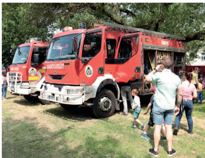
A tűzoltóautók iránt is nagy volt az érdeklődés.

1. hely FER Tűzoltóság. 2. hely Borsodbótai Önkéntes Tűzoltó-, Településszépítő-, Környezetvédő- és Foglalkoztatást Elősegítő Egyesület. 3. hely Bolyai János Katolikus Általános Iskola főzőcsapata. Különdíj: Sátoraljaújhelyi Dohánygyár Önkéntes Tűzoltó Egyesület