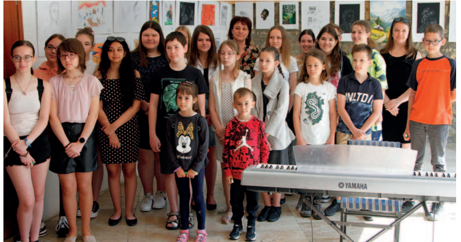
Sok fiatal művésznek nyílt lehetősége a bemutatkozásra.

„Mi ezeket a tehetségeket kutatjuk fel, akik kitűnnek társaik közül, legyen szó képzelőerőről, tervezésről, ötlet kivitelezésről. A művészt nem lehet sürgetni, ha alkotásról van szó, kiváltképp a fiatalokat. Montessori Mária olasz orvosnő szavait idézve »Nincs még egy ilyen kor, amikor a gyermeknek nagyobb szükségük lenne az értelmes segítségre, és minden ami akadályozza a kreatív tevékenységében, a tökéletesség esélyének elérését csökkenti. Az az alkotás ami nem a szívünkéből jön, eleve kárhozatra van ítél-