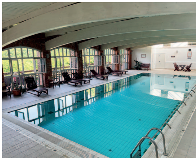
Újra várja vendégeit a Szerencsi Fürdő & Wellnessház.

„Tudom, hogy sokan várták már ezt a bejelentést és köszönöm azoknak, akik az elmúlt hónapok elszabadult energiaárai miatt tudomásul vették a kényszerű korlátozásokat. Mivel nem rendelkezünk termálvízzel, így a medencék feltöltéséhez ivóvizet használunk, amit melegítenünk kell, így a költségek szinte már megfizethetetlenek. Bízom abban, hogy az igény után sokan látogatnak majd el a nyári forró napokon a Szerencsi & Fürdő és Wellnessháza – mert ahogyan korábban is írtam – annak minél jobb