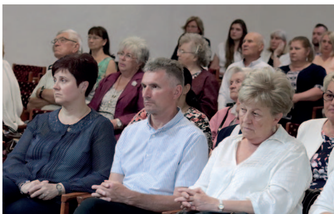
Az aktív és a nyugállományba vonult pedagógusokat is köszöntötték.

A beszéd után műsort adott a miskolci Reményi Ede Kamarazenekar egy kis csoportja, akik klasszikus zenét és közismert filmes betétdalokat játszottak a pedagógusok tiszteletére.