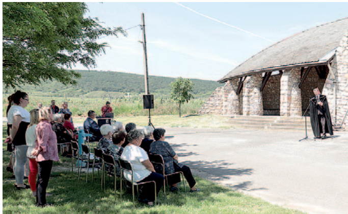
Ondon is a magyar hősökre emlékeztek.

Ezt követően a Szerencsi SZC Műszaki és Szolgáltatási Technikum és Szak-