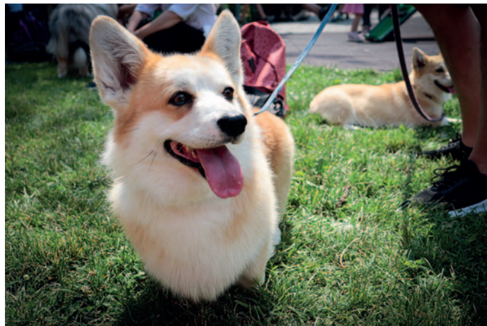
A kiállítás egyik lelkes résztvevője.

Az esemény nemzetközi volt, hiszen nem csak Magyarországból, de Romániából, Szlovákiából és Ukrajnából is érkeztek. Az általunk megkérdezett külföldi kutya barátok szerint Szerencs és környéke rendkívül szép