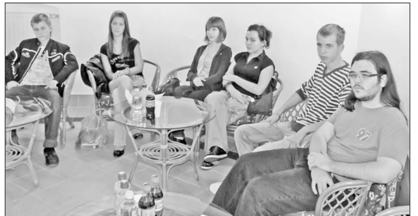
Többségében a Szerencsi Általános Iskola és a Bocskai gimnázium diákjai vettek részt a programokon.

A párbeszéd tartalmát a Mobilitás Országos Ifjúsági Szolgálat munkatársai összesítik, majd eljuttatják a döntéshozókhoz azzal a céllal, hogy a jövőben megszülető hazai, közösségi rendelkezések vegyék majd figyelembe az ifjúsági korosztály igényeit, elképzeléseit.