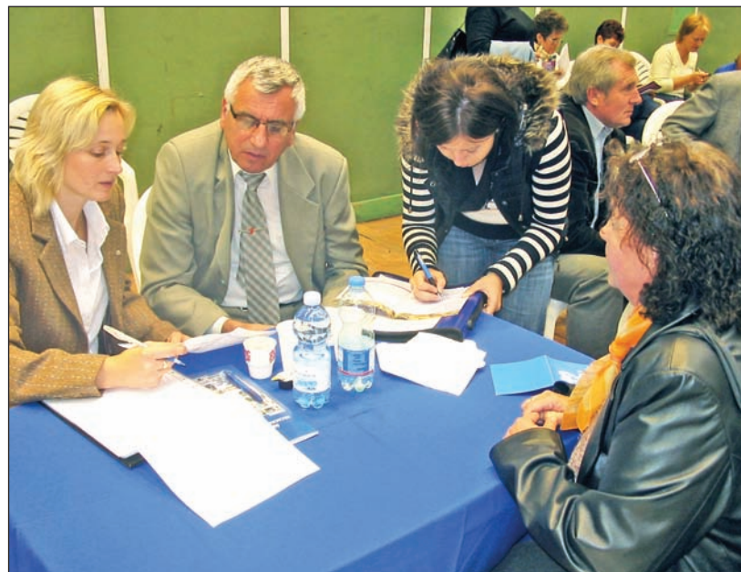
Az állásbörze résztvevői 56 munkaadó kínálatából válogathattak.

szólt arról, hogy az önkormányzatoknak közvetve van felelősségük új munkahelyek létesítésében, elsősorban a vállalkozásokhoz szükséges infrastruktúra biztosításával. Ezért is kiemelt figyelmet a város vezetése az ipari park további fejlesztésére, míg a cégek egyre több sikeres pályázattal teremthetik meg új munkahelyek létesítésének a pénzügyi alapjait. A munkaügyi központok is jelentős szerepet vállaltak abban, hogy képzésekkel, jól hasznosítható ismeretekkel rendelkezzenek az álláskeresők, mert ezzel nő az esélyük arra, hogy visszataláljanak a munka világába. Az idei szerencsi állásbörzén 720 fővel beszélgettek a munkaadók, közülük 162 fővel már előzetes megállapodást kötöttek. Huszonnégy álláskeresőnek pedig kifejezetten eredményes volt a rendezvény, hiszen ők a helyszínen már a munkaszerződésüket is aláírták.