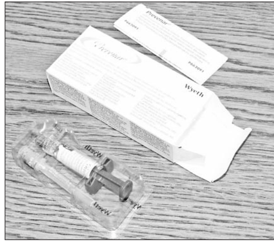
A két éven aluli gyerekek ingyenesen jogosultak a védőoltásra.

Az Országos Epidemiológiai Központ valamennyi háziorvos számára módszertani levelet küldött a 2008. évi védőoltásokról, amiben már a pneumococcus elleni vakcina beadása is szerepel. A kormány döntése értelmében idén október elsejétől a szülő kérésére valamennyi 2 éven aluli kisgyermek térítésmentesen kaphatja meg ez utóbbi védőoltást, amivel csökkenthető a gyermekkori torokgyulladás, mandulagyulladás, középfülgyulladás előfordulásának gyakorisága, súlyossága. A pneumococcus baktérium súlyos, életveszélyes betegségeket is okozhat, például tüdőgyulladást, agyhártyagyulladást, de nagyon gyakran felelős a felső légúti megbetegedések kialakulásáért, ezért fontos a gyermekek kiemelt és általános védelme. Az oltóanyag rit-