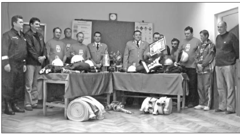
A torockói egyesület tagjai a szerencsi tűzoltóságon vették át az adományokat.

ban feladatai között a szervezetátalakítási terv időben történő maradéktalan teljesítése, valamint a társaság hazai piacainak ellátása szerepel – immár import cukorból. A családjával Szerencsen lakó cégvezető hetente három napot a társaság hatvani központjában tölt, a fennmaradó időben a szolnoki és szerencsi gyárak bontását koordinálja és ellenőrzi. Tóth Zoltán lapunk kérdésére ismertette: a telephelyeket a reaktivációt követően egyben vagy akár részben elsősorban ipari célú felhasználásra szeretné értékesíteni a tulajdonos.