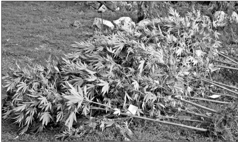
A háztájiban 22 fő kábítószer tartalmú növényt találtak a rendőrök.

Aprólékos adatgyűjtés és felderítés után október 6-án vadkender-ültetvényre bukkantak egy taktaszadai család ház kertjében a Borsod-Abaúj-Zemplén Megyei Rendőr-főkapitányság felderítő osztagja és a Szerencsi Rendőrkapitányság nyomozói. A kikerülő rendőrök a ház mögötti kukoricásban összesen 22 vad-