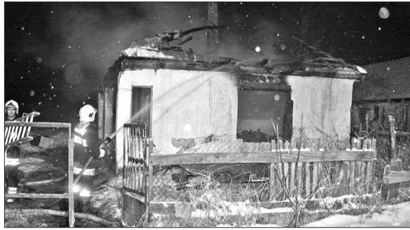
A káresetek elkerülése érdekében érdemes megfogadni a tanácsokat.

Újra közeledik a tél, ismét be kell üzemelnünk a tüzelőberendezéseinket. Felhívásunkban szeretnénk a leginkább elterjedt melegítő készülékek biztonságos használatához néhány hasznos és megfontolandó tanácsot adni.