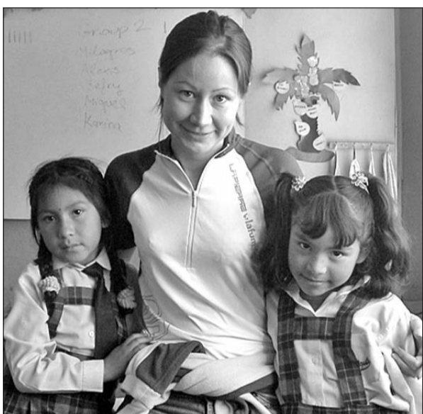
Henriett perui párja kistestvéreivel.

leimnek azonban nagyon hiányoztam, ezért az időközben megismert párommal közösen úgy döntöttünk, hogy hazajövünk.