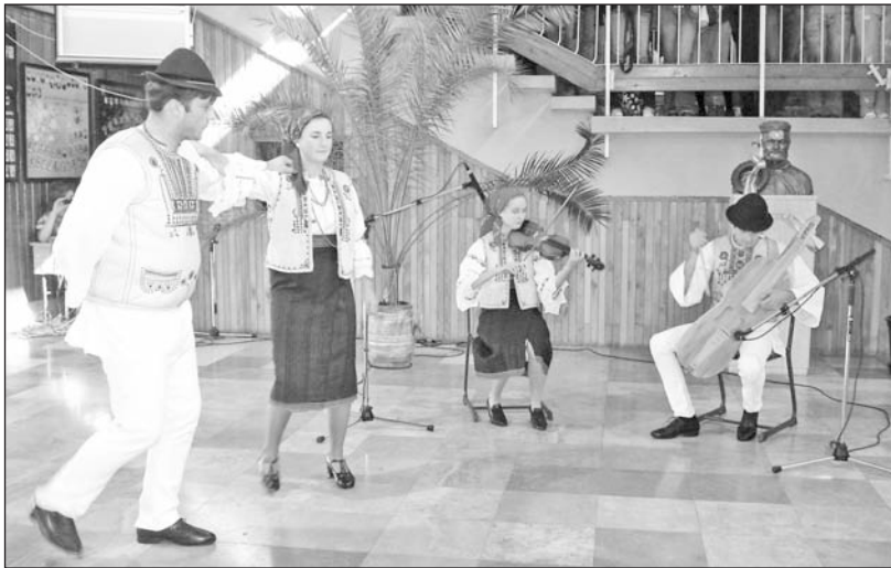
A diákok előtt nagy sikert aratott a Szalomás együttes.

A vendégek bemutatták népviseleteiket is. A férfiak pergekalo, a