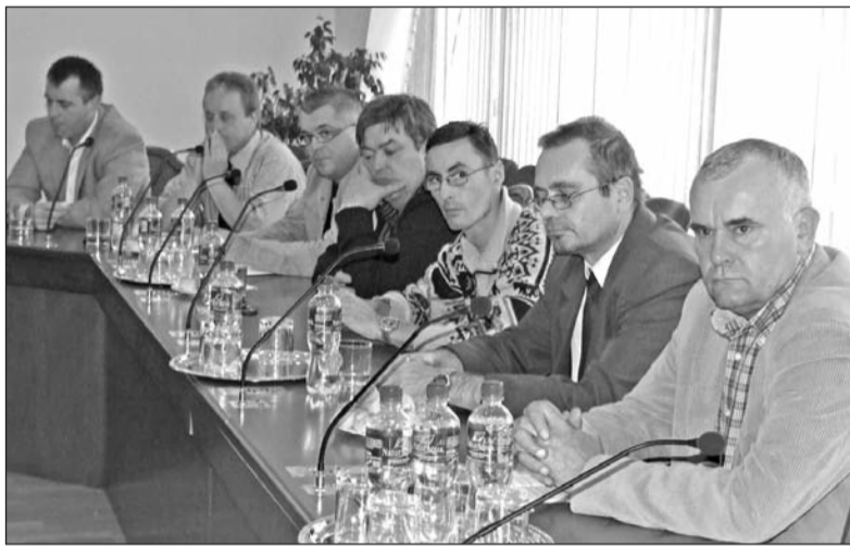
A diverzifikációs program a vállalkozásoknak is lehetőségeket kínál.