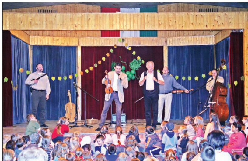
Ismét remek programmal készült a szerencsi fellépésre a zenekar.