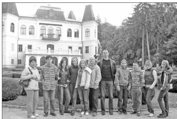
Szerencsi csapat is indult a szlovákiai vetélkedőn.