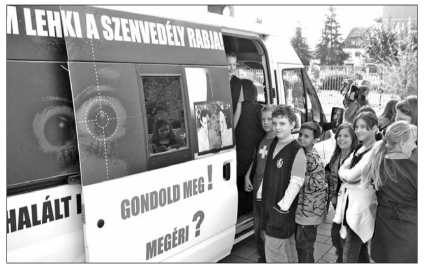
A településeken nagy érdeklődés kísérte a bemutatókat.

„Police-Mobil” néven bűnmegelőzési információs buszt indított útjára a Borsod-Abaúj-Zemplén Megyei Rendőr-főkapitányság. A prevencióstorné során – amelynek az állomásai között a szerencsi kistérség települései is szerepelnek – a speciális jármű az idősotthonokat és az általános iskolákat keresi fel. Az oktató-