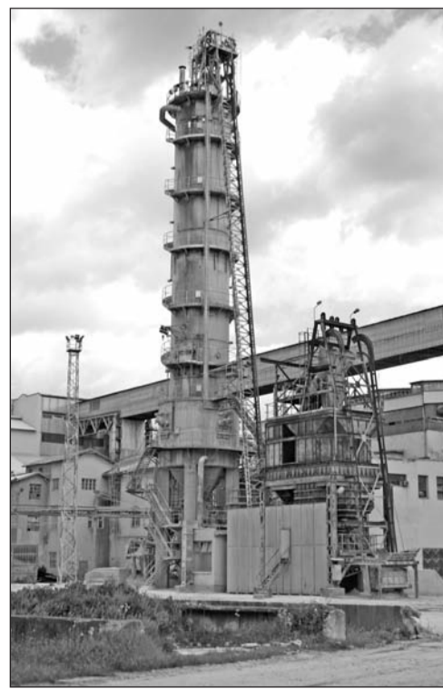
Hamarosan eltűnik a mézskemence tornya is.