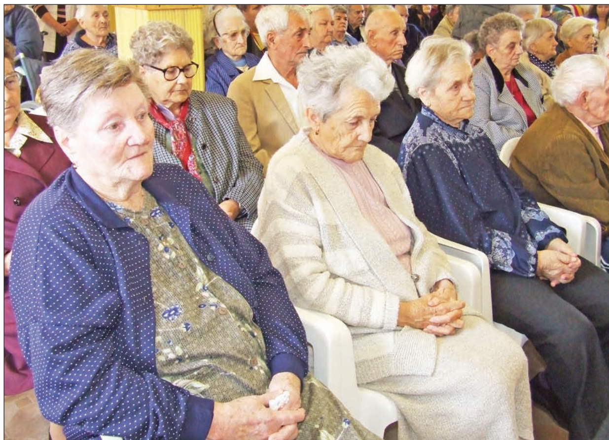
Az időseknek számos programot szerveznek októberben Szerencsen.

Ebben az évben is tartalmas eseménysorral készült a nyugdíjas korosztály köszöntésére a Borsod-Abaúj-Zemplén Megyei Önkormányzat Szerencsi Idősek Otthona. Az idősek hetei a szeptember 23-ai ünnepélyes megnyitótól indult útjára és október 21-éig a szervezők több mint tíz program keretében nyújtanak kapcsolódási lehetőséget az intézmény lakóinak.