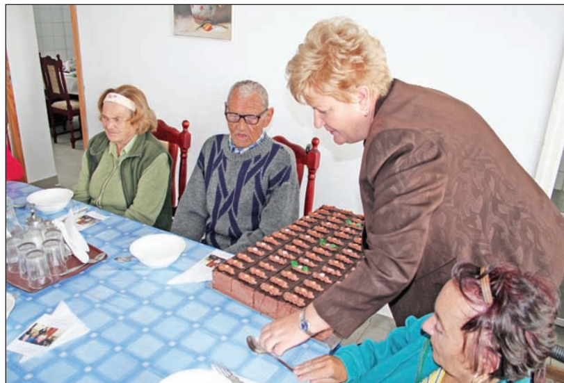
A polgármester mindkét szociális intézmény lakóit tortával lepté meg. Felvételünk a Gyémántkapu Idősothonban készült.