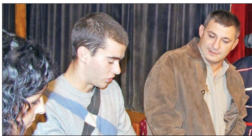
Fiatalok kérdezték pályafutásáról az egykori olimpikont.

A sportember kérdésekre válaszolva többek között szökött sportkarrierje kezdetéről. Elmondta, hogy 10 éves korában ment első alkalommal a birkózóterembe, és hamarosan életformájává vált a sport. A több-