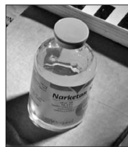
A lefoglalt gyógyszer.

Összesen 50 darab 50 ml-es Narketin 10 elnevezésű lónyugtató került elő a dobozból. Ezek kábítószer-tartalmú, ketamin hatóanyaggal rendelkező gyógyszerek, ezért vénykötelesek. A feketepiacokon gyakran értékesítik azokat drogfogyasztóknak. A két férfit őrizetbe vették a vámosok. Kiderült, mindkét huszonéves volt már büntetve. Egyikük nemrégiben éppen kábítószerrel való visszaélés miatt kapott börtönbüntetést. Az ítélet végrehajtását azonban hat hónapra felfüggesztette a bíróság, ami október 16-án járt volna le.