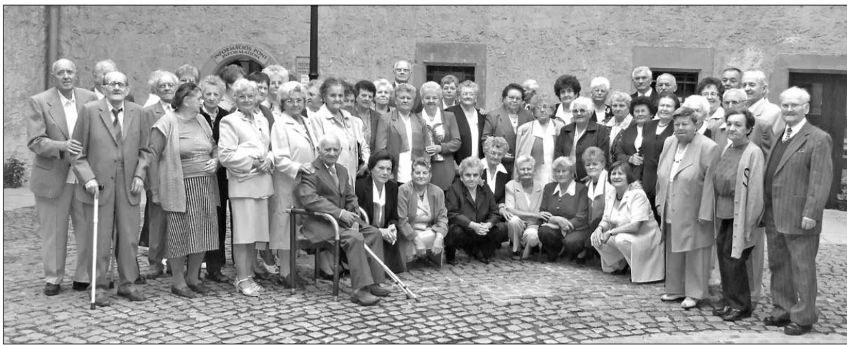
Együtt a nyugdíjas közösség a Rákóczi-várban 2009 nyarán.

A XXI. században tanúi lehetünk a közösségek felbomlásának, a családok szétesésének, a szinglik, az egyedül élő fiatalok gyarapodásának. A család intézményénél évezredek keresztül nem alakult ki jobb és összetartóbb erő. Hiszem és vallom, hogy nemzet család nélkül, család nemzet nélkül sem ér.