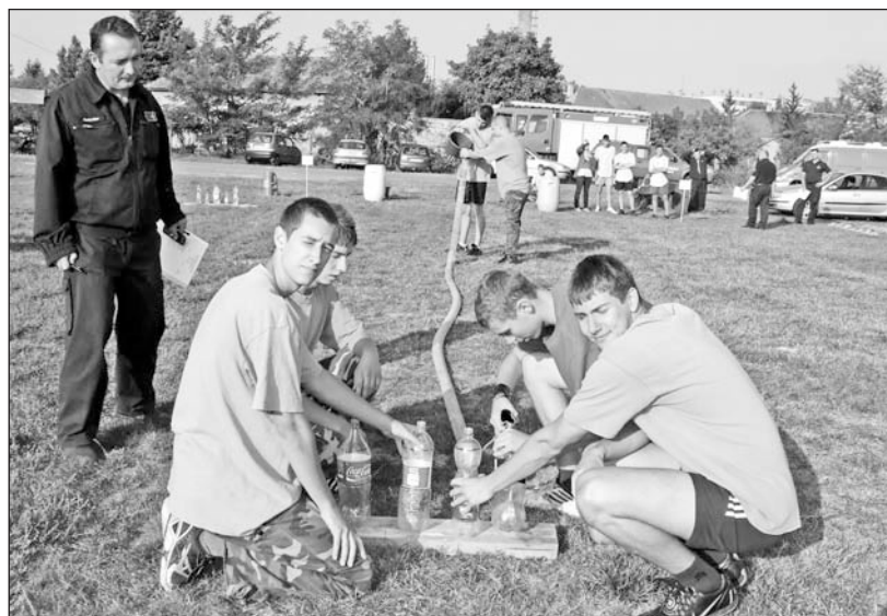
A csapatokat próbára tették az ügyességet igénylő feladatok.

zépiskolások között a tokaji mezőgazdasági szakképzős fiatalok bizonyultak a legjobbnak, megelőzve a szerencsi Bocskai gimnázium és a Szerencsi Szakképző Iskola gárdáit. Mindkét győztes csapat bejutott az október 9-ei megyei döntőbe.