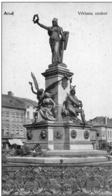
Képeslap a Zempléni Múzeum gyűjteményéből.

A „bresciai hiéna” a világsi fegyverletételt követően azonnal megkezdte a megtorlásokat. „Milyen különös, hogy Haynau bíró is keresztény és én is az vagyok. Csak az ördög keverhette így össze a kártyákat” – vélekedett a helyzetről a horvát Knézich Károly, 41 éves tábornok. Az első csoportos ítélet-végrehajtásra 160 évvel ezelőtt 1849. október 6-án történt. A szabadságharc főtisztjeit, mint valami gonosztevőket kötél általi (kivégzésük sorrendjében Pöltenberg Ernő, Török Ignác, Láhner György, Knézich Károly, Nagy-Sándor József, Leiningen-Westerburg Károly, Aulich Lajos, Damjanich János, Vécsey Károly), illetve négy főtisztet (Kiss Ernő, Schweidel József, Desseffy Arisztid, Lázár Vilmos) kegyelemből golyó általi halálra ítélték és végezték ki. Az aradi várbörtönben búcsúleveleket írtak előző éjjel, üzentek sze-