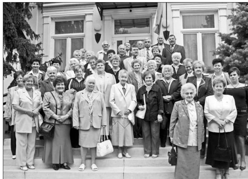
A nyugdíjas-találkozó résztvevői a középiskolai kollégium bejárata előtt.