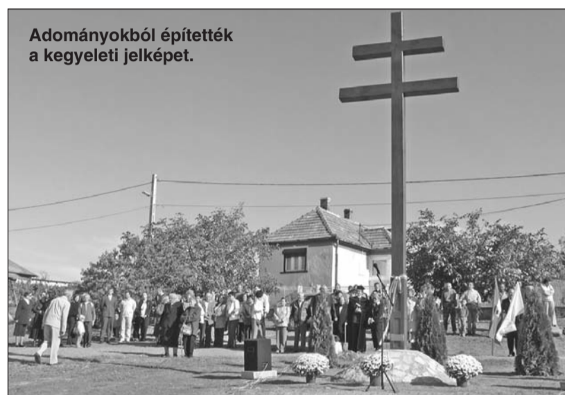
Adományokból építették a kegyeleti jelképet.

– Ez található Magyarország koronás címerében is – emelte ki a polgármester, aki hozzátette: állami jelképeink közé a kettős kereszt Bizáncból, III. Béla (1172–1196) közvetítésével került, csak később, a XIII. században, IV. Béla uralkodásától ál-