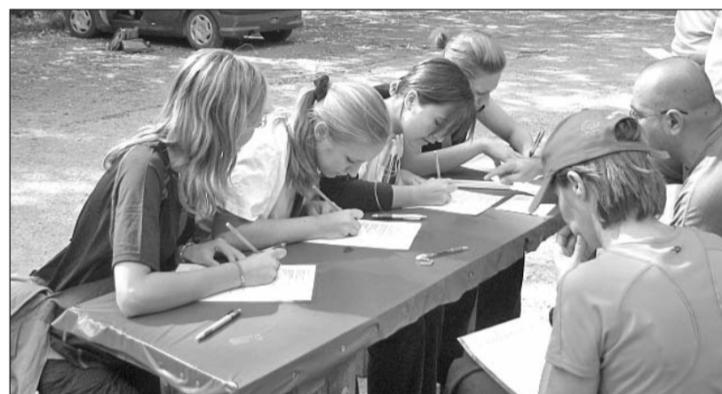
Munkában a szerencsi középiskolás csapat.

Másnap a szerencsiek a budapesti diákokkal együtt megnézték Krasznahorka várát, és túráztak a festői szépségű Szádelő-völgyben.