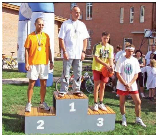
A vasember kategória legjobbjai.

Az első szerencsi triatlon ötvenegyen teljesítették. A célban a fiatalok rövid pihenő után kerékpáros vetélkedőn és kosárra dobó