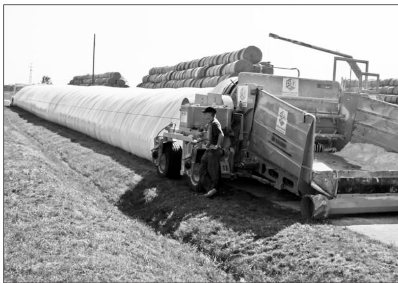
Közel 60 méteres tömbben tárolják a gabonát.

A mintegy 90 hektáros bálványosi ültetvényről szeptember 21-én és 22-én négy kombajn vágta le a termést. A szemes kukorica a korszerű gépekből a roppantó berendezésbe került, majd a szerves savval tartósított, magas nedvességtartalmú takarmányt teherautók szállították a közeli Vince tanyára, ahol a gépsor a nagyméretű fóliába töltötte az összemorzolt terményt. Az egyenként hatvan méter hosszúságú tömlőben minden további kezelés nélkül friss marad a kukorica, amelynek felhasználását három hétig tartó érési folyamat után kezdik meg a tejelő tenek takarmányozására.