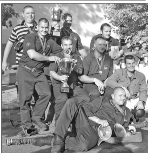
A szerencsi csapat országos szinten is megállja a helyét.