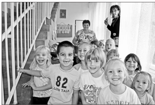
A kiállítás megtekintése közben egy fotózásra is szívesen vállalkoztak a kicsik.

Benedek Elek születésének évfordulóján, szeptember 30-án tartják szerte az országban a magyar népmese napját. A neves író, a magyar gyermekirodalom egyik megteremtője előtt tisztelegtek a szerencsi óvodákban is. Az átfogó program részeként az ondi Csillagfény Gyermeksziget óvoda nevelői bábelőadással várták a kicsiket. A Gyárkert épületben az egyik legnépszerűbb népmese, a „Kiskakas gyé-