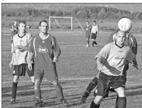
A felnőtt csapatnak hazai pályán sem sikerült nyernie.

* Egy győzelem és egy döntetlen. Ez a mérlege a szerencsi labdarúgócsapatok szeptember 26-ai, Monok elleni találkozóinak. A megyei III. osztályú bajnokság szerencsi csoportjának ötödik fordulójában lejátszott ifjúsági meccsen a monokiak szereztek meg a vezetést, miután a kapura törő csatár buktatásáért büntetőt ítélt meg a játékvezető. A házigazdák azonban lelkes játékkal megfordították a mérkőzést, amit végül magabiztosan, 4–1 arányban nyertek meg. A szerencsi csapat ezzel a győzelemmel megőrizte első helyét a bajnoki tabellán. A Monok elleni meccsen Takács Máté kétszer talált az ellenfél hálójába, Barna Gergő és Király Gábor egy-egy alkalommal volt eredményes.