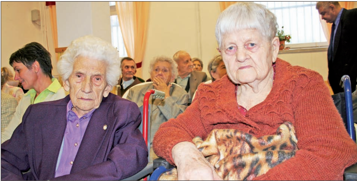
A lakók igazi otthonra találtak az intézményben.

Éppen húsz esztendővel ezelőtt, 1989-ben költöztek be az első lakók a szerencsi idősek otthonába. Az évfordulót október 1-jén ünnepelték a gondozottak és a dolgozók a Borsod-Abaúj-Zemplén Megyei Önkormányzat által fenntartott intézményben.