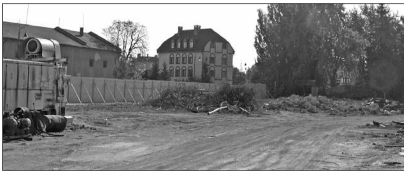
Az egykori szeletszárító ma már csak emlék.

Hamarosan az utolsó fázisához érkezik a Szerencsi Cukorgyár bontása, miután szeptember utolsó hetében megkezdődött a régi szeletszárító épület eltávolítása. A helyiek közül sokan talán most szembesültek igazán az üzem sorsával, hiszen eddig a külső szemek elől elzárva végezte munkáját a kivitelező, ezúttal pedig a Rákóczi úton sétálók is szemtanúi lehettek a rombolásnak. A régi szeletszárító volt az utolsó, még teljes egészében lábon álló, bontásra ítélt objektum a területen. Információink szerint az utóbbi évtizedekben már nem töltötte be eredeti funkcióját az épület, ennek ellenére szerves része volt a gyárnak és vele együtt Szerencs mindennapjainak.