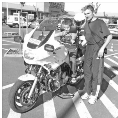
Az alkalmi rendőrmotorosnak tetszett a szombati program.

Bűn- és balesetmegelőzési napot tartottak szeptember 26-án Szerencsen, az egyik áruház parkolójában. A családok számára meghirdetett programon a helyi tűzoltóság és a rendőrség tevékenységébe pillanhattak be az érdeklődők. A gyerekek számára különleges élmény volt, hogy beülhettek a hatalmas piros tűzoltóautókba. Megérkeztek a helyszínre a motoros rendőrök, a bátrabb fiatalok a kétkerekűek nyergébe is felpattantak. A tűzoltók és a rendőrök a főzőversenyhez készülődtek, amiben az egyenruhá-