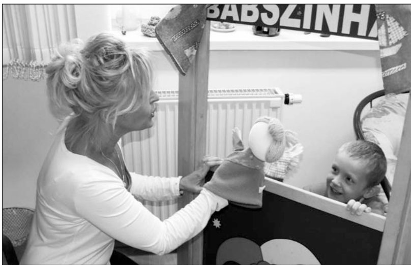
Játékos foglalkozás a pszichológussal.

A nevelési tanácsadás keretében a szakemberek megállapítják, hogy a