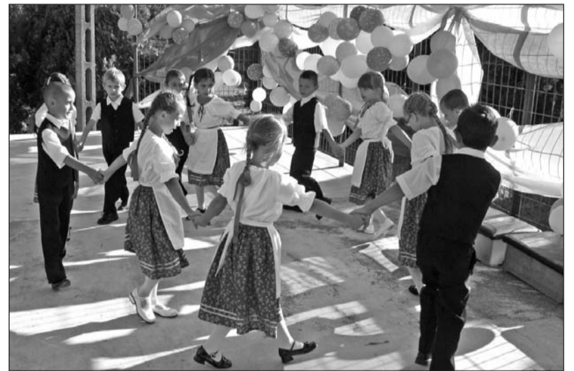
A színpadon a helyi általános iskola néptáncosai is bemutakoztak.