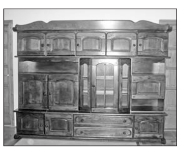
Megkímélt állapotú, holland nappali szekrény eladó. Irányár: 70 000 Ft. Érd.: 30/824-5173. (14)