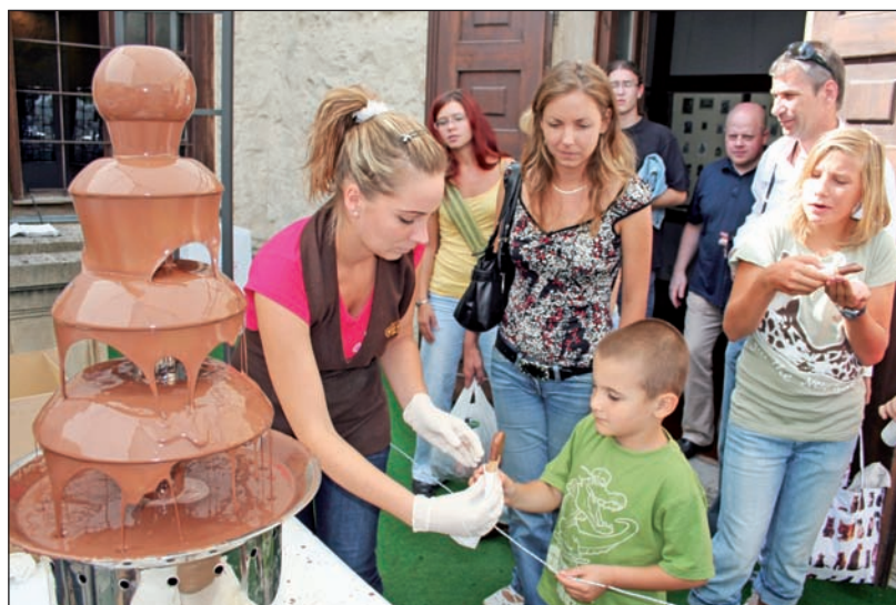
Jutott mindenkinek a finomságokból.