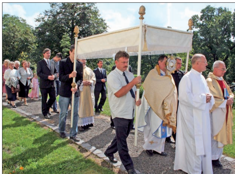
A templombúcsú hagyományos eseménye a körmenet.

Az ünnep végén a hagyományoknak megfelelően az udvarra vonultak a hívek, ahol kezdetét vette a templomi körmenet.