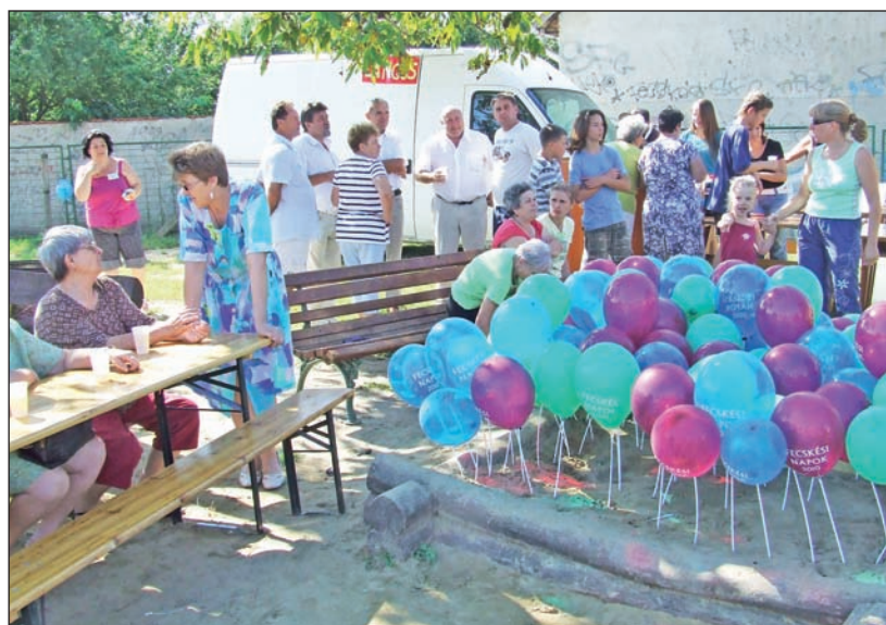
Nagy volt a nyüzsgés a játszótéren.