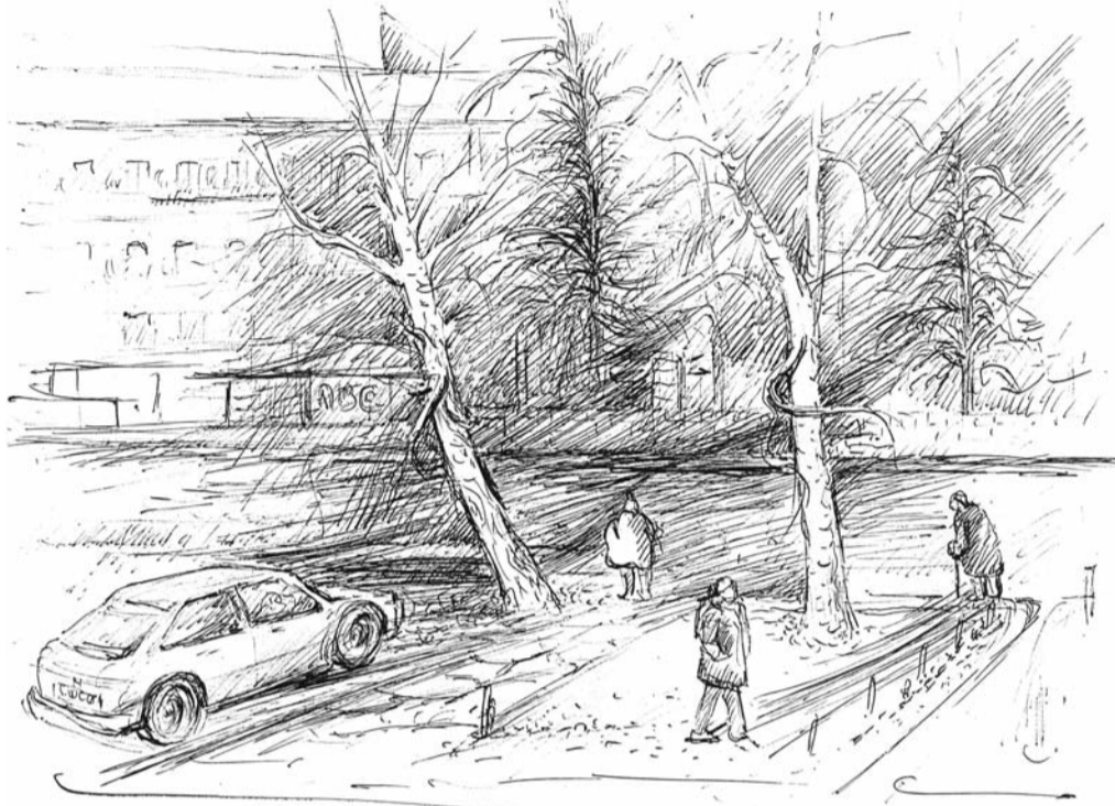
Schlosserné Báthory Piroska: Esős nap.

Vendégül láttalak volna tán lelkem terített asztalán, ha nem csal meg pillanat mi a fényben magával elragad.