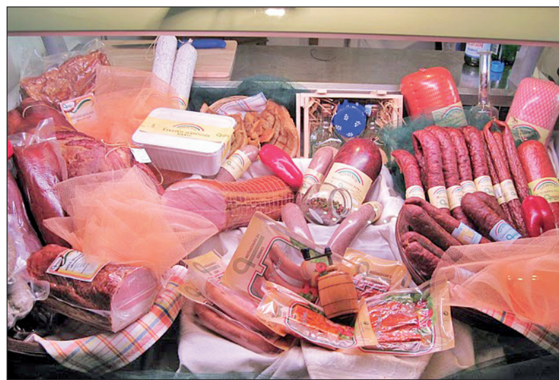
Ízletes hústermékek Szerencsről.

kor biztonságos, ha annak minden elemét környezettudatosan, egymással összehangolva működtetik. A Szerencsi Mezőgazdasági Zrt. ennek szellemében állítja elő a takarmányt, ez a gyakorlat érvényesül a szarvasmarha-, sertés- és baromfiágazatokban, a tojás- és húsfeldolgozásban, egészen a fogyasztásra szánt kész termékekig. Az abaujszántói húsüzem készítményei a folyamatosan növekvő vásárlói igényeket is kielégítik, amelyek közül a budapesti élelmiszeripari kiállításon népszerű parasztmájás és aszalt szilvás sonka is megtalálható a társaság szerencsi üzletében.