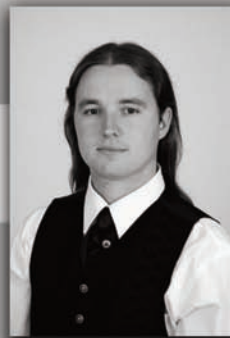
Horváth Ádám polgármesterjelölt