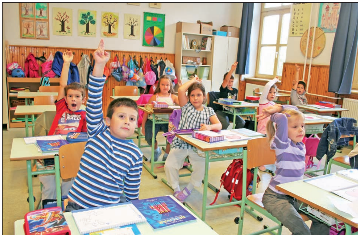
Idén 101 első osztályos kezdte meg tanulmányait Szerencsen.

A nyári szünetben elvégzett karbantartások és felújítások után augusztus végén, szeptember elején megkezdődött az új tanév a szerencsi oktatási és nevelési intézményekben. A helyi általános iskolába több mint kilencszáz, a Bocskai gimnáziumba közel ezer diák iratkozott be, miközben a bölcsődében és az óvodákban a korábbi időszakhoz képest egyaránt bővült a gyereklétszám.