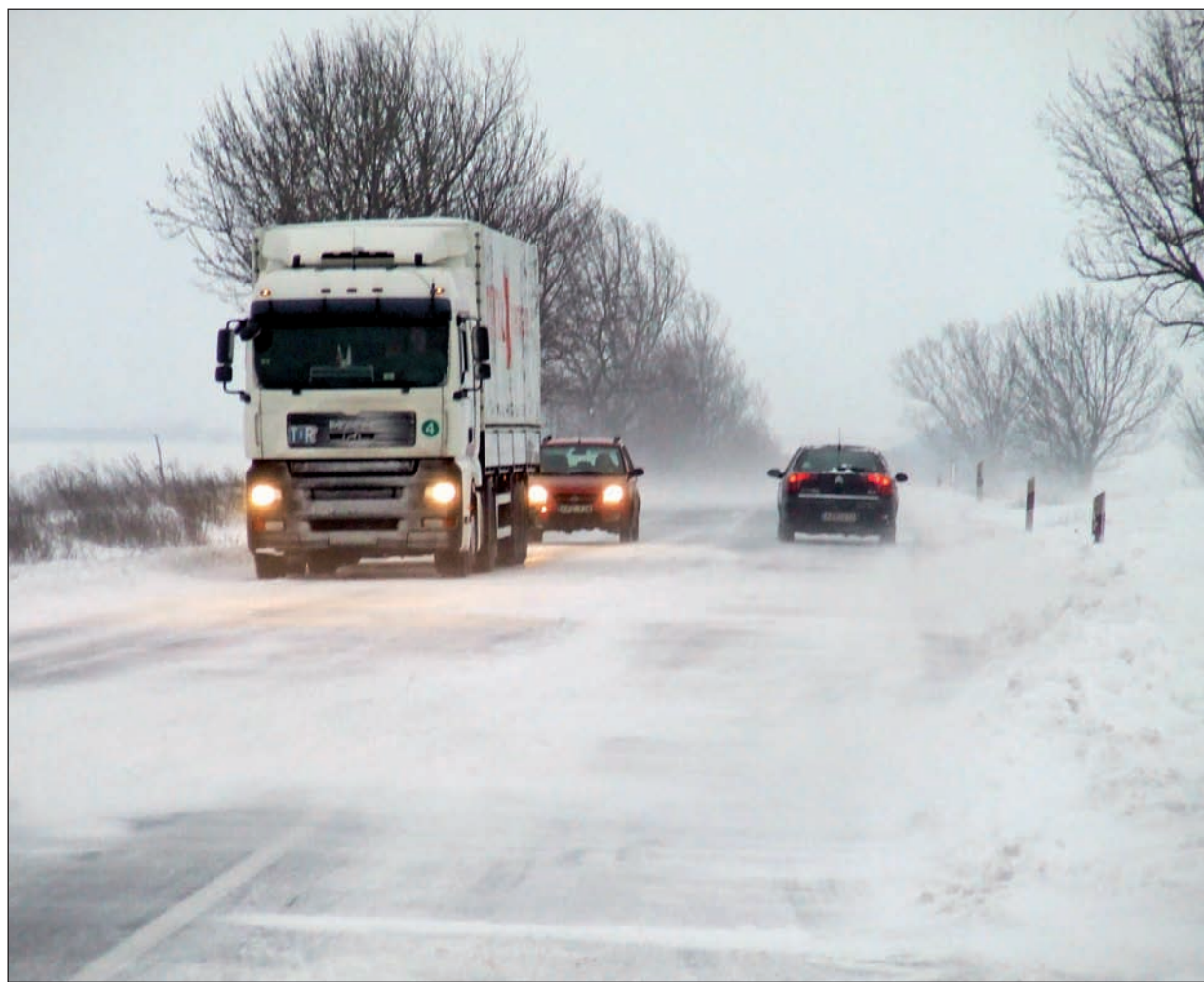
A 37-es számú főúton okozta a legtöbb gondot a téli időjárás.

Valódi téli időjárás nehezítette a közlekedést január utolsó hétvégéjén Szerencsen és környékén. A két nap alatt lehullott 30 centiméter hó és az erős szél helyenként járhatatlanná tette az utakat. A Szerencsi Városgazda Nonprofit Kft. gépei vasárnap a város valamennyi utcájában egy nyomon letolták a havat az aszfaltról, majd a cég munkatársai a buszmegálló környékét és a Rákóczi úton lévő parkolókat takarítását végezték.