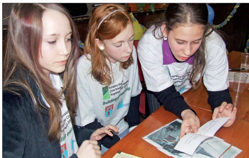
Szerencsi és rozsnyói gyerekek közös csapatban vettek részt a vetélkedőn.

Ez alkalommal Rozsnyó Város Napjának rendezvénysorozatán vettek részt szerencsi diákok.