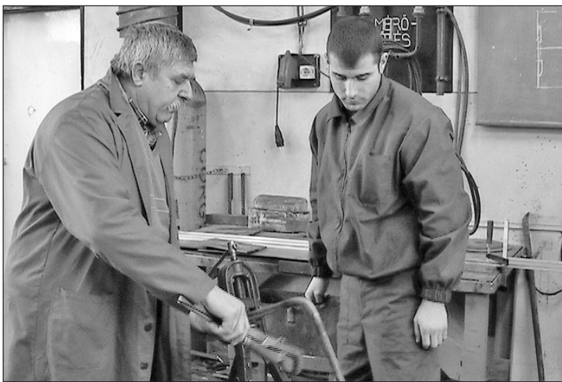
A tanműhelyekben a szakma gyakorlati fogásait sajátítják el a diákok.

A Szerencsi Szakképző Iskola jelentős segítséget nyújt a fiataloknak a szükséges gyakorlat megszerzésében. A női szabók, fodrászok, valamint a központfűtés- és csőhálózat-