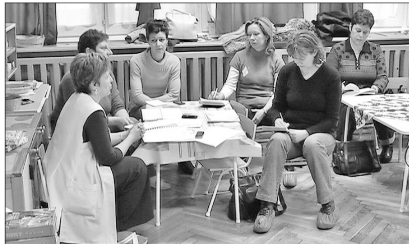
Az anyukák az elkövetkező hónapok programjáról is tájékoztak.

Az óvodapedagógusok folyamatosan végzik a csöppségek felkészítését az iskolai életre, kitüntetett figyelmet fordítva a nagycsoportosok fejlesztésére, iskolaérettségük megállapítására. Az elkövetkező hetek programjai között szerepel a kiszabás-égetéssel, karnevállal és előadásokkal színesített farsangi hét. A Napsugár óvodában idén is lesz nyílt nap, egy délelőtti pedig a nagyszülőket is meghívják majd az unokákhoz, ami reményeik szerint egy újabb sikeres program lesz a csoportok életében.