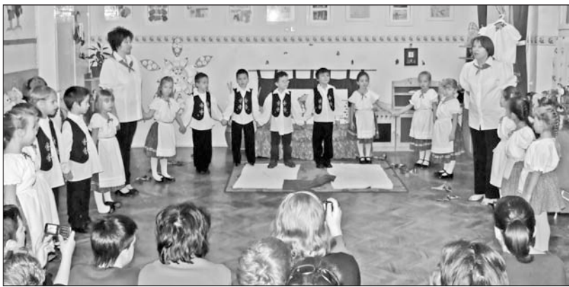
A gyermekek ezúttal a szülők előtt mutatták be a tanultakat.

zenei képességek gyarapodásában, készségeik gazdagodásában, leglátványosabban pedig a néptánc területén fejlődtek. A tematikában megjelölt feladatokat könnyedén teljesítették, sikerélményként élték meg a fejlesztő játékokat. Jól tűrték a monotóniát, a gyermek-táncgálára készülve, fáradtságot nem ismerve törekedtek a teljességre, ami a pedagógusoknak is élményt jelentett.