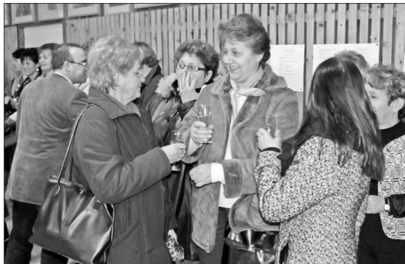
A gimnáziumban koccintottak az új évre az önkormányzati dolgozók.

hangsúlyozta, hogy az egyes területeken dolgozók mellett a település önkormányzati képviselői és a város vezetői is azon munkálkodnak, hogy a közszolgáltatás mindenki számára biztosított legyen Szerencsen. A polgármester ehhez a munkához ajánlotta fel együttműködését a jelenlévőknek, elvárásaként fogalmazva meg az intézményekben dolgozóktól az eddig is tapasztalt pozitív hozzáállást, ami a működőképesség megőrzésének egyik záloga.