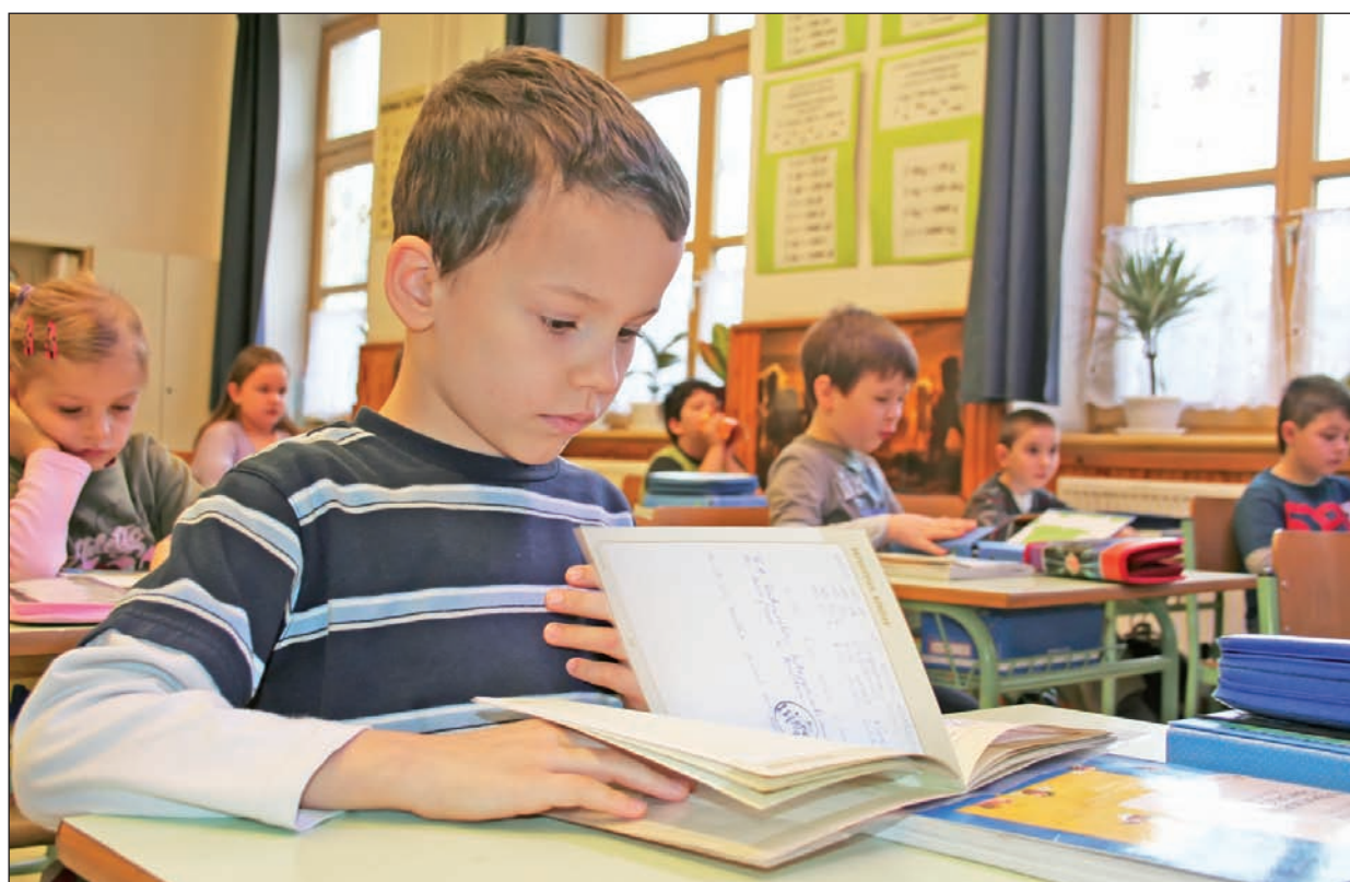
Az első osztályosok is nagyon várták a bizonyítványt.

Az ország más oktatási intézményeihez hasonlóan január 14-én a szerencsi általános és középiskolákban is véget ért az első félév. A városban 2571 diák vette át osztályfőnökétől az elmúlt hónapok tanulmányi eredményét tartalmazó tájékoztatót.