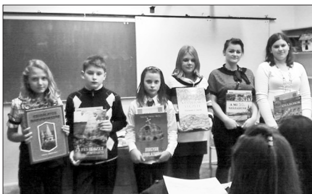
Idén 22 fiatal szavalt a zsűri előtt.

Az utókorra maradt kézirat tanúsága szerint Kölcsey Ferenc 1823. január 22-én fejezte be a Himnusz megírását. Ennek tiszteletére 1989-