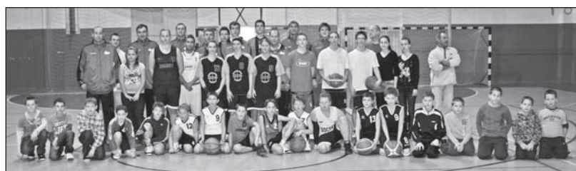
Kicsik és nagyok együtt léptek pályára.