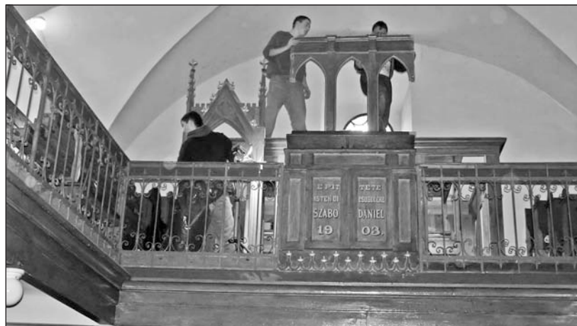
A tervek szerint húsvétkor szólal meg ismét a régi hangszer.

tőszerkezetét, az épület belsejét és a fűtést, valamint az épület környezetét egyaránt érinti. Az orgona felújítása során öt regiszterrel bővül a sípsorok száma, a hangszer kétmanuálissá és pneumatikusból mechanikussá alakítják. Az orgona a tervek szerint április közepére kerül vissza az eredeti helyére és húsvétkor szeretnék első alkalommal nyilvánosan megszólaltatni. Az egykor 3200 koronáért megépített hangszer pályázati támogatással történő felújítása 40 millió forintba kerül.