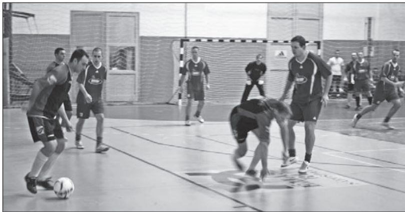
A szerencsi együttesnek ez alkalommal a tisztas helytállás jutott.

„B” csoport: Tokaj – Erdőhorváti 3–2, Tiszalúc – Szerencs 4–1, Tállya –