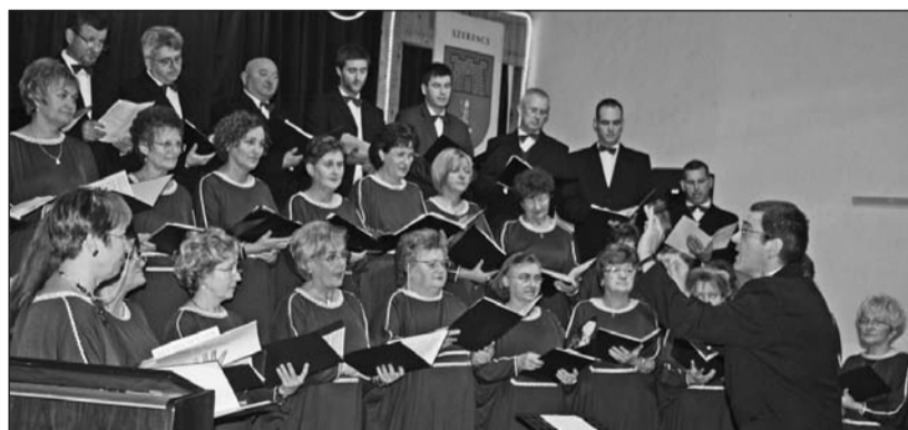
Számos fellépés áll a kórustagok mögött.

A Hegyalja Pedagógus Kórus 42. éve működik városunkban. Összefogja Szerencs és a környék településeinek zeneszerető polgárait. Örömmel jövőnk össze a szerda délutáni próbákra 16.30–18 óra között a Rákóczi-várban, amelynek felújítása miatt februárban és márciusban a polgármesteri hivatal Rákóczi út 63. szám alatti épületében találkozunk.