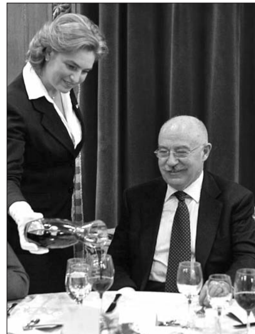
Az első díszvacsorán. Gál Helga vendége Martonyi János külügyminiszter.

A diplomáciai vendéglátásnak országonként különböző módja van. Hazánk az Európai Unió soros elnökeként az előttünk lévő fél évben régiós borainkat mutatja be, magyar csúcstorokkal kedveskedik a hozzánk látogató politikusoknak, diplomatáknak. Mi vagyunk az első EU-s tagállam, amely ezt sommelier közreműködésével teszi.