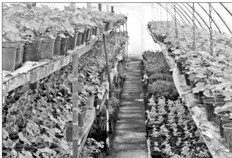
Tavasztól a kandeláberekre kerülnek a muskátlik.

Az önkormányzat korábbi ülésein több alkalommal esett szó arról az el-