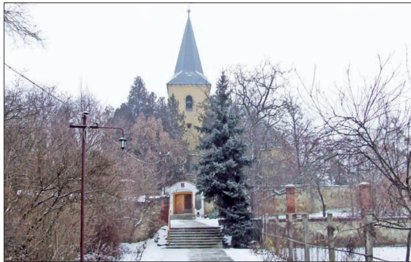
Az ódon épület kívül-belül is megújul a jövőben.

A református templom külső és belső rekonstrukcióját, valamint a templomkert rendezését a nyíregyházi székhelyű NYÍRÉPSZER Hungária Építőipari és Szolgáltató Kft. nyerte el. A római katolikus templombelső, valamint az épület és a várkert keríté-