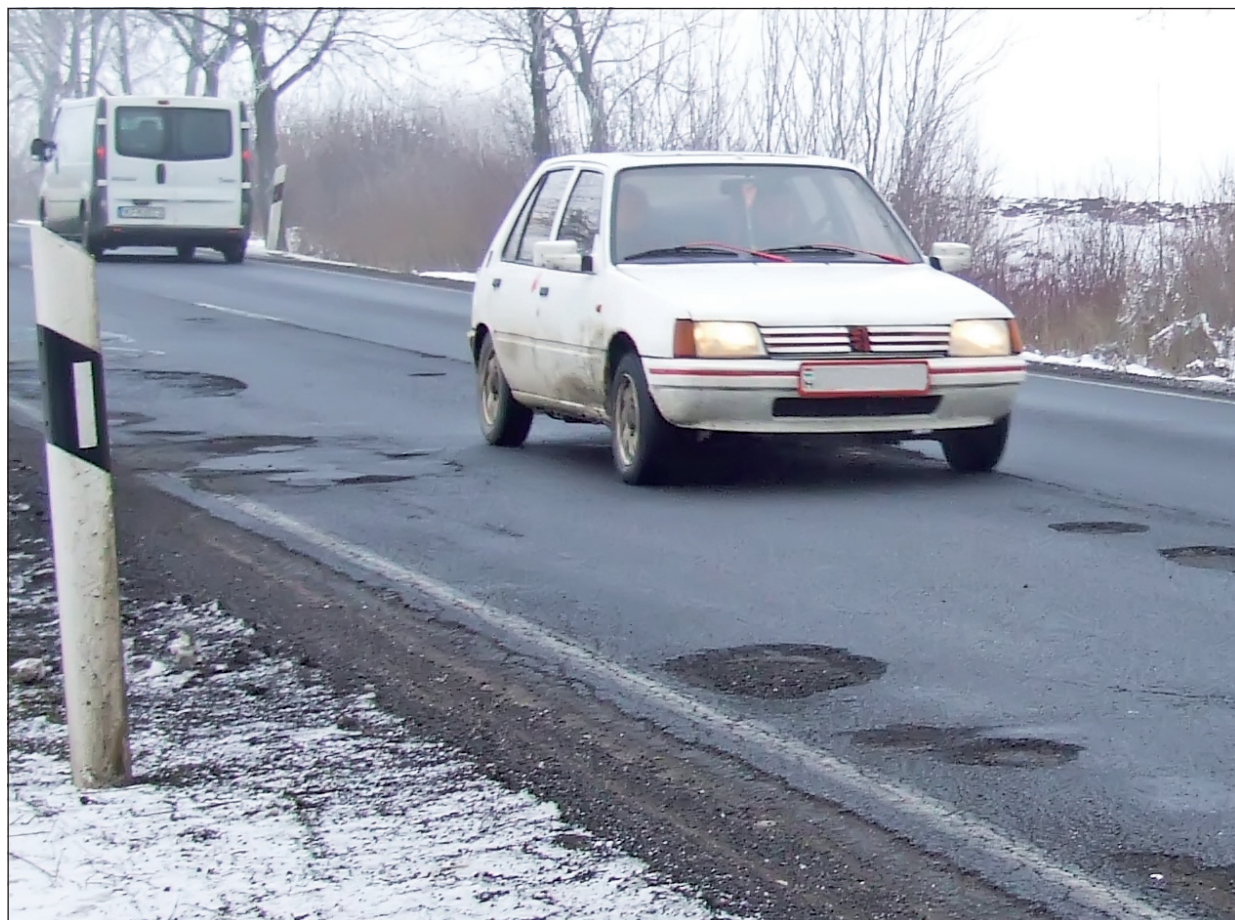
Sűrű úthibák nehezítik a közlekedést.

Az elmúlt hetekben a szaporító kátyúk miatt szinte járhatatlanná vált a 37-es számú főút Szerencs – Gesztely közötti szakasza. A Magyar Közút Zrt. ugyan folyamatosan javítja a balesetveszélyes burkolati hibákat, azonban ahelyett, hogy javulna, inkább romlik a közlekedési helyzet.