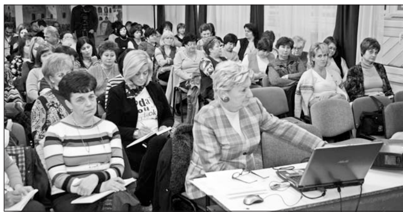
A félévzáró értekezleten az elkövetkező hónapok feladatait is meghatározták a pedagógusok.

Félévzáró értekezletet tartottak január 24-én a Szerencsi Általános Iskolában. A Rákóczi épület konferenciatermében az intézmény tanestülete előtt a munkaközösségek vezetői számoltak be az alsó és felső tagozatosok eddigi teljesítményéről. A tanácskozáson határozat született többek között arról, hogy a hiányzások csökkentése érdekében a pedagógusok a jövőben nagyobb figyel-