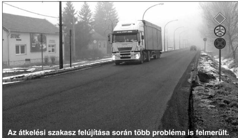
Az átkelési szakasz felújítása során több probléma is felmerült.

A 37-es számú főút Szerencs átkelési szakaszának rekonstrukciójáról történt egyeztetés február 3-án a polgármesteri hivatalban. A megbeszélést a Nemzeti Infrastruktúra Fejlesztő