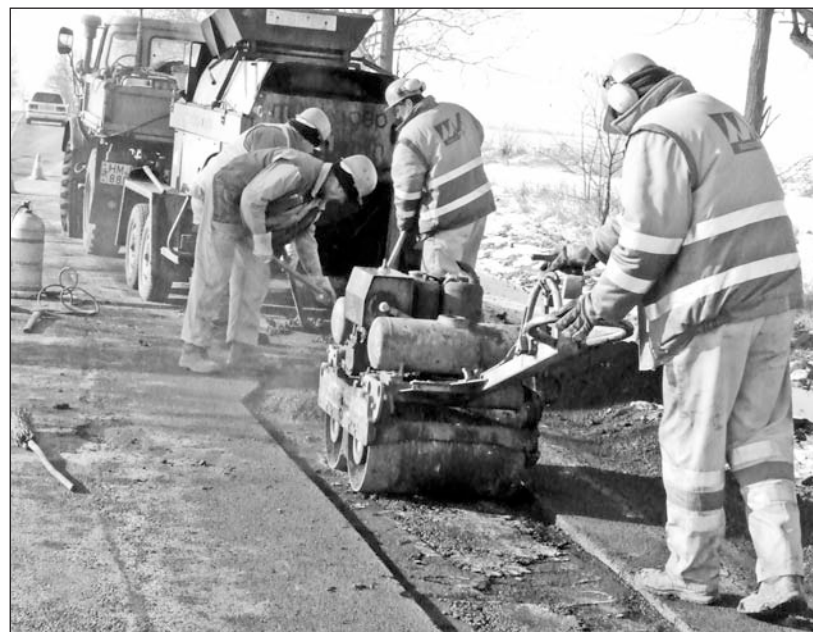
A részleges javítások csak átmeneti megoldást jelentenek.