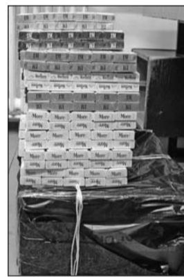
A lefoglalt dohánytermékek.

Cigánd felől jöttek és Tiszacsermely felé tartottak a csempészek január 26-án délután, amikor meglátták az úton velük szembe jövő rendőrautót. Ettől annyira megijedtek, hogy gyorsan megfordultak és elindultak visszafelé. A cigándi rendőrség járőrének ez tűnt fel. A sötétszürke Volkswagen Passat után eredt, amit leállított. Az ellenőrzéskor az autó hátsó ülésén lévő fe-