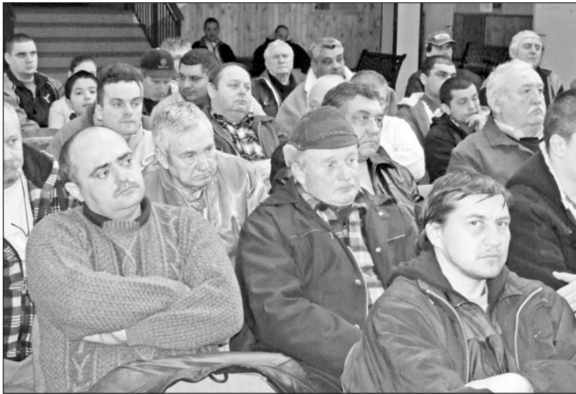
Régi horgásztársak találkoztak a közgyűlésen.

A tavalyi halpusztulásról szólva elhangzott, hogy az SZHE elvégeztette a Homokos-tó vízvizsgálatát, amelynek eredményeként kiderült, hogy az árvíz