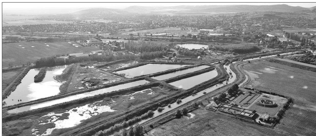
Számos ritka madárfaj fészkelő helye.