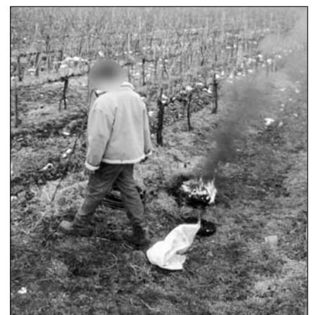
A férfi a szőlősorok között égette a kábeleket.

Kábelégető tolvajt fogtak a sárospataki járőrök egy tereplovaglásos akció során a település szomszédságában lévő szőlőterületen.