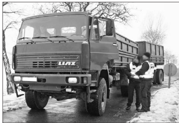
A teherautók ellenőrzése volt a cél.

Háromnapos európai összehangolt közlekedésrendészeti akció keretében a tehergépjárművek átfogó ellenőrzését végezte Borsod-Abaúj-Zemplénben a rendőrség.