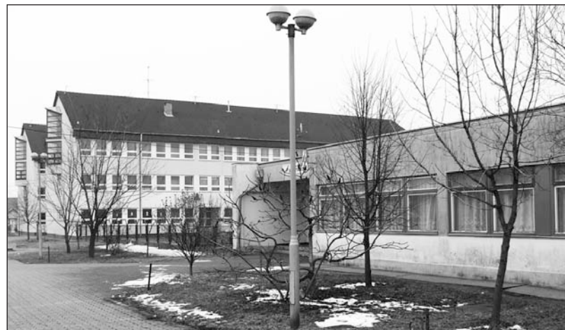
Egymás mellett: óvoda és iskola.