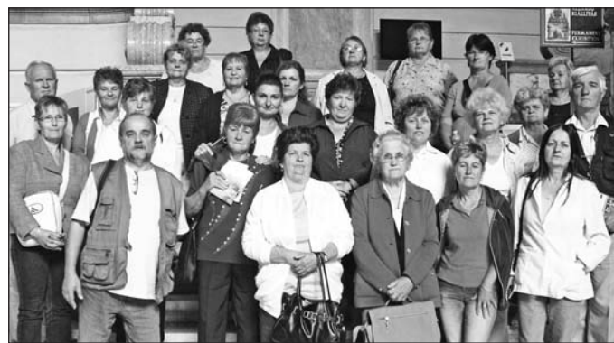
Látogatás a Parlamentben.

A demokratikus jogok gyakorlását segítő kompetenciák fejlesztése céljából 2011. február 21-től 160 fős, hátrányos helyzetű célcsoportnak 20 alkalommal 45 perces kiscsoportos foglalkozásokat szerveztünk. A képzéshez hozzájárultunk a hátrányos helyzetű rétegek társadalmi integrációjának ösztönzéséhez és