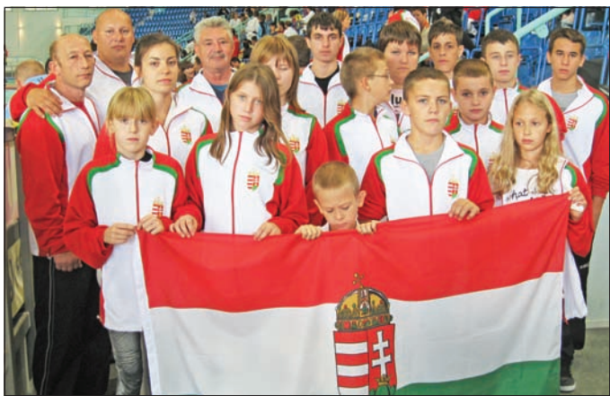
A sikeres szerencsi csapat Németországban.