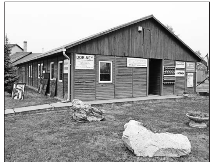
A cég telephelye a Szerencsi Ipari Parkban van.

– Szűkülnek a lehetőségek a városban. A fiatalok nagy része nem akar Szerencsen maradni, helyben letelepedni, ami többek között oda vezet, hogy nem lesz műszaki értelmisége a városnak. Most csak komoly beruházásokkal lehetne munkahelyeket teremteni, ami a helyi kis- és középvállalkozásokon is segítene, a fizetőképes kereslet bővülésével forgalomnövekedést generálhatna.