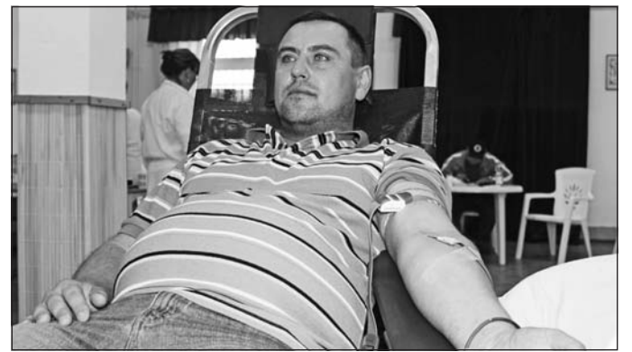
Sajnos, ezúttal kevesen vállalkoztak a véradásra.