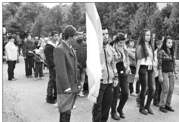
Indulhat a felvonulás.

A szőlőtermelés ma sem tartozik az elfeledett mezőgazdasági tevékenységek közé a településen, ami együtt jár a betakarítással, a szüreti vigassággal. Az egykori hagyományos szüreti mulatságok hangulatát a Hankó Zoltán Olvasókör elevenítette fel október 8-án. A civil szerveződés közösségi házából indult a szüreti felvonulás, amelynek vidám hangulatát a Megyaszói Fúvószenekar alapozta meg. A szüretelő jelmezekbe öltözött fiatalok