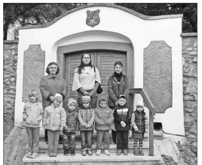
Látogatás a szerencsi református templomban.

Az óvodások az épületen belül a templomi berendezéseket is megismerhették, majd beszélgetés kezdődött, ahol többek között szó volt a Bibliáról, az imáról, az istentisztelet szer-