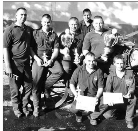
Huszonöt csapat között érték el a legjobb eredményt.

A többállomásos hagyományörző verseny összesített eredményei alapján a Szerencsi Hivatásos Önkormányzati Tűzoltóság csapata immár harmadik alkalommal szerezte meg az első helyezettnek járó vándorserleget.