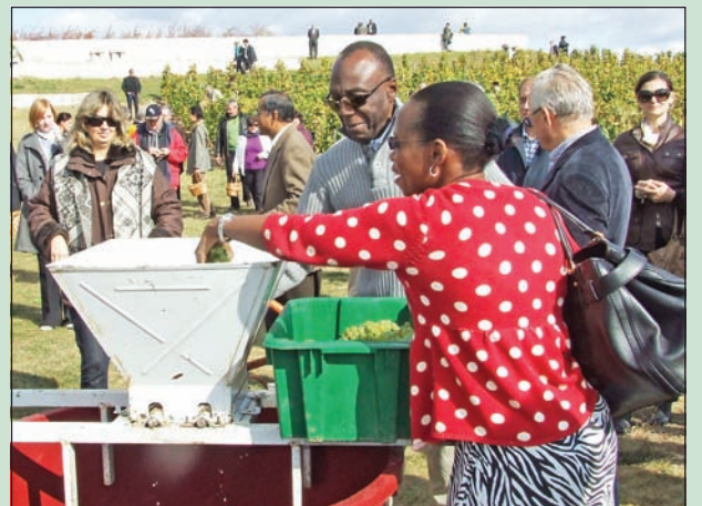
Írásunk a 10. oldalon

Hazánkba akkreditált nagykövetek, a diplomáciai testület mintegy kétszáz tagja látogatott el október 13-án a Bodrogkisfalud határában levő Patricius Borház szőlőterületére. E hagyományos program kiváló alkalom a térség borának külföldön történő népszerűsítéséhez.