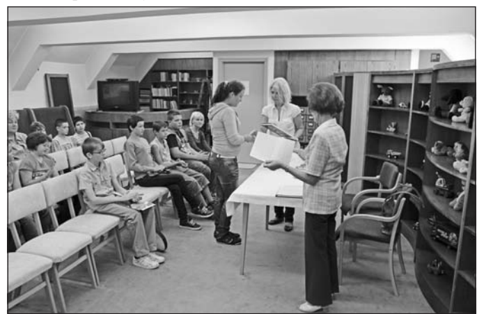
Minden résztvevő gyermek oklevelet vehetett át, a legjobbak könyvjutalomban is részesültek.

osztályos, és középiskolák 9-12. évfolyamos tanulói) jelentkezését várják. A márciusra tervezett helyi fordulókból korcsoportonként a győztes csapatok jutnak tovább a megyei, majd az országos döntőbe. A Szerencs Polgári Védelmi Iroda a területéhez tartozó oktatási intézmények részére eljuttatta a versenyfelhívást, nevznai az iskolákban kijelölt felkészítő tanároknál lehet. Az érdeklődők a www.katasztrofavedelem.hu, illetve a www.baz.katasztrofavedelem.hu honlapokon, valamint a Szerencs Polgári Védelmi Iroda 47/565-291-es telefonszámán kaphatnak bővebb információt.