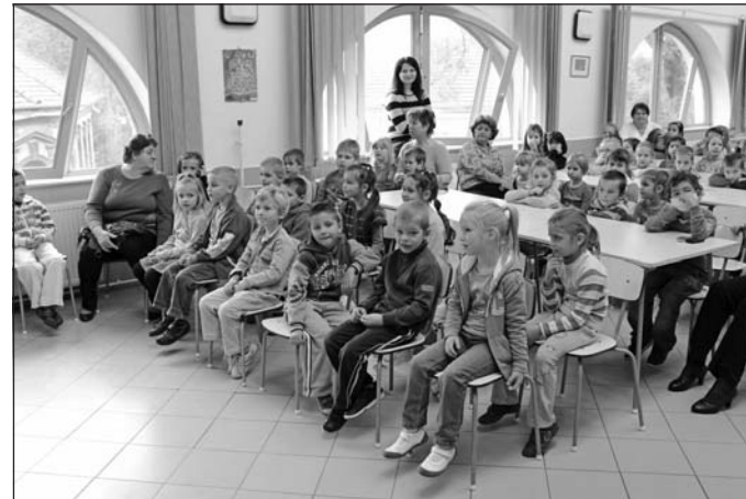
Jövőre ők is kisdíjak lesznek.

A hagyományos őszi eseményen a Csalogány, a Gyárkerti és a Napsugár óvoda leendő első osztályosai vettek részt, akiket a Bolyai iskola harmadik osztályosai fogadtak. A kisdíjak műsorral kedveskedtek az óvodásoknak: furulyáztak, szavaltak, valamint közös mondókába és éneklésbe is bevonták a kisebbeket, akik lelkesen kapcsolódtak be a játékba. Többek között elhangzott a Dióverés című vers és felcsendült az Érik a szőlő című dal is. A leendő elsősokeket Kocsisné