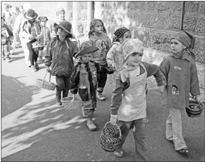
Felvonulás a város főutcáján.