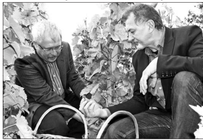
Fazekas Sándor vidékfejlesztési miniszter (balra) és Koncz Ferenc is részt vettek az eseményen.

ket, amely nemzetközi szinten is ismert. A Vidékfejlesztési Minisztérium sokat dolgozik azon, hogy minél több külföldi ismerje meg az országnak ezt a területét is, a jelenlegi program ugyan csak ezt a célt szolgálja. Biztos vagyok abban, hogy a vendégek kellemes élményekkel gazdagodnak, magukkal viszik a borvidék hírét, és ez egy komoly reklám az országnak. A mondat mindenki ismeri, miszerint a jó bornak is kell a cégér, ez nem árt az itt termelt kiváló nedűknek sem – emelte ki lapunk érdeklődésére Fazekas Sándor.