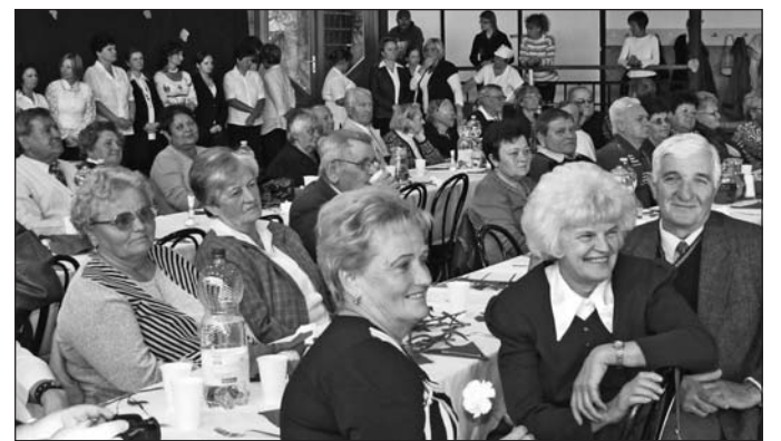
A település nyugdíjasait köszöntötték Tállyán.

Tállyán is megemlékeztek a településen élő nyugdíjasokról október 14-én. A Zempléni Árpád Általános Iskola tornacsarnokában megtartott programon a szép életkort megélt emberek iránti tiszteletet fejezte ki a helyi településvezetés, azonban a megbecsülés Tállyán az év minden napjára érvényes.