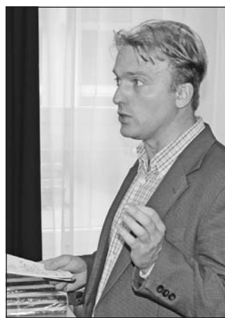
Lackfi János rendszeresen szerepel felolvasóesteken, járja az országot és rendhagyó irodalomórát tart.