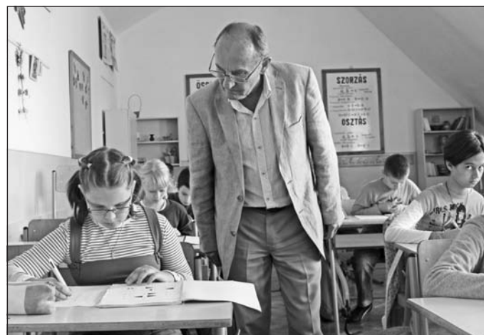
Játékos fejtörőket oldottak meg az ötödikesek.