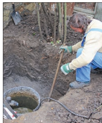
Kiváló minőségű magyar berendezéseket épít be a szolgáltató.

Többek között ez is indokolta azt, hogy a közelmúltban a házi szennyvízbeemelő egységek