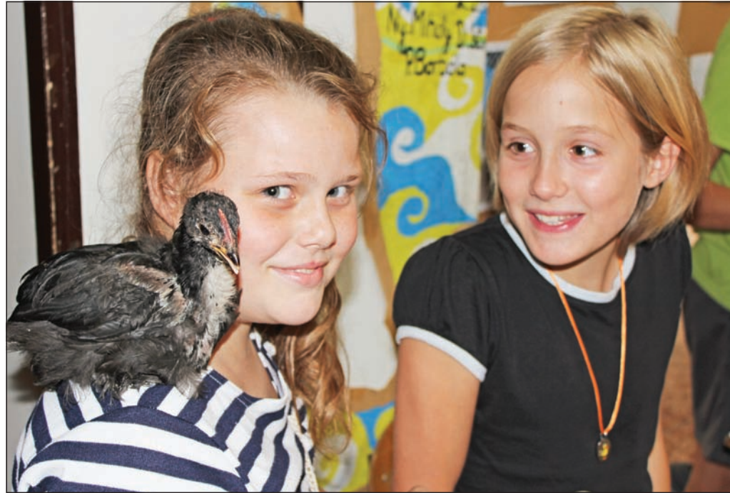
A gyerekek jó barátságban vannak az állatokkal.