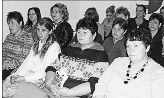
Ők azok, akik segítenek és gondoznak a mindennapokban.

tézet igazgató főorvosa bemutatja a szerencsi rendelőintézet és az alapszolgáltatási központ megalkulását körülményeit, tevékenységét. Előadásában szolt azokról a szolgáltatásokról is, amelyek kifejezetten az időskorú embereket szolgálják. Ilyenek például a mozgásszervi szakrendelések, az audiológia, az angiológia, az ideggyógyászat, valamint a