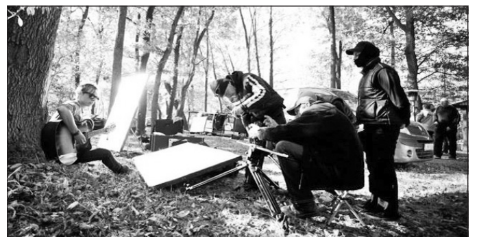
A forgatás pillanatai.

A közelmúltban különleges meghívást kapott a Szerencsi Hírek szerkesztősége: részt vehettünk az Idiot Side zenekar legújabb videoklipjének forgatásán. A Te meg én című vadonatúj dalukhoz készülő film készítésének körülményeiről a Szerencsi Városi Televízió is készített összefoglalót.