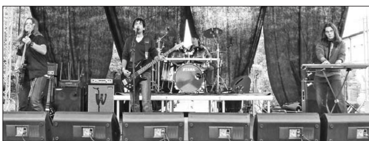
Színpadon a szerencsi Echonald.

kora esti órákig igyekeztek csalogatni a közönséget a fesztivál helyszínére. A nap végén a zsűrinek döntenie kellett, hogy mely csapat nyerte el leginkább a tetszésüket. Az ünnepélyes eredményhirdetésen kiderült, hogy a Spirit Blue kapta a szervezők 30 ezer forintos fődíját, a második helyen a Dopping végzett a szerencsi Join zenekar előtt.