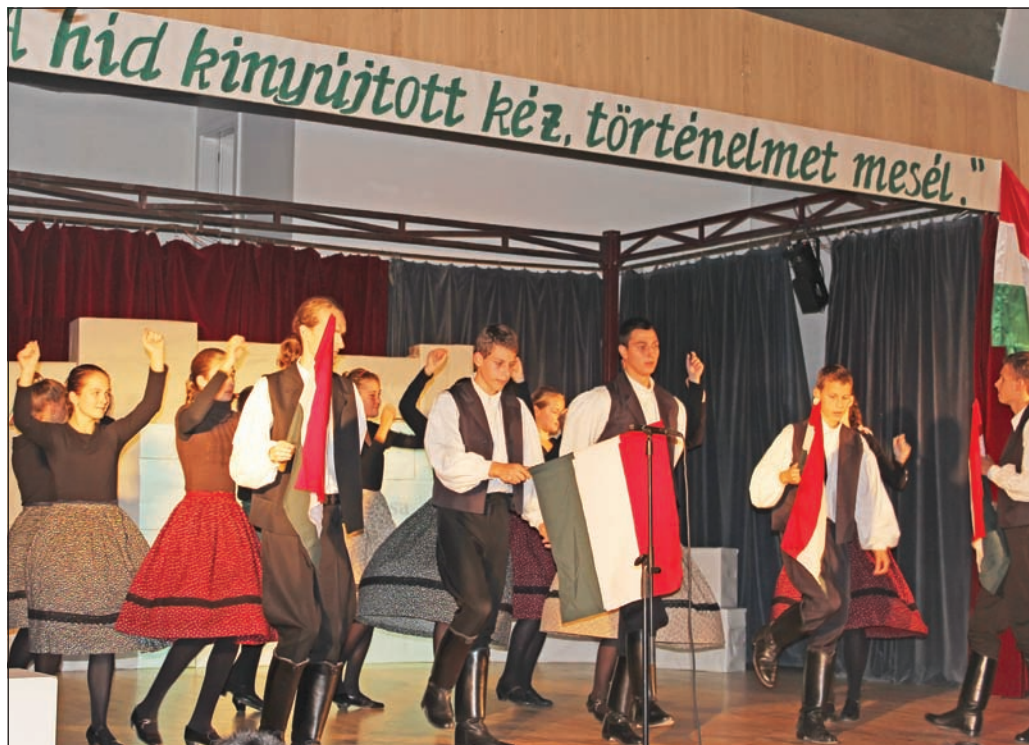
Feledhetetlen műsort adtak a rákóczi diákok.

Az 1956-os forradalom és szabadságharc kezdetének 55. és a Magyar Köztársaság 1989. évi kikiáltásának 22. évfordulója alkalmából szerveztek megemlékezéseket október 21-én és 23-án Szerencsen.