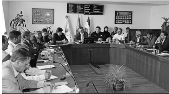
Tanácskozik a védelmi bizottság.

A katasztrófavédelmi rendszer jövő évi változásairól és új elemeiről a védelmi bizottsági ülés keretében tájékoztatták a szerencsi, a tokaji, valamint az abaúj-hegyközi kistérség képviselőiben megjelent polgármestereket október 25-én a polgármesteri hivatalban.