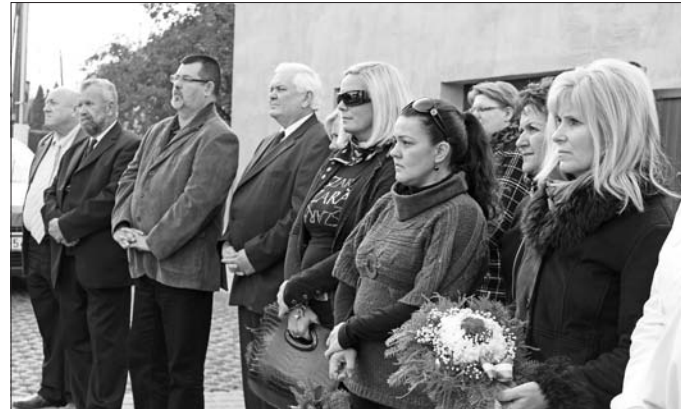
A Kazinczy utcában idézték az író, költő alakját.

ladás szellemét képviselő reformátor életútját Dudás Evelin ismertette, majd Csendes Petra furulyajátékát követően Korán Laura szavalata hangzott el: „Úgy beszéljen ki-ki magyarul, mintha imádkozna!” – fogalmazódott meg Reményik Sándor: Az Ige című versében. A megemlékezés zárásaként az önkormányzat és a két szerencsi általános iskola képviselőiben megjelentek koszorút helyeztek el Kazinczy Ferenc márványtáblájánál.