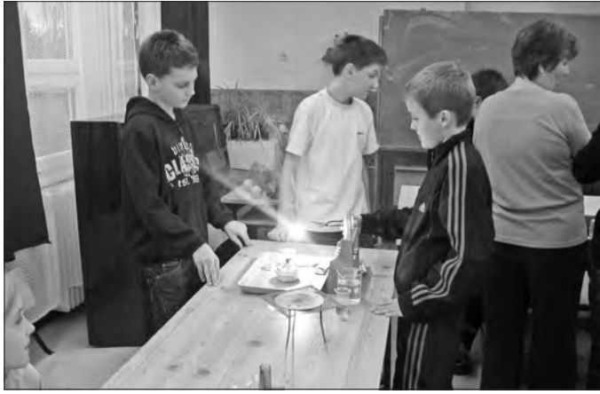
A fizika iránt érdeklődő tanulók.

A Rákóczi Zsigmond Általános Iskolában a november a reáltantárgyak jegyében telt. Matematikortörténeti kutatásokat végeztek és versenyfeladatokat oldottak meg a programokon résztvevő tanulók. A szórakoztató és gondolkodtató feladványok, keresztrejtvények, képrejtvények kerültek előtérbe a versengés során. A végső sorrendet a matematikai totó döntötte el. A pályázatok elkészítése hosszabb időt igényelt, ezért ezeket előzetes feladatként kapták azok a tanulók, akik szívesen foglalkoznak a szabadidejükben is egy adott téma felkutatásával, összegzésével. Színvonalas pályamunkák érkeztek, melyeket iskolánk aulájában állítottunk ki, hogy mindenki számára elérhető, megtekinthető legyen. Programunk zárásaként fizikai és kémiai kísérletet mutatott be két kollégán. Az ötödikes-től a nyolcadikosig minden év-