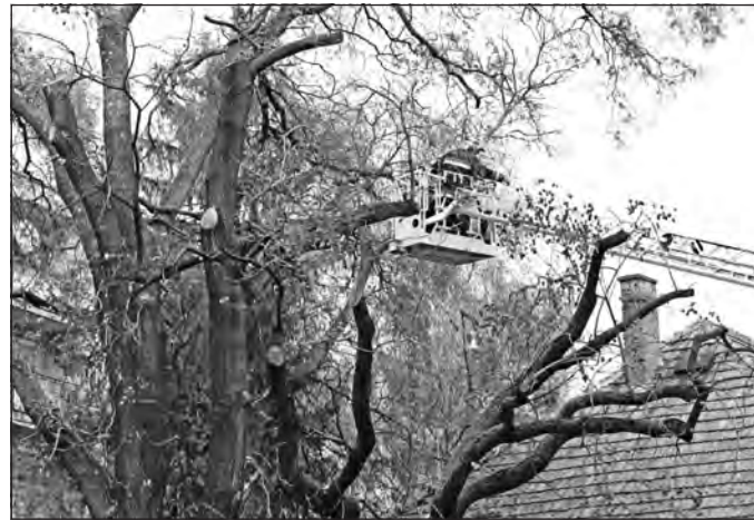
A szerencsi tűzoltók segítették a munkát.

A Szerencsi Városgazda Non-profit Kft. októberben kezdte meg a Kossuth tér fáinak metszését. Néhányan úgy vélték, hogy a japánakácok csonkítása tönkretette a nyári melegben oly kellemes árnyékot nyújtó belvárosi zöldterületet. Mint megtudtuk, a cég nem rendelkezik olyan eszközökkel, melyekkel el tudnák végezni a magas fák visszavágását. Külsős cég igénybevétele jelentős költséget jelentett volna, ezért inkább a Szerencsi Hivatásos Önkormányzati Tűzoltóságot hívták segítségül.