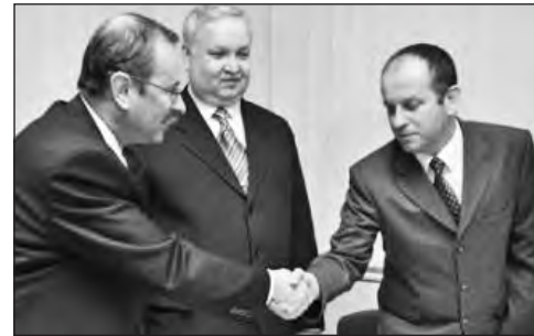
Szervezettebbé kell tenni az együttműködést.

igazgatás kiépítése részét képezi a kormányzat programjának, igyekeznek összehangoltan elvégezni az ellenőrzési feladatokat úgy, hogy követik a jogszabályok változásait. A főigazgató reményének adott hangot, hogy az együttműködési megállapodás a többszörös megkereséseket illetően is pozitív változást hoz. SfL