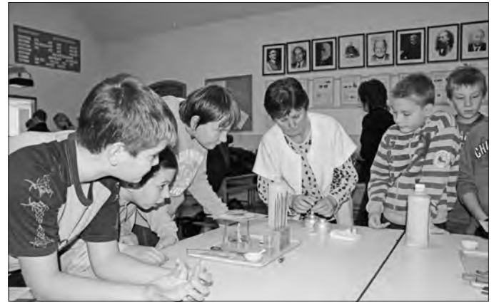
A diákok örömmel vettek részt a kísérletek bemutatóján.

vel korcsoportonkénti házi futball-bajnokságot rendeztek a diákoknak, a tudomány világára kíváncsi fiúk és lányok pedig fizika, kémia, biológia és földrajz kísérleteket tekinthettek meg, illetve próbálhattak ki. Ennek keretében az 5-6. osztályosok a számukra még ismeretlen áramkör-összeszerelést gyakorolhatták, valamint a felületi feszültséggel és a légnyomással kapcsolatos kísérleteket végeztek. A „kis biológusok” többek között a baromfik máját tanulmányozták, és mikroszkóppal vizsgáldottak, a földrajz iránt érdeklődők csillagtérképet készítettek, a kémia rejtelmeire fogékony diákok pedig égéssel kapcsolatos kísérleteket végeztek. A Bolyai-napok jegyében érdekes matematika-feladványokat oldottak meg a fiatalok a tanórák keretében, hogy tanáraikkal ezzel is népszerűsítsék körükben a matematika tudományát. A programsorozat keretében késő délután szülő-nevelők fórumát tartottak a Rákóczi-várban, ahol Koncz Ferenc polgármester köszöntötte a résztvevőket, majd a program meghívott előadója, Czeizel Endre tartott előadást „A roma gyerekek sorsa a genetikus szemé-vel” címmel. – A kutatások szerint a romák genetikailag nem térnek el a magyar lakosságtól, de nem kell mondanom, hogy az értelmi fogyatékosok közötti részarányuk sokkal magasabb, kevesebben érnek el magas iskolai végzettséget, éppen