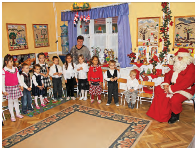
Minden gyermek várta az ajándékosztót.

A szerencsi Gyárkertesi, a Csalogány, illetve az ondi óvodába december 6-án érkezett meg a Téliapó. A gyermekek örömmel fogadták a pirosruhás öregget, néhányan énekekkel, versekkel, táncokkal készültek az eseményre. A Napsugár óvodában