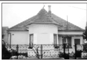
Szerencsen háromszobás, amerikai konyha, korszerűsített, jó helyen lévő családi ház nagy kerttel sürgősen eladó vagy kiadó. Ára: 5,5 M Ft. Érd.: 70/618-1054. (8-9)