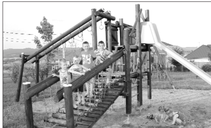
Támogatásból újult meg a játszótér.

Koncz Ferenc rendszeres adományainak köszönhetően a Scholtz Jenő Alapítvány támogatja többek között a művészeti iskola zenei tanszakát. Így tudták a rászoruló gyermekek tandíját kiegészíteni 66 ezer forint értékben, de tavaly hozzájárultak a fiatalok versenyzetetéséhez, továbbá kisebb értékű eszközök – könyv, kotta – vásárlásához 103 ezer forint erejéig. Az alapítvány a két évtizedes jubileumán már bronzplakettel ellátott Scholtz Jenő-díjjal tudja elismerni az eredményes tanulókat.