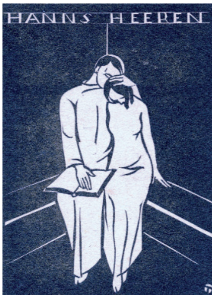
A Zempléni Múzeum gyűjteményéből.

Ez hát a legszebb utca Pesten. Fagyhatár: Forró-hideg városodban. Tündérmese hidegrázása bennem. Megállunk jeges parkokban. A fogunk koccan; forrón, égetőn vág a jeges szél. Végigmegyünk ma minden úton, ahova akartad, hogy menjél. Kék tűz izzása fogva tart. Nincs kesztyű, ami most kéne, csak érzem még kicsit, míg tart; hidegen éget az ujjad vége. Reggel, este, álomból felébredve, bűvölet utcájában járok. Forrón hideg kezem kezedben, ismét oda, hozzád vágyok.