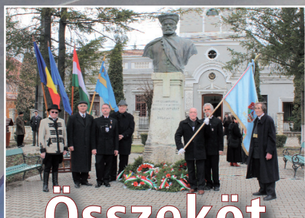
Összeköt a közös múlt