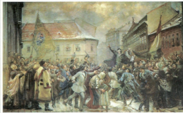
Thorma János: Talpra magyar!