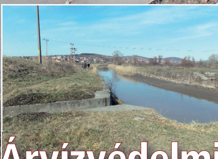
Árvízvédelmi beruházás Szerencsen