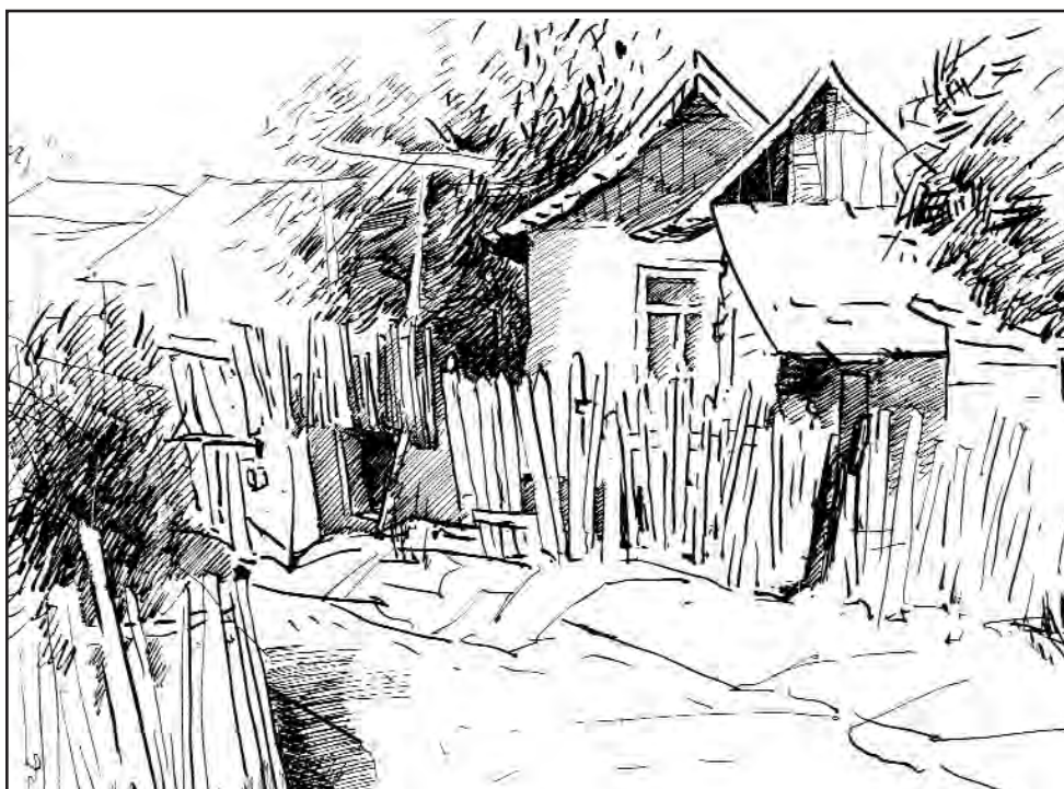
Schlosserné Báthory Piroska rajza.

Kapolcsi versíró verseny, 2008. július 25.