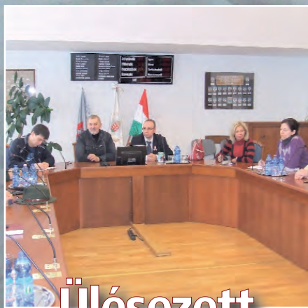
Ülésezett a Helyi Védelmi Bizottság