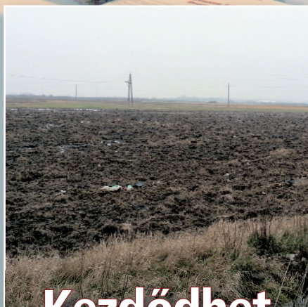
Kezdődhet a beruházás