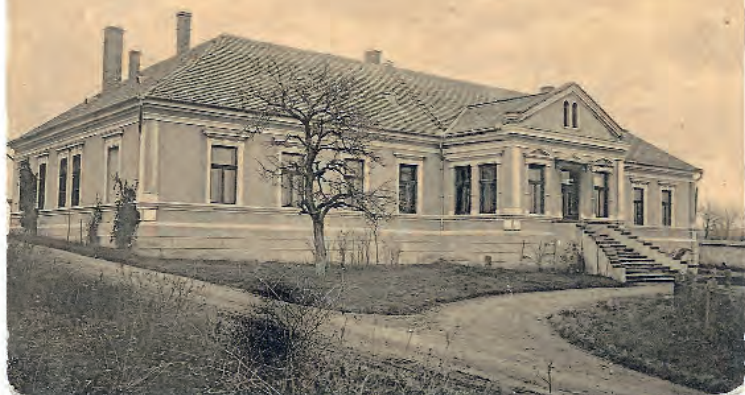
Zemplén vármegye főszolgabírói hivatala