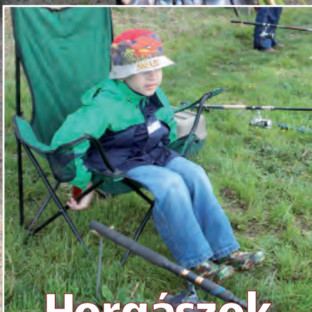
Horgászok szerencsi versenye