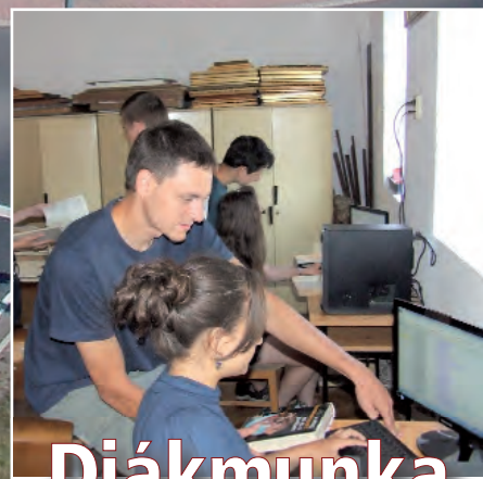
Diákmunka szerencsi fiataloknak