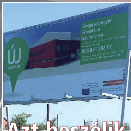
Azt beszélik a városban...