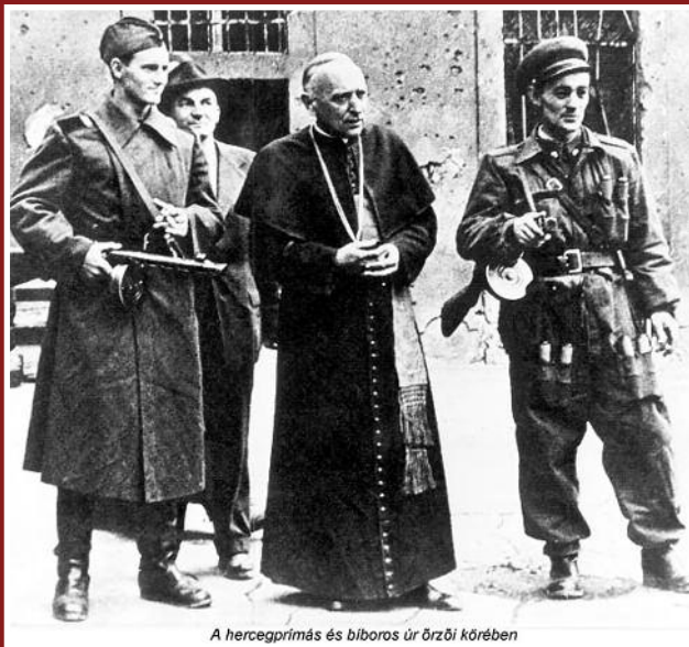
A hercegprímás és bíboros úr őrzői körében