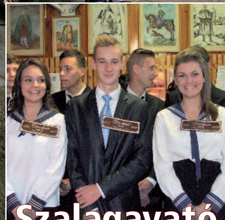
Szalágavató a gimnáziumban