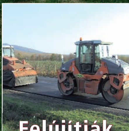
Felújítják a 37-est