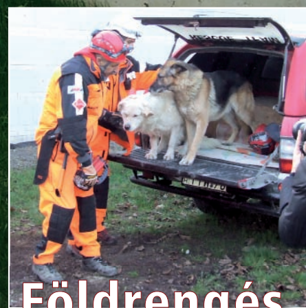
Földrengés, áradás és tűz