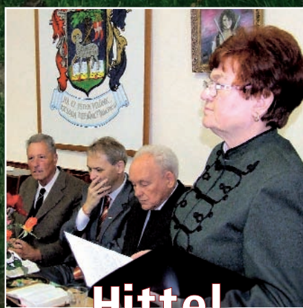
Hittel is gyógyítanak