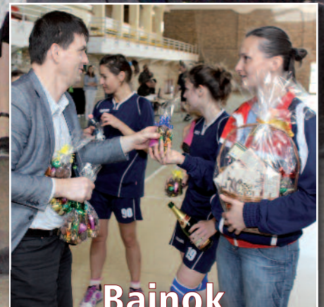
Bajnok a kézilabdacsapat