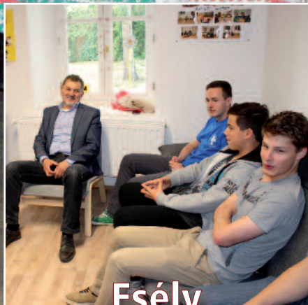
Esély a gyermekeknek