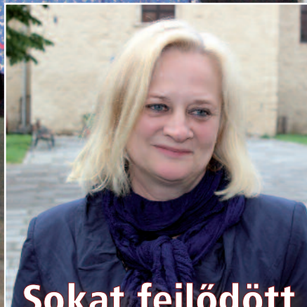
Sokat fejlődött az Önök városa