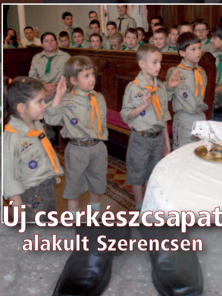
Új cserkészcsapat alakult Szerencsen