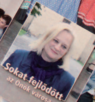
Sokat fejlődött az Önök városa