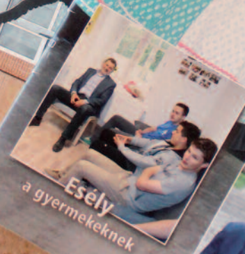
Esély a gyermekeknek