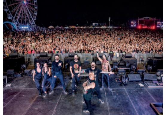
A vasárnapi Hooligans koncert