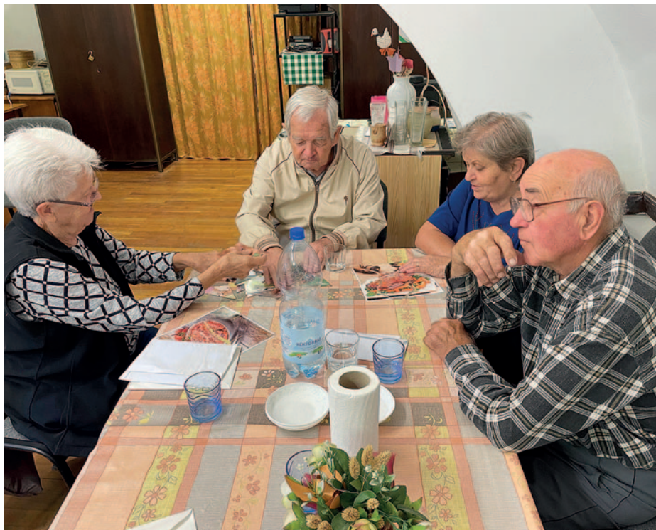
Hetente kétszer találkoznak a Városi Nyugdíjas Klub tagjai