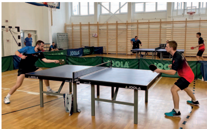
Nehéz év vár a szerencsi asztaliteniszezőkre