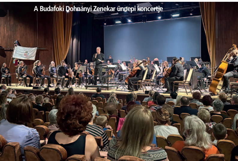
A Budafoki Dohnányi Zenekar ünnepi koncertje

A Zempléni Településszövetség (ZTSZ), az ország egyik legnagyobb önkormányzati szerveződése idén ünnepi megalakulásának 30. évfordulóját. Az 1994-ben 28 zempléni polgármester által alapított szervezet széles körű tevékenysége felöleli az érdekképviselést, a gazdaság- és társadalomfejlesztési kezdeményezéseket, erősíti a civil szférát és a határ menti együttműködéseket. A szövetség mára közel hetven települési önkormányzat és számos magánszemély, valamint vállalkozás csatlakozásával egy olyan közösséget alkot, ami egyedülálló országunkban. A ZTSZ az elmúlt évtizedek változásai mellett is képes volt a különböző tájegységek közötti párbeszéd biztosítására, a térség erőforrásainak mobilizálására, a társadalmi önszerveződés elősegítésére. A közösség új hagyományokat, rendezvényeket honosított meg, együttműködő partnerekre talált. Mindezt úgy, hogy töretlenül hitt a zempléni régióban élők tenni akarásában, a közösség erejében. Ezt a közös Zempléni ünnepelték a meghívottak és szervezet polgármesterei Sárospatakon, a Művelődés Háza és Könyvtára épületben. Az esemény poszterkiállítással kezdődött a ZTSZ fotóiból, majd ezt követően a program az ünnepi közgyűléssel folytatódott, ahol átadták az elismeréseket és kitüntetések is. Az eseményt a Budafoki Dohnányi Zenekar ünnepi hangversenye zárta.