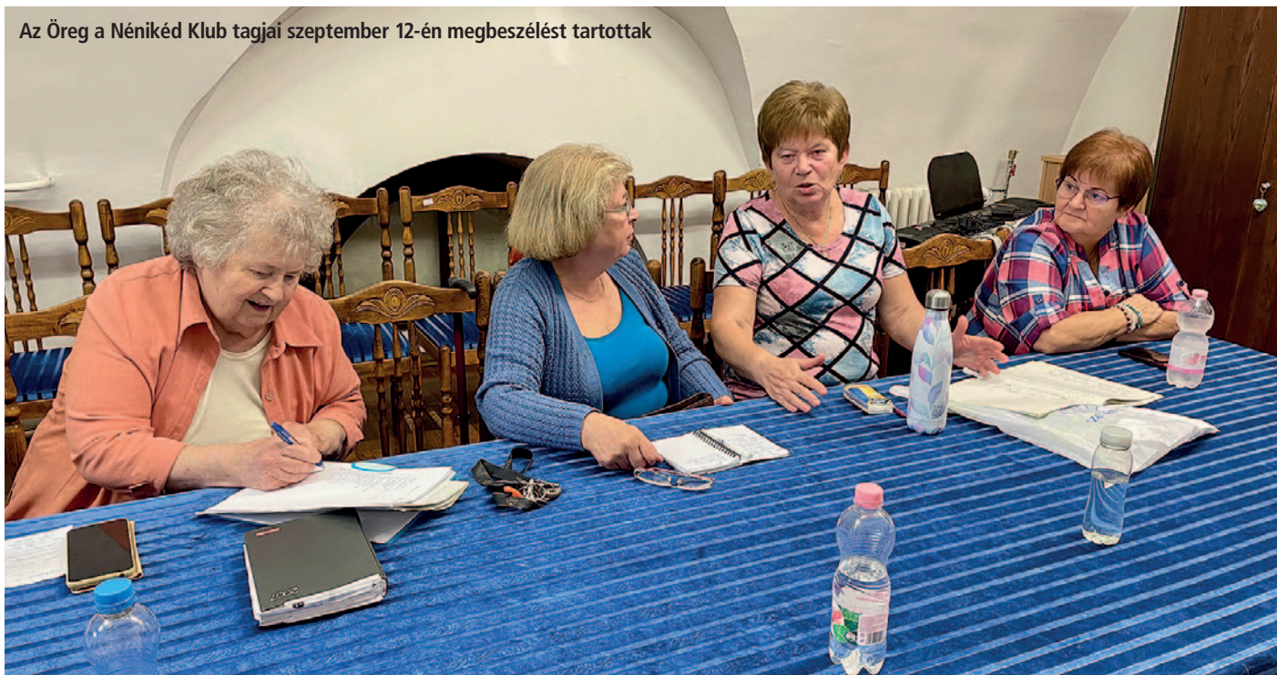
Az Öreg a Nénikéd Klub tagjai szeptember 12-én megbeszélést tartottak

A klub azonban már nem olyan aktív, mint a kezdetekkor, hiszen az idő múlása, a tagok életkora és egészségi állapota is hatással van a tevékenységekre. A kezdeti lendület némileg alábbhagyott, de a közösség továbbra is igyekszik fenntartani a klub működését és új tagok csatlakozását is örömmel fogadják. Az Öreg a Nénikéd Klub egy olyan hely, ahol az idősebb generáció tagjai közösségre találhatnak, tanulhatnak és emlékezhetnek. Az évek során számos változás történt, de a közösség ereje és az egymás iránti törődés változatlan maradt. Az Öreg a Nénikéd Klub minden új tagot szívesen lát sorraiban, minden csütörtökön megtalálható a Rákóczi-vár kaszinótermében.