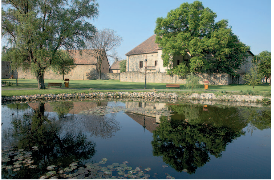
A Rákóczi-vár tava 2009-ben

A fürdő épületének felújítása során egy napozó terasz is épült. A hozzá kapcsolódó napozókeretet sok fával és bokorral ültették be, az íves kerítés mentén magasra nevelt, nyírt gyertyánsövények labirintusát hozták létre, s a kerítésen kívül hársfasort ültettek. Az idők során a várkert területébe ékelődött templomkert park felőli dűledező kerítését, támfalát és a bozótost elbontva egy hosszú rézsút alakítottak ki, különböző cserjefajtákkal beültetve. Innen déli irányban laza, gyepes-ligetes lejtős parkrész készült a tó menti sétányig. Megoldódott a templomkert bejáratának és kerítésének felújítása, bekerültek a kerítésfal egyik részébe az elektromos szekrények is. A körüljárás miatt zúzott-köves kerti út készült a templom körül ovális