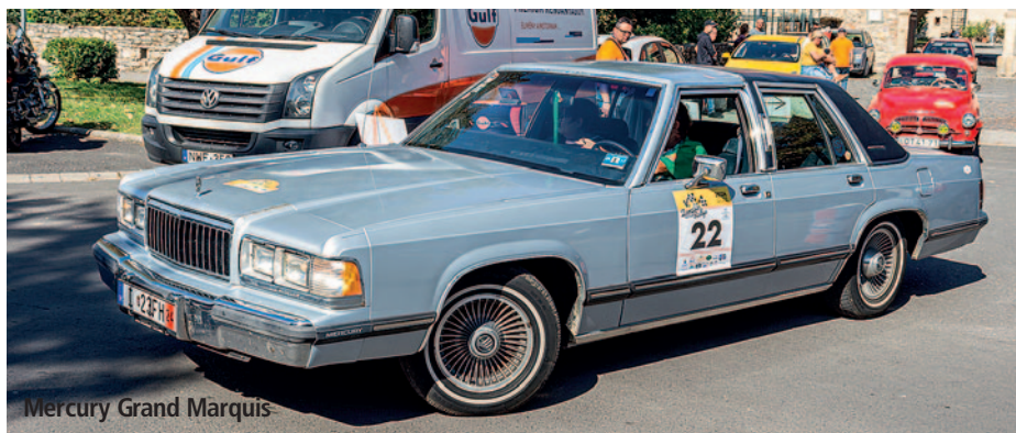
Mercury Grand Marquis

Az idei versenyre 24 jármű érkezett az ország minden tájáról, de Szlovákiából és Romániából is voltak nevezők. Az autók között megtalálható volt egy Ferrari 400i, Mercury Grand Marquis és egy Ford Destiny is. A rendezvény nemcsak a versenyzők számára nyújtott kihívást, hanem a nézőknek is különleges látványosságot biztosított. Az autók patinás megjelenése és a veterán járművek autentikus hangulata igazi időutazást kínált mindenkinek, aki ellátogatott a szerencsi Rákóczi-várba.