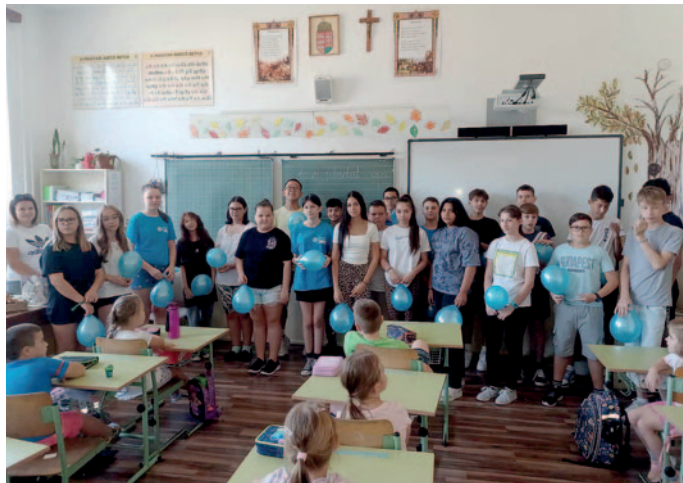
A Bolyai iskola egy egész hetes rendezvénysorozattal ünnepelte meg védőszentjük születésnapját