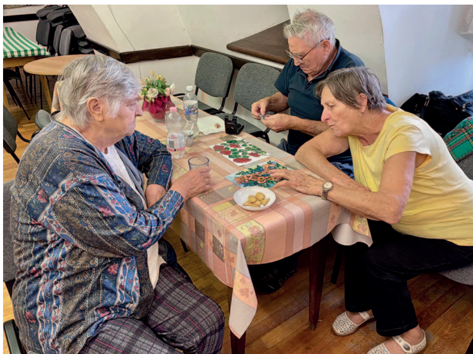
Minden foglalkozáson helyet kap egy kis társasjáték