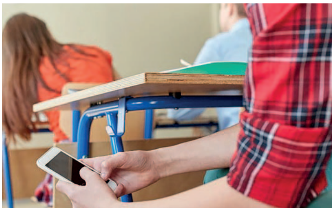
Tilos a telefon

Idén szeptember elsején ért véget a nyári vakáció, majd másodikán kezdetét vette az új tanév.