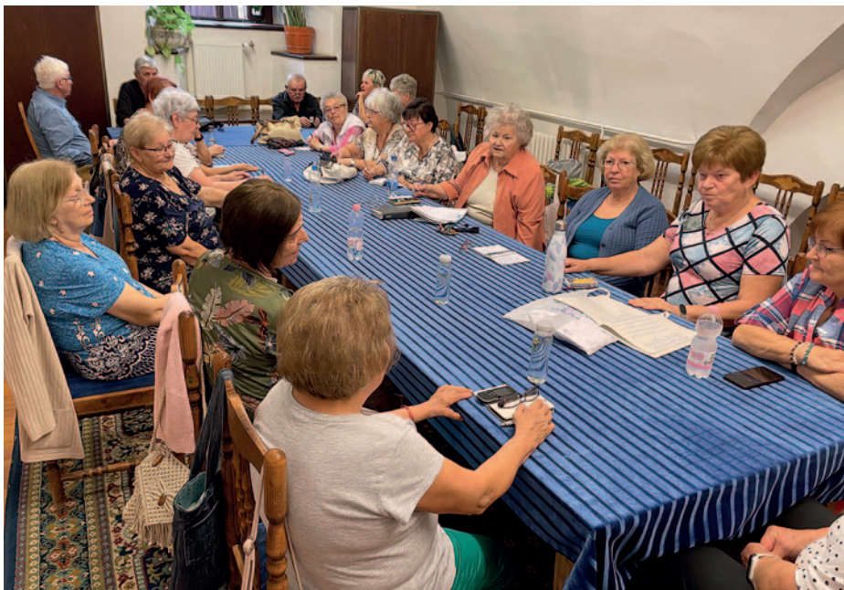
A klub tagjai rendszerint a kaszinóteremben találkoznak