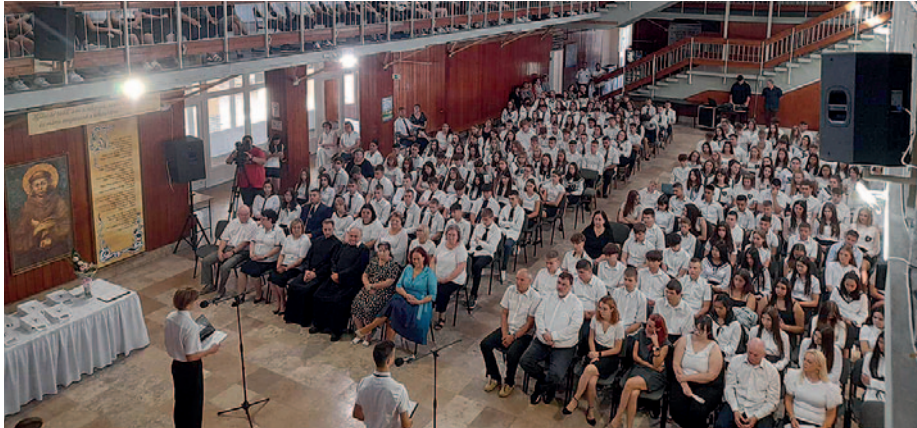
Tanévnyitó a Bocskaiban

A Bocskai István Katolikus Gimnázium és Technikum nyara a fejlődés és megújulás jegyében telt, számos infrastrukturális fejlesztés valósult meg az Egri Főegyházmegye támogatásával. A diákokat és pedagógusokat modern, energiatakarékos környezet várja az új tanévben. Az intézmény nemcsak a gimnázium, hanem a Szent Kinga Tagóvoda megnyitásával is bővült, amely már a legkisebbek számára is biztosítja a színvonalas nevelés feltételeit – tájékoztatta szerkesztőségünket az iskola vezetősége.