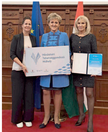
A Rákóczi iskola vezetősége átvette a címet

A Minősített Tehetséggondozó Műhelyek többletfeladataik ellátásához anyagi, illetve komplex szakmai támogatást kapnak. A műhelyek szol-