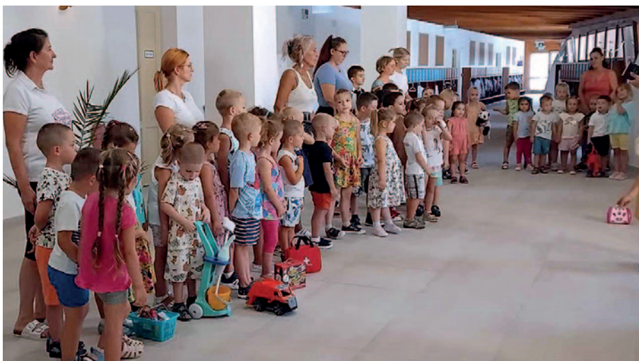
A katolikus óvoda is megkezdte működését