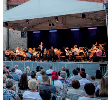
A Miskolci Szimfonikus Zenekar augusztus 29-ei koncertje