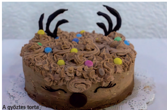
A győztes torta