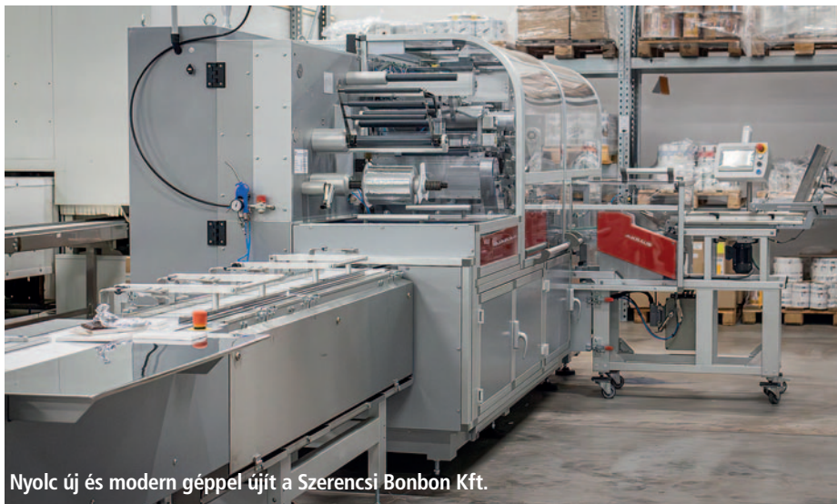
Nyolc új és modern géppel újít a Szerencsi Bonbon Kft.

Koncz Zsófia, a térség országgyűlési képviselője, a Kulturális és Innovációs Minisztérium családokért felelős államtitkára köszöntőjében kiemelte a szerencsi csokoládégyártás 101 éves hagyományát, amely mélyen összefonódik a város identitásával. Méltatta a vállalkozás fejlődését, amely 1996-ban indult újra, és ma már 130