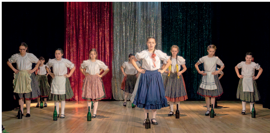
A kultúra ápolása volt jótékonysági gálarendezvény fő célja

A kultúra továbbadásának leghatékonyabb módja a művészeti oktatás – közölte a Miniszterelnöki Irodát vezető államtitkár december 12-én a szerencsi Rákóczi-vár Színháztermében, a Térségi Alapfokú Művészeti Iskola, a Tegyük a jövő géniuszaikért! Alapítvány és a helyi tankerületi központ közös jótékonysági gálarendezvényén.