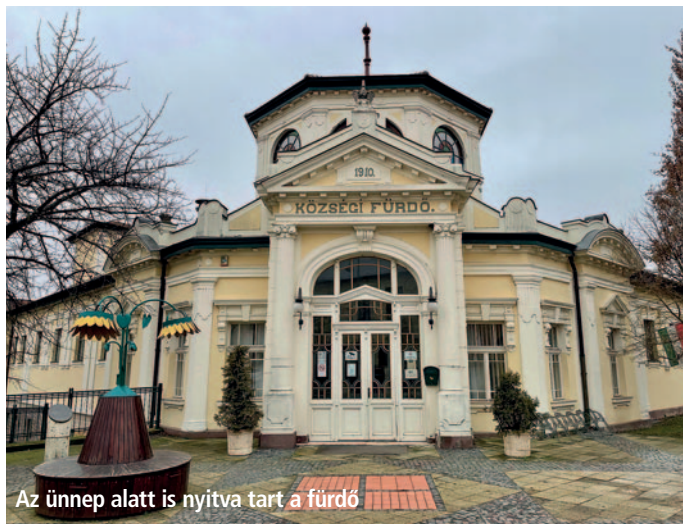
Az ünnep alatt is nyitva tart a fürdő

Az év végi időszak ideális lehetőség arra, hogy a helyi lakosok kikapcsolódjanak és feltöltődjenek a Szerencsi Fürdő & Wellnessházban. Az intézmény változatos szolgáltatásokkal várja a vendégeit: úszómedence, jakuzzi, finn szauna, gőzkabin, sókamra és fallabda.