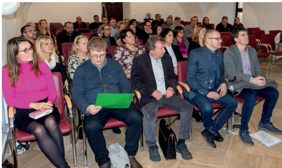
Az értekezletet a Rákóczi-vár Lovagtermében tartották

A Rákóczi-vár lovagterme adott otthont a Szerencsi Járási Hivatal által szervezett értekezletnek, amelyen a régió településeinek vezetői és közfoglalkoztatási ügyintézői vettek részt, november 20-án.