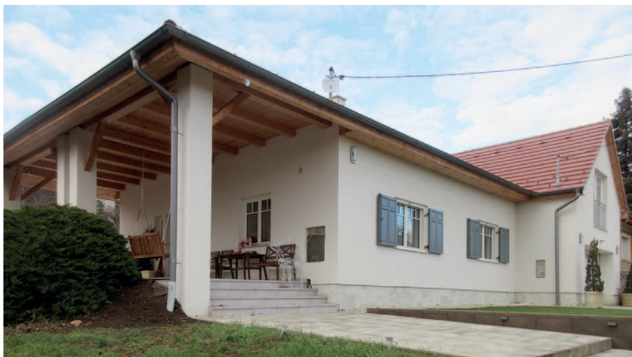
A fa fotelek hívogató hangulata szinte kedvet csinál egy nyáresti borozgatáshoz a teraszon

A jó arányú, egyszerű, de mégis mutatós épületek egyik jó példája a Hegy utcában álló egyik lakóház. A telken egy tízszer-tízes kockaház állt, és annak bővítésével jött létre néhány éve a most látható hosszúkas épület. A kockaház megjelenését két alapellel könnyedén meg lehetett változtatni: az utcára oromfallal néző jobb oldali épületrész, a keresztzárny, és a bal szélső, lábakon álló terasztető. Ez a két egyértelmű és könnyen adódó motívum megjavította a kockaház