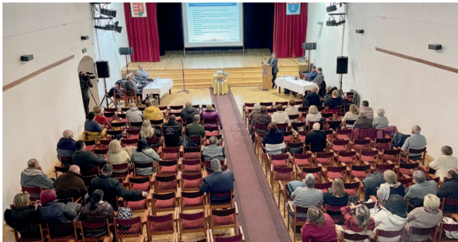
Az élő közvetítést több százan követték online

A következőben a polgármester beszámolt a lezárt és fenntartásba került projektekről. Összesen négy ilyen projektről beszélt. Az elsőként a TOP-2.1.3-16-B01-2017-00006; -00005; 00004