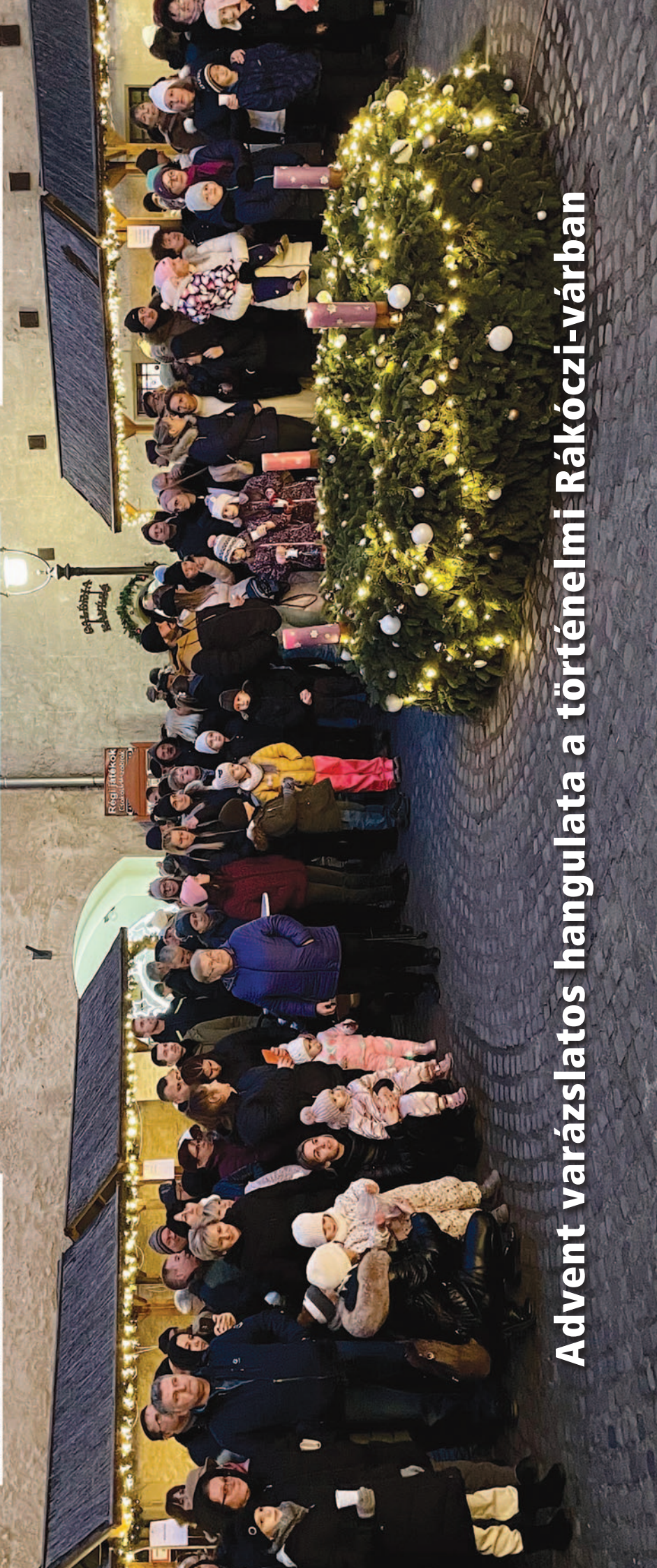
Advent varázslatos hangulata a történelmi Rákóczi-várban