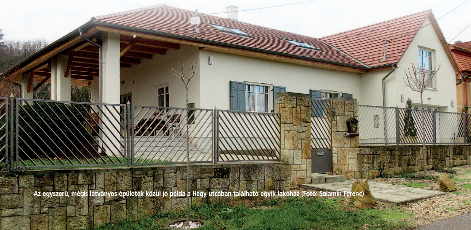
Az egyszerű, mégis látványos épületek közül jó példa a Hegy utcában található egyik lakóház