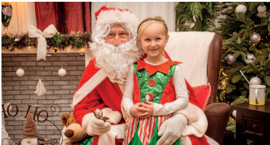
A nagyszakállúval fotózkothattak a gyerekek

öt év után újra a tortasütő verseny, amiről bővebben a 16. oldalon írunk. Az édes élmények