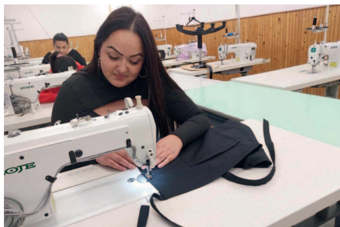
A divatszabó tanulók is besegítettek az iskoláknak

A divatszabó tanulók szakmai együttműködés keretében a Szerencsi Szakképzési Centrum Sátoraljaújhegyi Trefort Ágoston Szakképző Iskola Abaujkéri Telephelyére is készítettek függönyöket és abroszokat. Ez a projekt egy újabb példája annak, hogy a Szerencsi Szakképzési Centrum különböző intézményei összefognak a közös célok elérése érdekében. A függönyök és abroszok nem csupán esztétikai szempontból jelentősek, hanem hozzájárulnak az abaujkéri intézmény kellemesebb és otthonosabb légkörének megteremtéséhez. A divatszabó diákok számára ez a feladat újabb értékes tapasztalatot jelentett a tervezés, a szabás és a varrás terén.