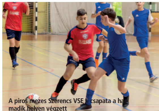
A piros mezű Szerencs VSE I. csapata a harmadik helyen végzett

A szervezők elégedettek voltak a meccsek színvonalával és a fiúk teljesítményével, különösen a torna végén mutatott játékkal. Ez az esemény remek lehetőséget biztosított az egyesületek számára, hogy felmérjék, miben kell még fejlődniük a tavaszi szezon kezdetéig. Az eredményhirdetésen