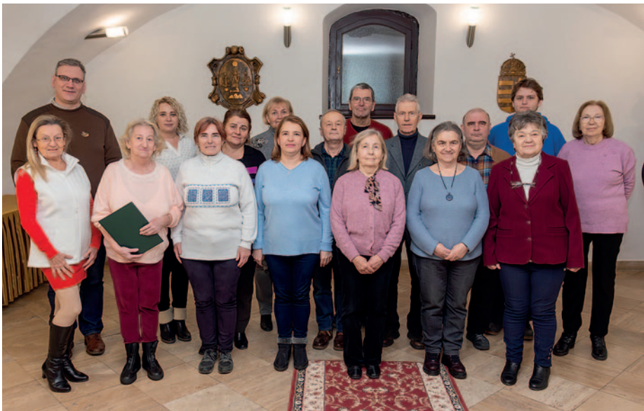
A kórustagok optimisták a jövőt illetően

Az 1990-es évektől a kórus tagjai számára az utazás és a nemzetközi kapcsolatok jelentették a legtöbbet. Eleinte Szlovákiába, Lengyelországba és Erdélybe jutottak el, majd megnyiták a határokat Olaszországban, Görögországban és Franciaországban is felléptek. A tagok számára a kórus szó szerint kinyitotta a világot. Az évtizedek során számtalan díjat és elismerést kaptak. A Hegyalja Pedagógus Kórus 1989 előtt megkapta a „Szocialista Kultúráért” kitüntetését. Kétszeres, majd örökös „Kiváló Együttes” díjuk is van. Az országos minősítéseken vegyeskari kategóriában fesztiválkórus fokozatot ért el. Hatszor nyerték el a Magyar Rádió aranyplakettjét. A 25 éves évfordulójukon, 1994-ben Kodály emlékérmét és Pro Urbe Szerencs díjat kapott a kórus. Ezek az elismerések nem csupán a magas művészi színvonalat tükrözik, hanem a közösségért és a magyar kultúráért végzett értékes munkájukat is. Sikereik hozzájárultak Szerencs és a régió hírnevének öregbítéséhez, egyfajta kulturális nagykövetségként képviselve a