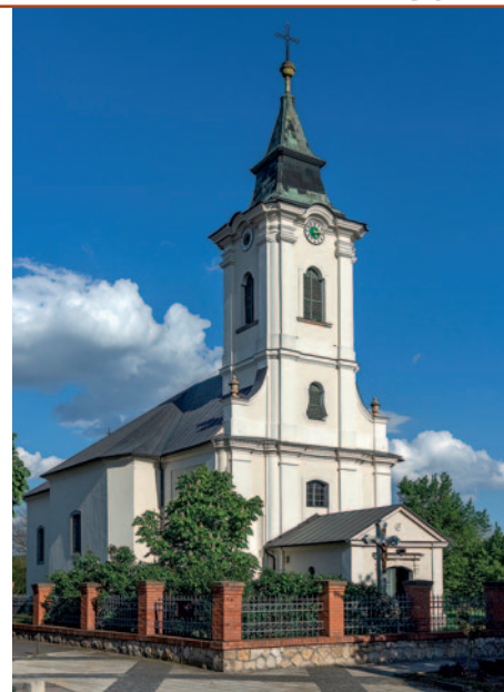
Szerencsi Kisboldogasszony római katolikus templom

Az egyik kormányrendelet előírja, hogy minden településen legyen valamilyen formában főépítész, vagy egyénileg, vagy társulások formájában alkalmazva. Sokan érezhetik, hogy megint egy újabb embert „ültetnek a nyakukba”, de tapasztalatom szerint az építésügyben is szükség van hozzá értő emberre, ahogy pl. az egészségügyben is. Egy kistérségi összejevetelen azt tanácsoltam a polgármester hölgyeknek és uraknak, hogy próbáljanak ebből a „rossz” fejleményből valami jót kipróbálni, ha már van egy szakemberük, akkor kérjenek tőle szakmai segítséget, hátha újabb szempontokat tud nekik felvetni, hátha érdemes lesz megfogadni a tanácsát. Azok a települések általában rendezettebbek, szebbek, egységesebb a településkéjük, ahol már több évtizede van főépítész, és ahol néha hallgatnak is rá. És ahogy orvos választás-