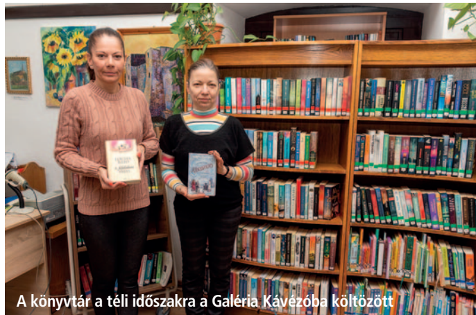
A könyvtár a téli időszakra a Galéria Kávézóba költözött