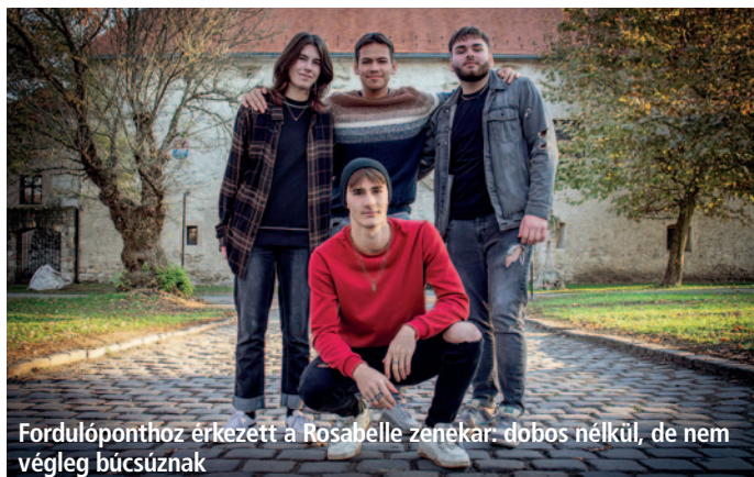
Fordulóponthoz érkezett a Rosabelle zenekar: dobos nélkül, de nem végleg búcsúznak