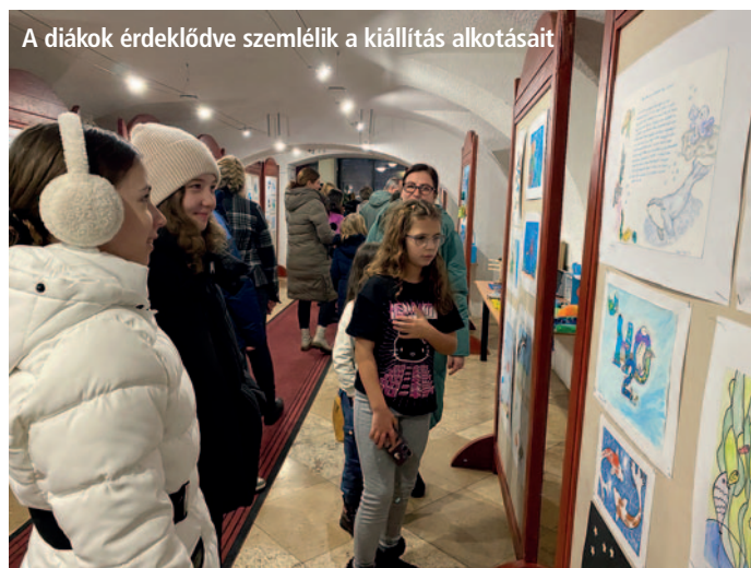
A diákok érdeklődve szemlélik a kiállítás alkotásait