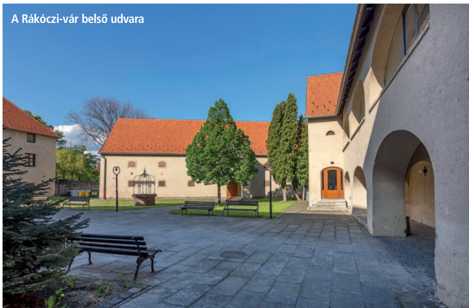
A Rákóczi-vár belső udvara