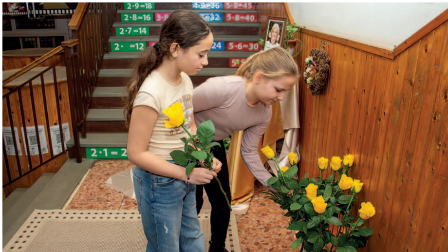
Egykori iskolájában minden évben megemlékeznek Anitáról