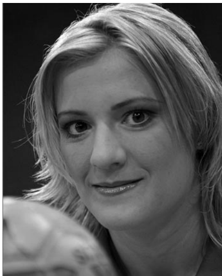
20 éve hunyt el tragikus körülmények között a világ legjobb beállója, Kulcsár Anita

Kézilabdás karrierje a nyíregyházi Kölcsey Ferenc Gimnáziumban indult, ahol kimagasló teljesítményével még jobban magára irányította a fi-