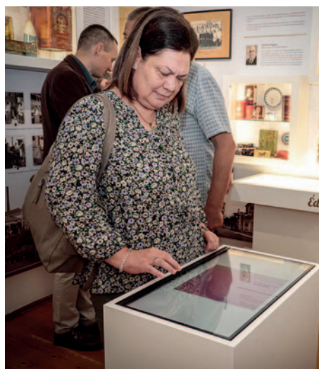
Interaktív táblák segítik a múzeumi élményt

A Zempléni Múzeum sikeres évet zárt tavaly. A 2023 és 2026 közötti időszakra kitűzött legfontosabb célok között a meglévő kiállítások műszaki karbantartása és folyamatos működtetése szerepel kiemelt helyen.