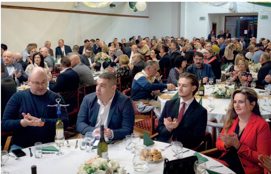
Kiss Attila polgármester őszinte párbeszédet folytatott a szerencsi vállalkozókkal

A polgármester hozzátette: A tavalyi év végén az önkormányzat több mint 200 millió forint támogatást kapott, amellyel sikerült rendezni a 70 millió forintos folyószámlahitelt és a 160 millió forintot meghaladó lejárt számlákat, amelyek sok helyi vállalkozást érintettek. A városvezető kiemelte a helyi vállalkozások jelentőségét, amelyek mintegy 800 millió forint adóbevétellel járulnak hozzá a Szerencs működéséhez, és több ezer munkahelyet biztosítanak a régióban. A polgármester kitért az őszinteség fontosságára. Megosztotta személyes tapasztalatait, hogy az elmúlt 20 évben vállalkozóként, cégvezetőként maga is meghívottak között ült, és több mint 30 évet dolgozott egy közszolgáltató társaságnál. Beszélt arról, hogy tisztában van a vállalkozók felelősségével, a gazdasági társaságok működésével, az adófizetési határidőkkel és a bérfizetéssel kapcsolatos teendőikkel. Úgy folytatta, hogy nemcsak állami és önkormányzati tulajdonú gazdasági társaságokat vezetett, hanem több évtizede családi vállalkozásai is vannak. Ezért átérzi a kisvállalkozók és a nagyvállalkozók felelősségét egyaránt. Végül kifejezte reményét, hogy a következő öt évben sikeres lesz az önkormányzat és a cégek közötti együttműködés.