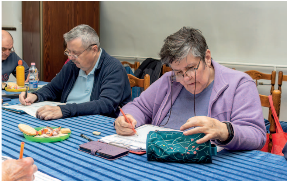
A 100 éves magyar keresztrejtvényt ünnepelték a rejtvényfejtők